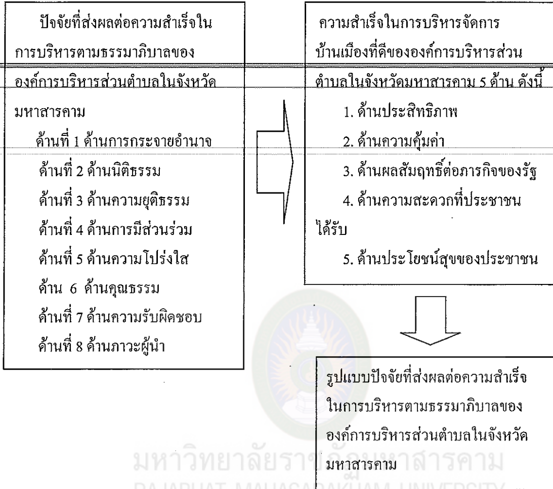
แผนภาพที่ 3 กรอบแนวคิดการวิจัย