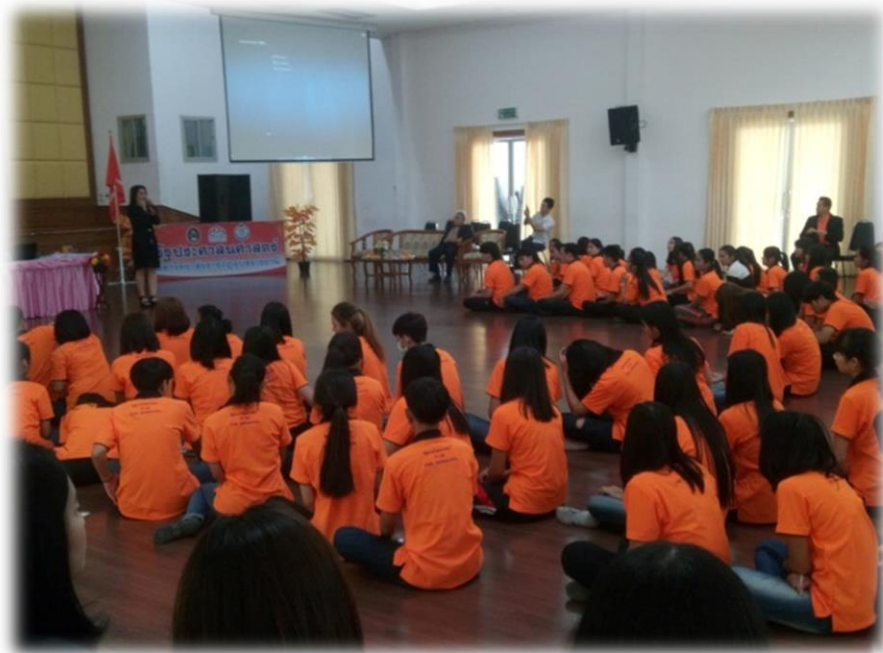
ภาพที่ ๗.13 กิจกรรมการพัฒนาจริยธรรมด้านกลั่นานมิตร