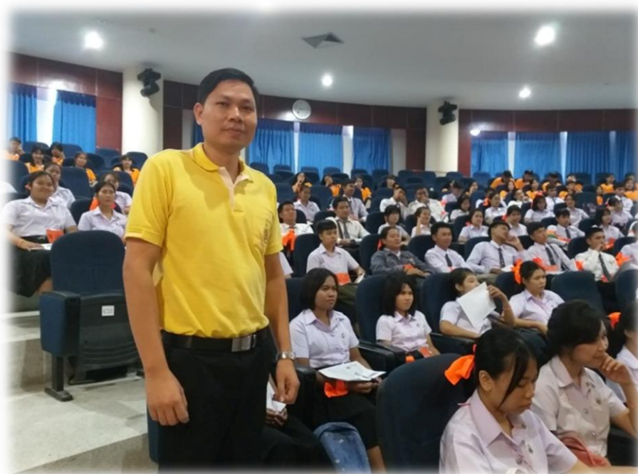
ภาพที่ ๗.22 กิจกรรมพัฒนาคุณธรรมจริยธรรมและบุคลิกภาพ