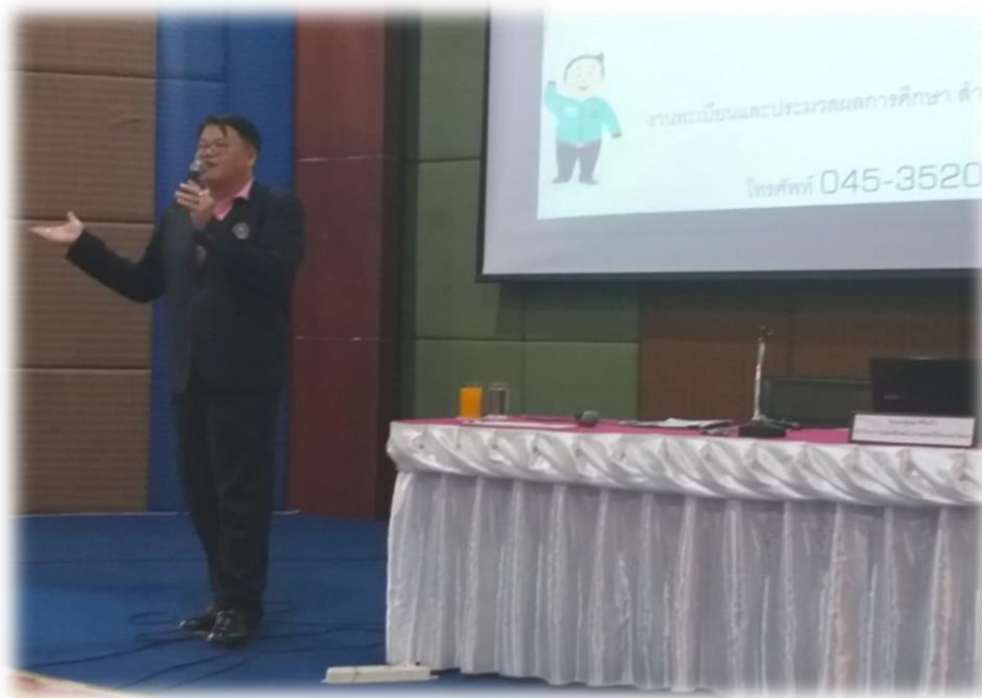
ภาพที่ ๕.20 วิทยากรบรรยายให้ความรู้ในกิจกรรมพัฒนาคุณธรรมจริยธรรม และบุคลิกภาพ