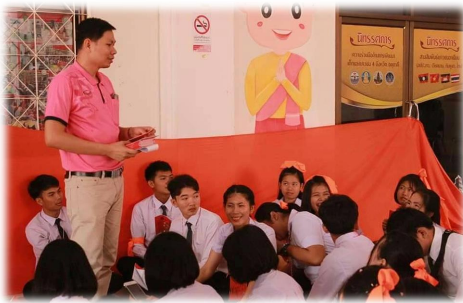
ภาพที่ ๗.16 กิจกรรมความรู้เชิงจริยธรรมด้วยการควบคุมฝึกตนปฏิบัติตามกฎระเบียบของสังคม