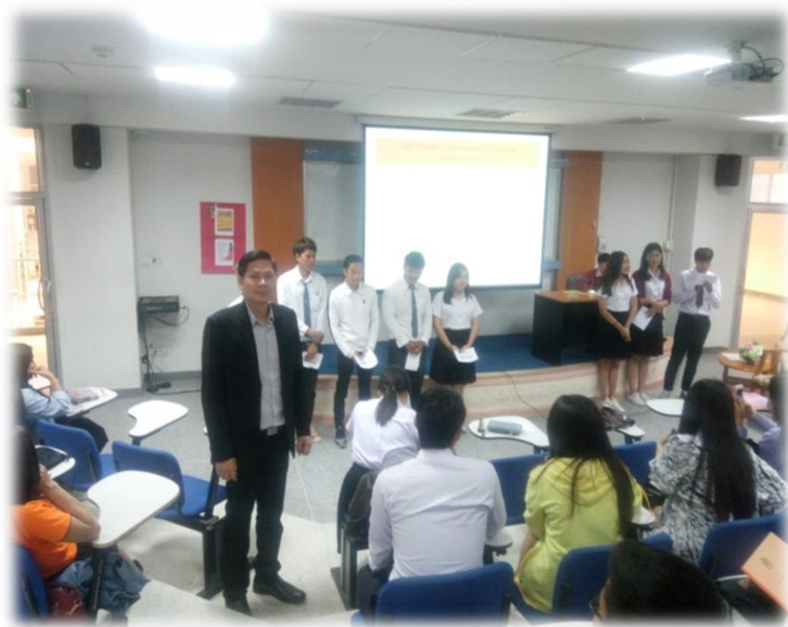
ภาพที่ ข.18 กิจกรรมการพัฒนาจริยธรรมและค่านิยมที่พึงประสงค์ตามหลักสูตร