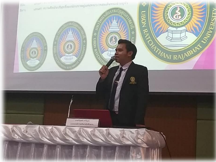
ภาพที่ ๗.15 วิทยากรบรรยายให้ความรู้เชิงจริยธรรมด้วยการควบคุมฝึกตนปฏิบัติตามกฎระเบียบของสังคม