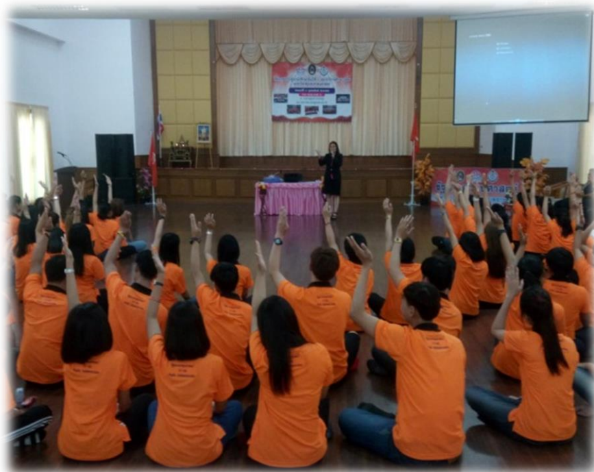
ภาพที่ ๗.14 วิทยากรบรรยายให้ความรู้ในการพัฒนาจริยธรรมด้านกลั่นานมิตร