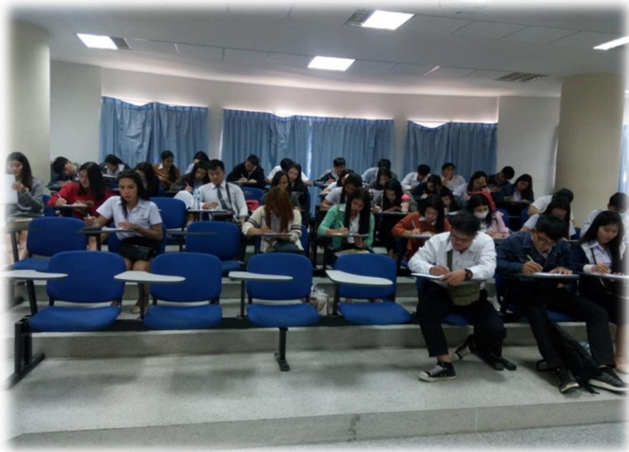
ภาพที่ ๕.19 กิจกรรมการพัฒนาจริยธรรมและค่านิยมที่พึงประสงค์ตามหลักสูตร