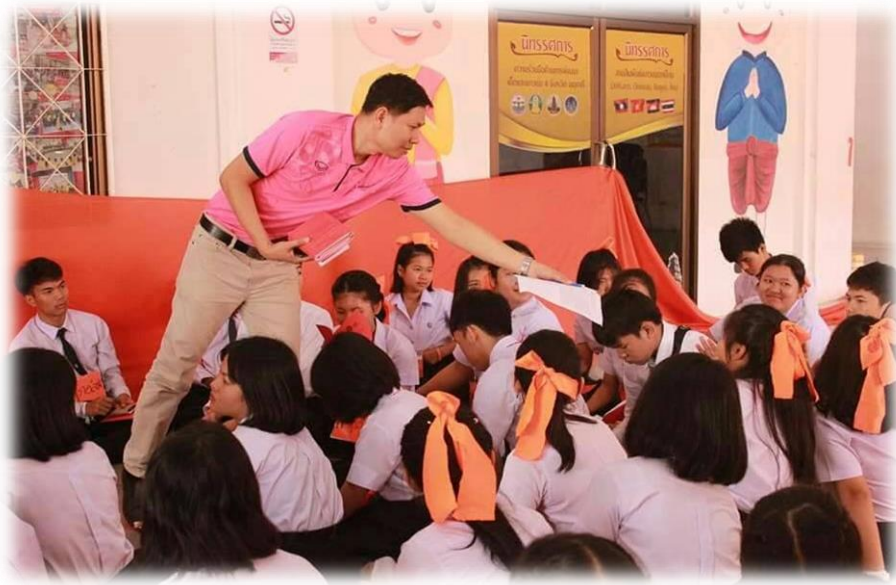
ภาพที่ ข.17 กิจกรรมการควบคุมฝึกตนปฏิบัติตามกฎระเบียบของสังคม