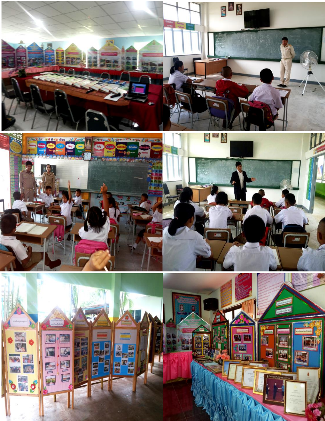
การประเมินผลการทดสอบใช้รูปแบบโดยผู้ทรงคุณวุฒิภายนอก วันจันทร์ที่ 4 กันยายน 2560 ณ โรงเรียนบ้านโคกกลางบ่อหลุบ สพป.มหาสารคาม เขต 1