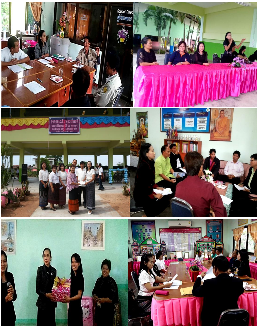
บริหารจัดการด้วยระบบคุณภาพ กระจายอำนาจ ใช้หลักการบริหารแบบมีส่วนร่วม ส่งเสริมการทำงานเป็นทีม และสร้างขวัญกำลังใจให้แก่บุคลากร