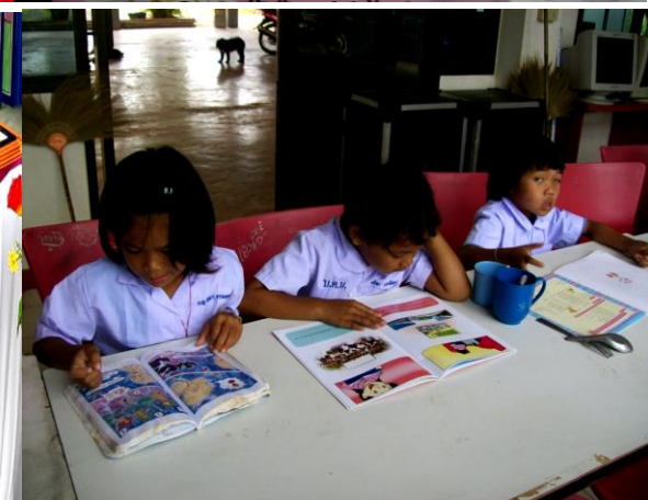
สนับสนุนด้านสื่อ อุปกรณ์และแหล่งเรียนรู้ อย่างหลากหลาย และใช้หนังสืออ่านเพิ่มเติมภาษาอังกฤษโดยเน้นทักษะฟัง พูด