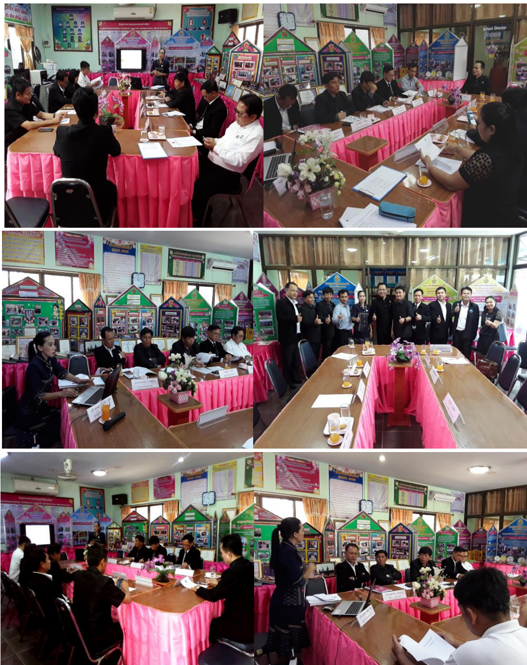
จัดประชุมเชิงปฏิบัติการเพื่อยกร่างรูปแบบ (Work shop) วันจันทร์ที่ 13 มีนาคม 2560 ณ ห้องประชุมโรงเรียนบ้านโคกกลางบ่อหลุบ ตำบลโนนราษี อำเภอบรบือ จังหวัดมหาสารคาม สำนักงานเขตพื้นที่การศึกษาประถมศึกษามหาสารคามเขต 1