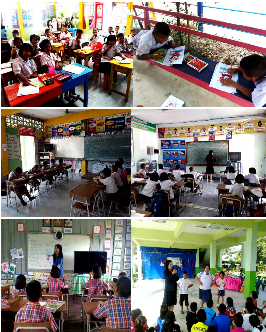
จัดสภาพชั้นเรียนที่กระตุ้นการเรียนรู้ สร้างบรรยากาศการเรียนรู้ที่ผ่อนคลาย ไม่ตึงเครียด และเปิดโอกาสให้นักเรียนได้แสดงออกด้านภาษาอังกฤษ