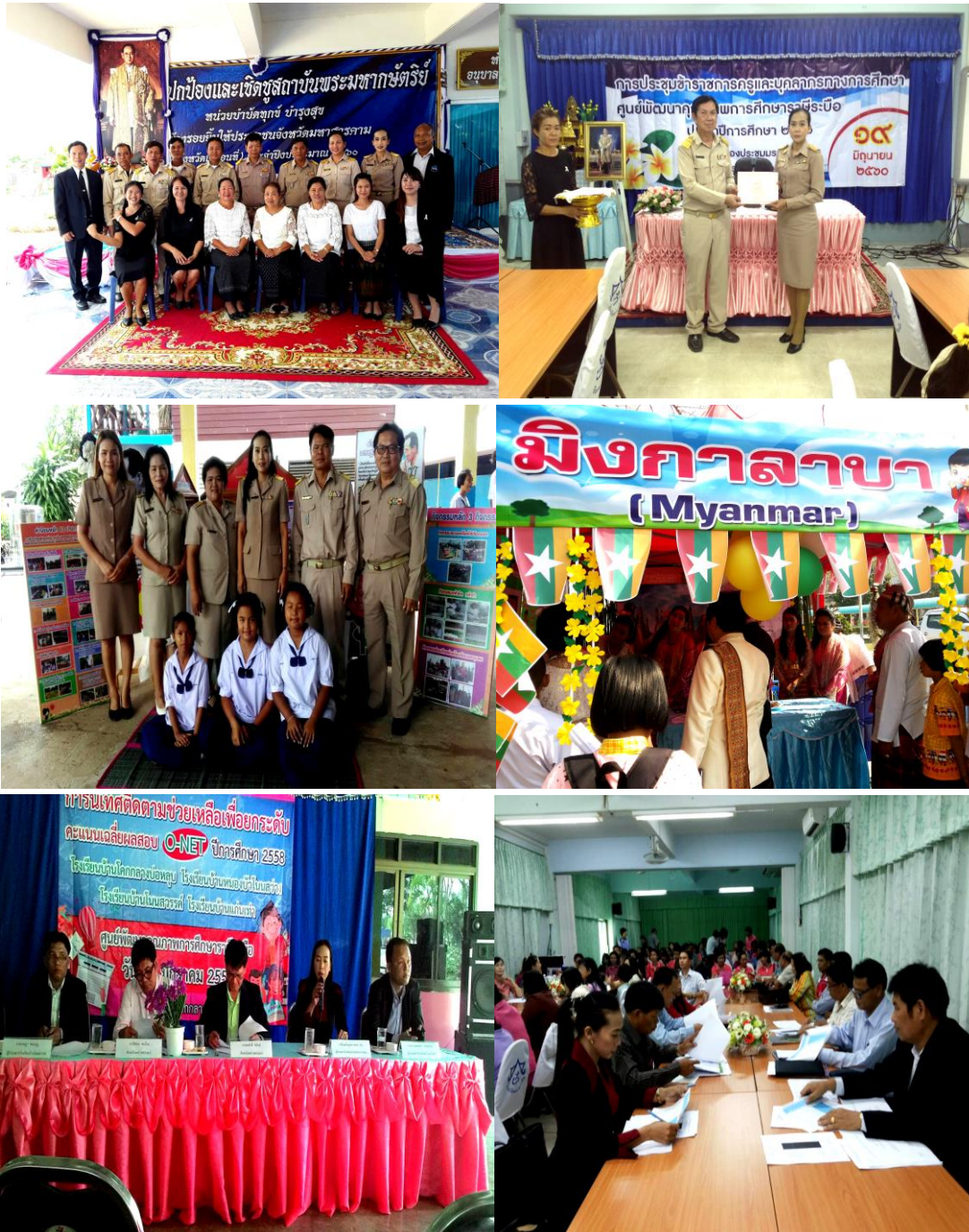
การพัฒนาเครือข่ายการยกระดับคุณภาพการจัดการเรียนรู้ภาษาอังกฤษ