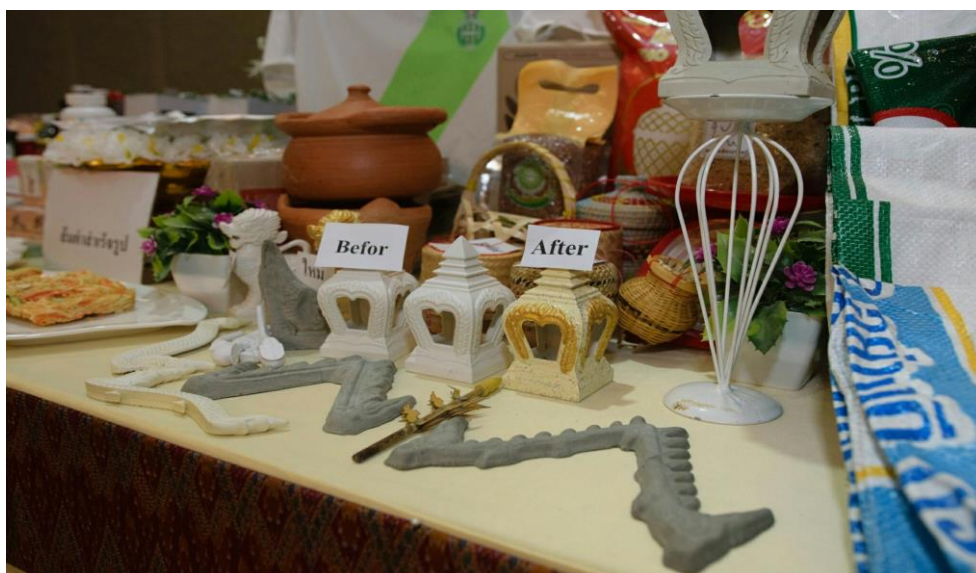
ภาพที่ จ.10 การแสดงนิทรรศการผลิตภัณฑ์อุตสาหกรรมการผลิตในการประชุมกลุ่มย่อย