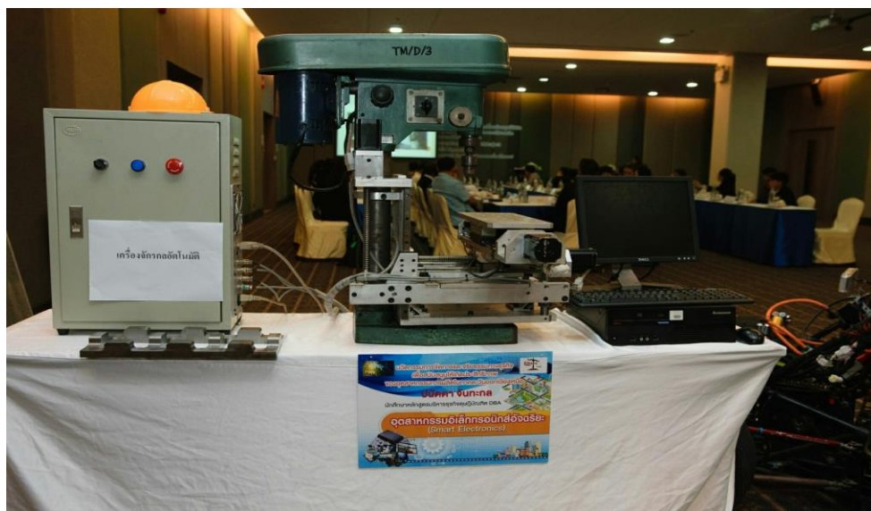
ภาพที่ จ.9 การแสดงนิทรรศการผลิตภัณฑ์อุตสาหกรรมการผลิตในการประชุมกลุ่มย่อย