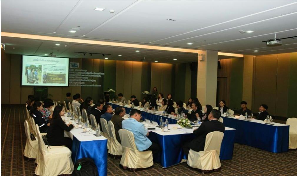
ภาพที่ จ.3 ภาพรวมผู้เข้าร่วมสนทนากลุ่มย่อย ได้แก่ ผู้ประกอบการอุตสาหกรรมการผลิต ลูกค้านักงาน นักวิชาการหรือเจ้าหน้าที่รัฐ และนักสถิติ