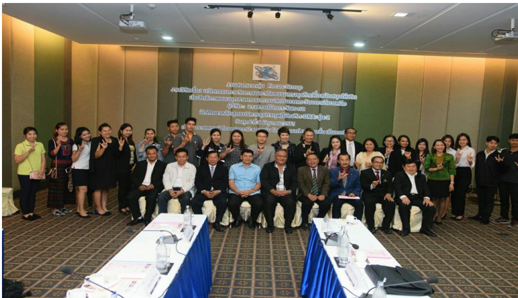
ภาพที่ จ.4 ภาพรวมผู้เข้าร่วมสนทนากลุ่มย่อย