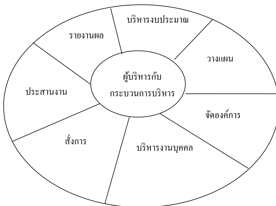
ภาพที่ 2.2 ขั้นตอนของกระบวนการบริหาร (POSDCoRB), (น. 48), โดย ศิริอร ชันชหัตถ์, 2541, กรุงเทพฯ : อักษรบัณฑิต.

ปฏิบัติงานและการประชาสัมพันธ์ขององค์กรในการบริหารงานนั้นผู้บริหารจะต้องดำเนินการตามกระบวนการบริหาร เริ่มจากการวางแผน การจัดองค์การ การบริหารงานบุคคล การสั่งการ การประสานงานต่อจากนั้นก็เป็นที่หน้าที่ของผู้บริหารที่จะต้องติดตามผลว่าสิ่งที่ได้สั่งการ หรือมอบหมายงานให้แก่ผู้ร่วมงานนั้น ผลการปฏิบัติงานรุดหน้าหรือไม่เพียงใด มีอุปสรรคและข้อขัดข้องประการใด ผลการปฏิบัติงานสอดคล้องและบรรลุเป้าหมายขององค์กรหรือไม่ ทั้งนี้เพื่อจะได้เป็นการประเมินผลงานขององค์กรและประเมินผลการปฏิบัติงานของเพื่อนร่วมงานด้วยและจะได้ใช้เป็นข้อมูลในการรายงานผลการปฏิบัติงานต่อผู้บังคับบัญชา และประชาสัมพันธ์ให้หน่วยงานที่เกี่ยวข้องทราบด้วย 7) งบประมาณ (Budgeting – B) หมายถึง การบริหารงบประมาณในการบริหารงานนั้น ผู้บริหารมีภารกิจที่เกี่ยวข้องกับการบริหารงบประมาณ มีภารกิจหน้าที่ที่จะต้องปฏิบัติ 2 ขั้นตอน คือ ขั้นตอนแรก ได้แก่ การจัดทำงบประมาณซึ่งเป็นการวางแผนล่วงหน้าในการขอเงินเพื่อจัดซื้อ หรือจ้าง หรือใช้จ่าย และขั้นตอนที่สอง ได้แก่ การดำเนินการใช้เงินเพื่อจัดซื้อ หรือจ้างตามงบประมาณที่ได้รับ