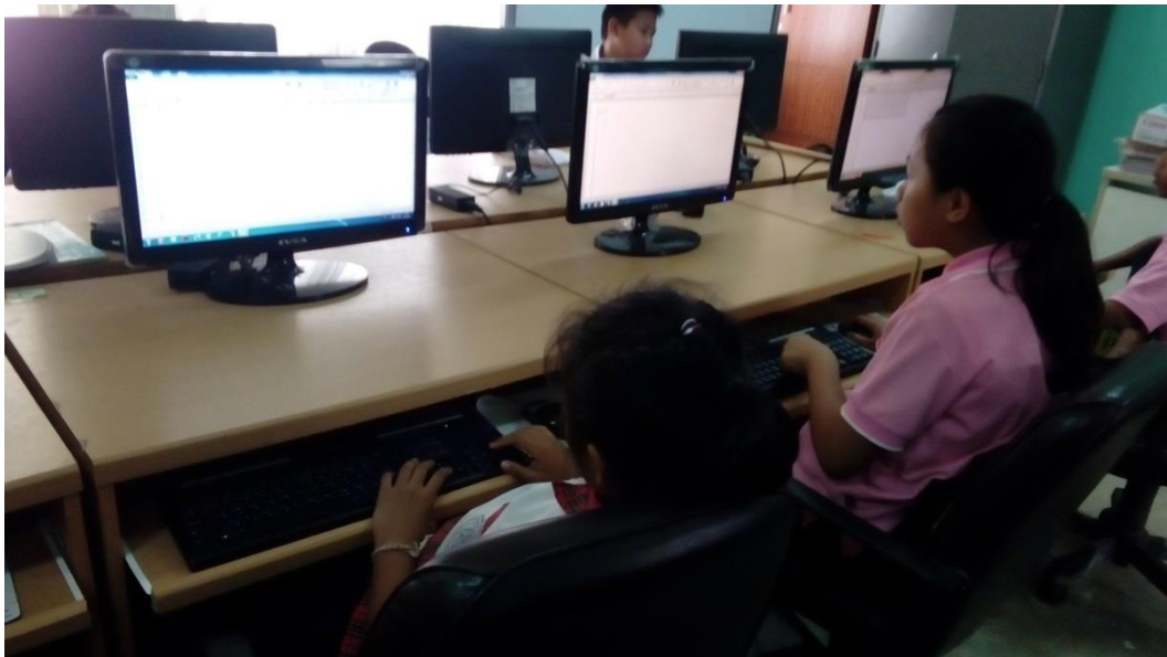
ภาพที่ จ.1 บรรยากาศในห้องเรียน