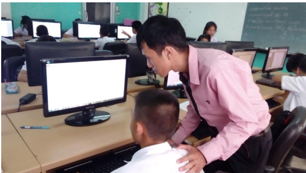
ภาพที่ จ.2 ครูผู้สอนแนะนำการใช้คอมพิวเตอร์มัลติมีเดีย