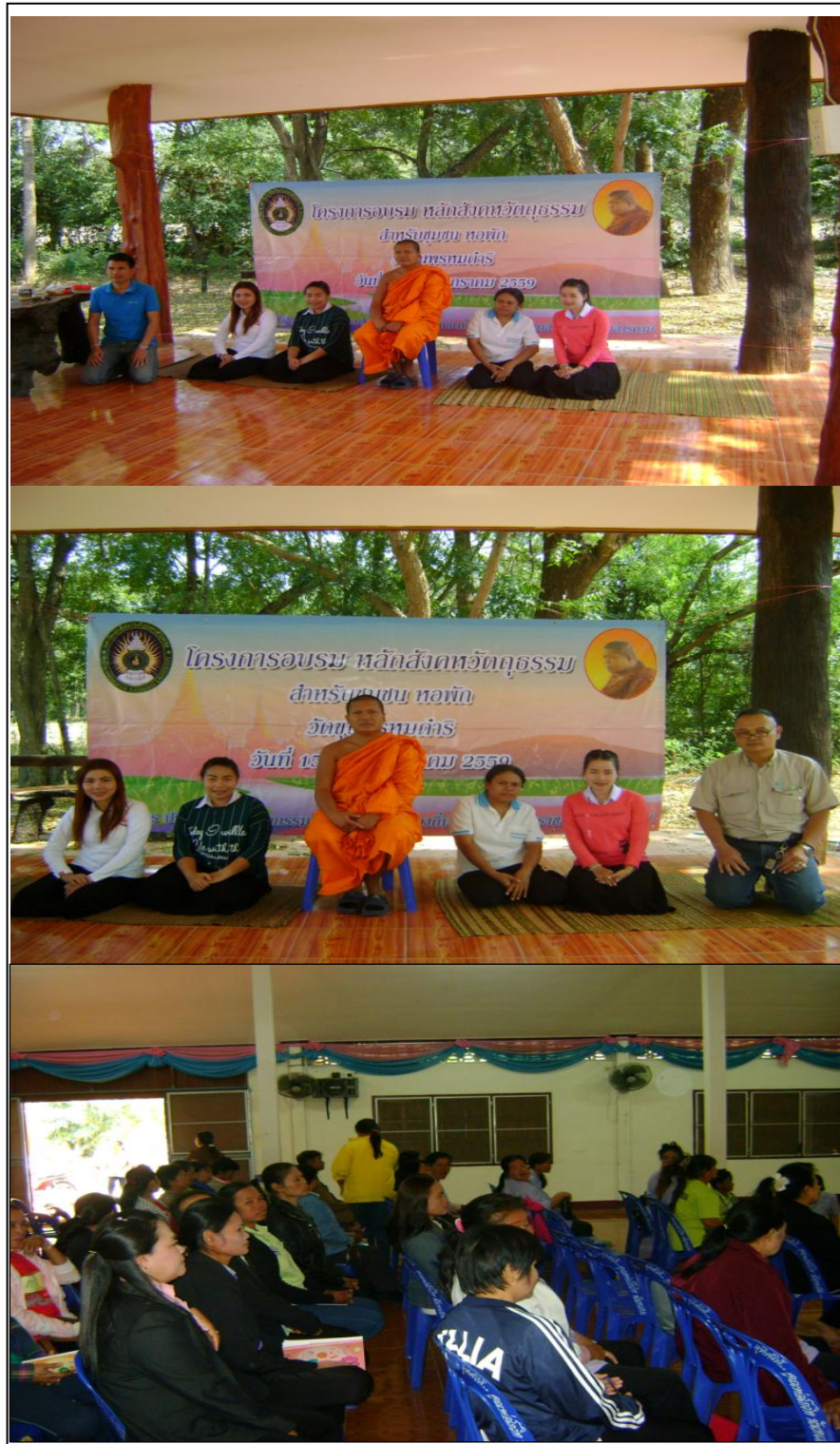
ภาพที่ 5.1 การจัดโครงการอบรม หลักสูตรหลักสังคหวัตถุธรรมการพัฒนาหอพักต้นแบบ ณ วัดขุนพรหมคำดี