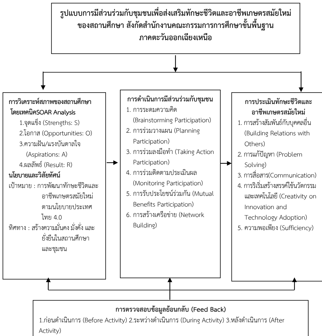
ภาพที่ 5.2 รูปแบบการมีส่วนร่วมกับชุมชนเพื่อส่งเสริมทักษะชีวิตและอาชีพเกษตรสมัยใหม่ของสถานศึกษา สังกัดสำนักงานคณะกรรมการการศึกษาขั้นพื้นฐาน ภาคตะวันออกเฉียงเหนือ