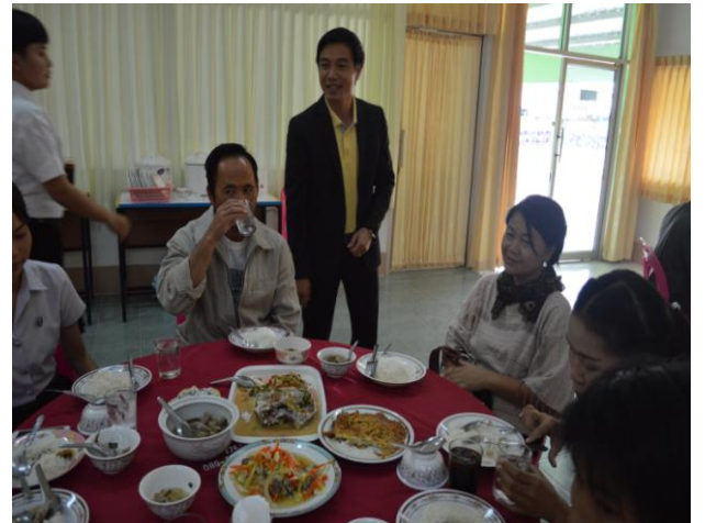
ผู้เข้าร่วมประชุมพบปะแลกเปลี่ยนช่วง รับประทานอาหารเที่ยง