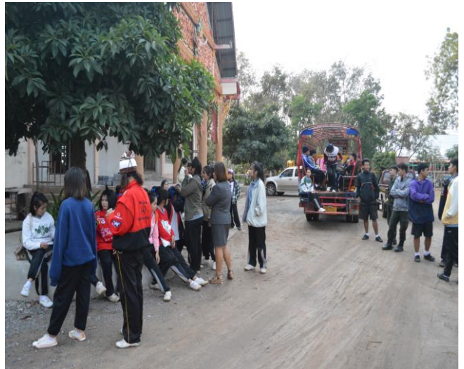
นักเรียน รอเข้าเยี่ยมชมงานด้านจิตอาสาของ วัดสิริบุญธรรม กุดคินจี