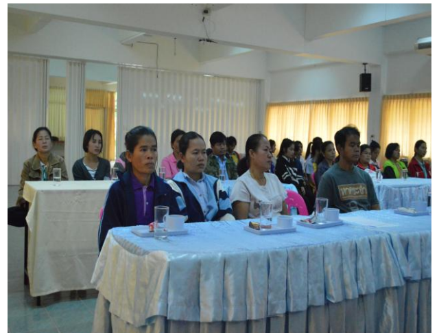
ผู้เข้าร่วมประชุมรับฟังผลการวิจัยใน ระยะที่ 1-2 และการวิจัยพัฒนาจิตสาธารณะ ในระยะที่ 3