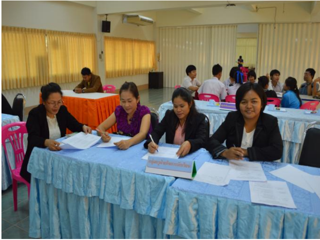
การประชุมกลุ่มย่อยเพื่อพัฒนา รูปแบบการพัฒนาจิตสาธารณะ