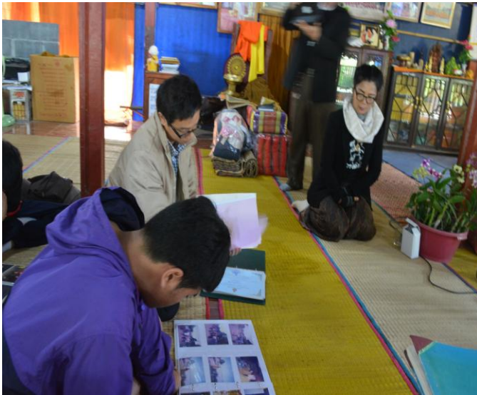
ผู้วิจัย นักเรียน ศึกษาดูงาน กิจกรรมด้าน การทำงานจิตอาสาของวัดฯ