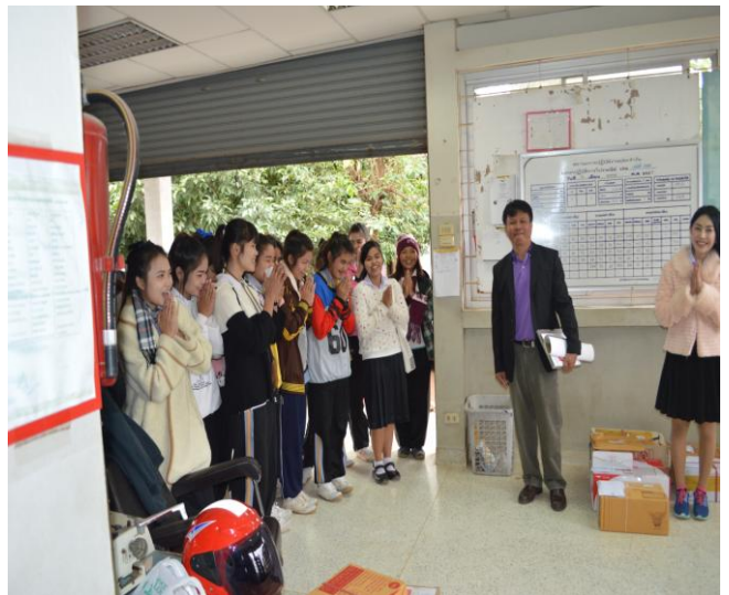
ซักถาม และแสดงความคิดเห็นในการทำงาน ด้านการบริการรับ-ส่ง ของไปรษณีย์