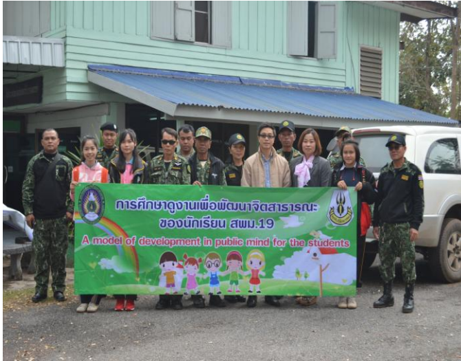
คณะผู้วิจัย และเจ้าหน้าที่ ร่วมถ่ายภาพ