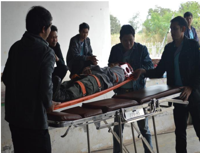
ฝึกปฏิบัติเรื่องการกู้ภัย และการ ช่วยเหลือคนป่วยเบื้องต้น