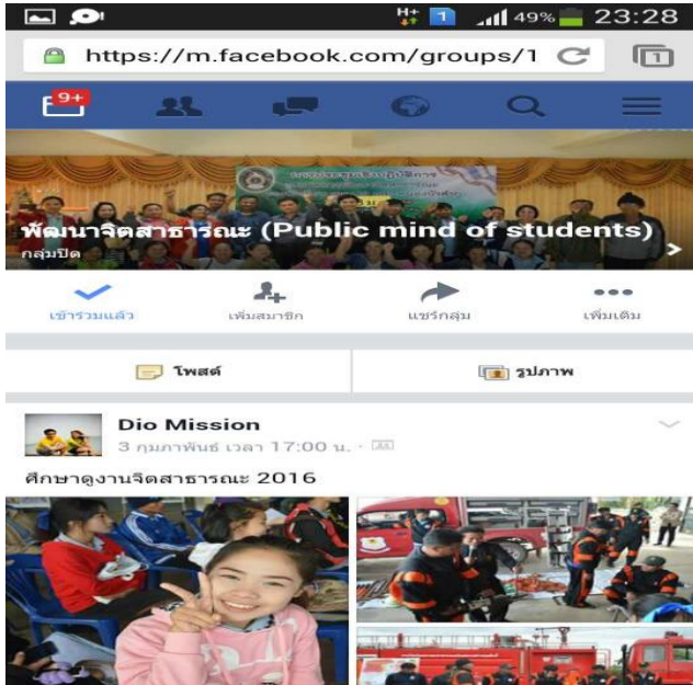
เฟสบุ๊กกลุ่มผู้ปกครองเพื่อเป็นสื่อกลางแลกเปลี่ยนเรียนรู้ในการพัฒนาจิตสาธารณะ