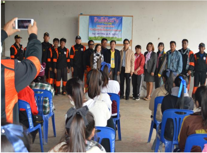
กล่าวขอบคุณและถ่ายภาพร่วมกัน