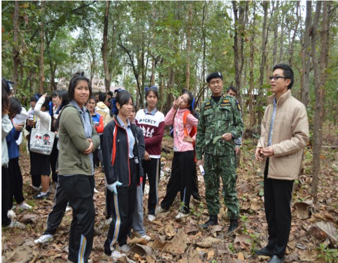
รับการบรรยายจากวิทยากรเรื่องการอนุรักษ์ทรัพยากรป่าไม้และต้นน้ำ