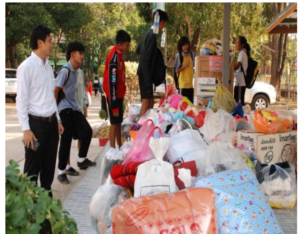
ผู้วิจัยสังเกตการณ์ทำงานของนักเรียนใน การเป็นแกนนำจิตอาสา