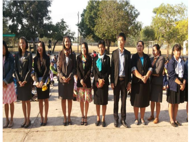
คณะครูร่วมกันถวายสัตย์ปฏิญาณตนต่อหน้า พระบรมฉายาลักษณ์พระบาทสมเด็จพระ เจ้าอยู่หัว ร.๙ เพื่อพัฒนาจิตสำนึกนักเรียน