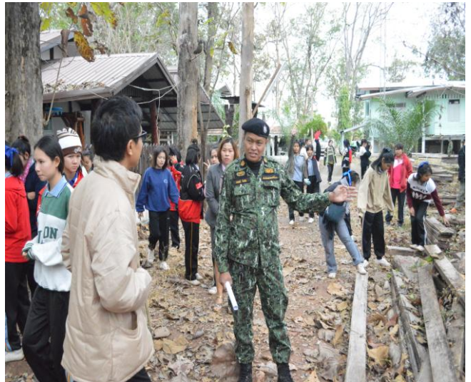
วิทยากรนำคณะฯ ดูของกลางจากการจับกุมการลักลอบตัดไม้ ทำลายป่า