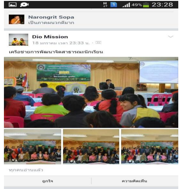
เฟสบุ๊กกลุ่มผู้ปกครองเพื่อเป็นสื่อกลางแลกเปลี่ยนเรียนรู้ในการพัฒนา