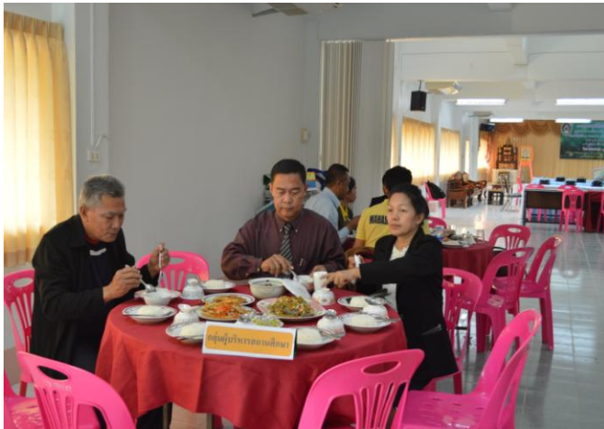
ผู้เข้าร่วมประชุมพบปะแลกเปลี่ยนช่วง รับประทานอาหารเที่ยง