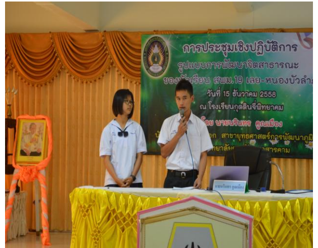
การนำเสนอผลการประชุมกลุ่มย่อย ในกลุ่มตัวแทนนักเรียน