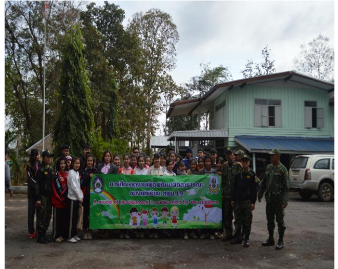
นักเรียน และวิทยากรถ่ายภาพร่วมกัน