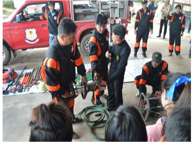
ฝึกปฏิบัติเรื่องการกู้ภัย และการช่วยเหลือคนป่วยเบื้องต้น