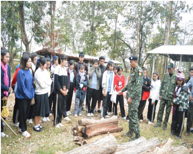
วิทยากรแนะนำไม้พะยูน ซึ่งเป็นของกลางจากการลักลอบตัดในเขตป่าสงวน