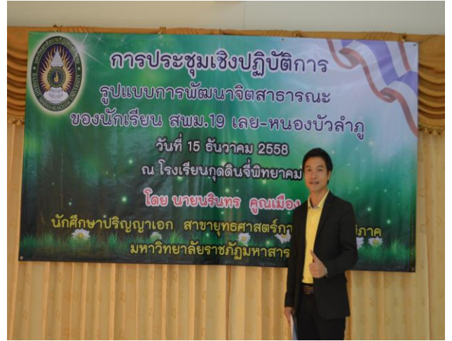
พิธีปิดการประชุมเชิงปฏิบัติการเพื่อ พัฒนารูปแบบการพัฒนาจิตสาธารณะ