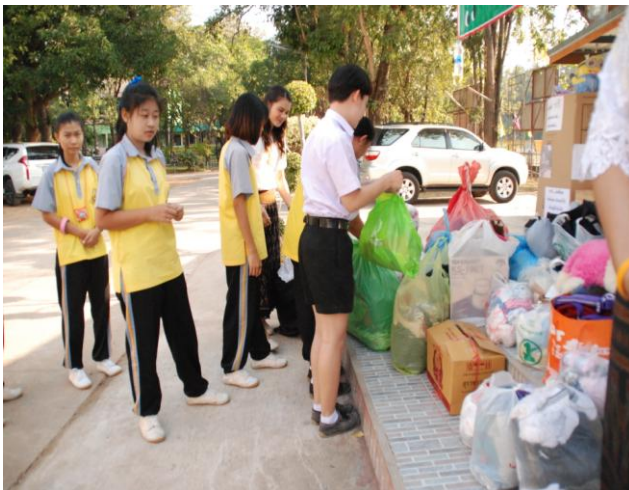
แกนนำนักเรียนร่วมกันจัดสถานที่และ ประชาสัมพันธ์การรับบริจาคสิ่งของ