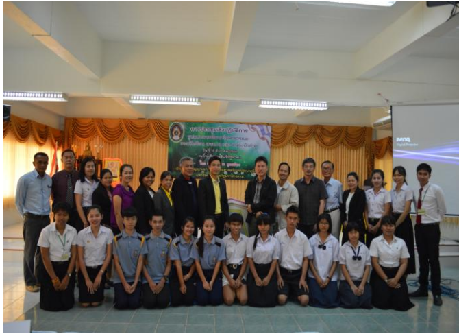
ผู้เข้าร่วมประชุมร่วมถ่ายภาพ