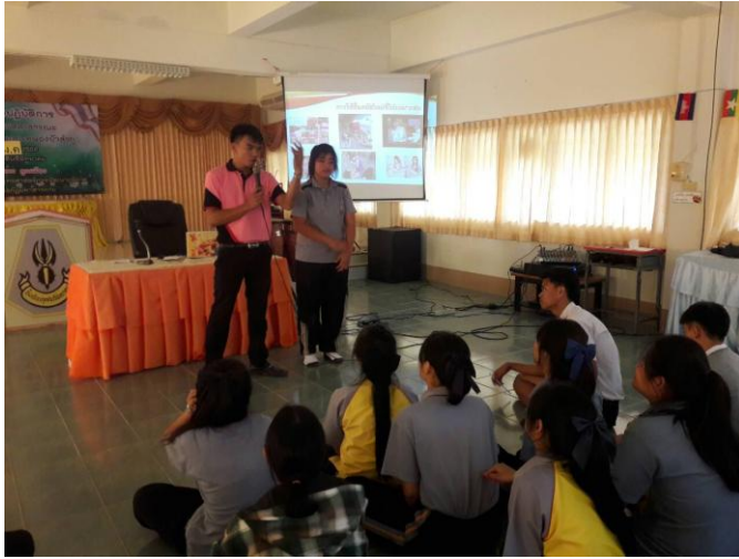
การอบรมเชิงปฏิบัติการเรื่องเพื่อน และการทำงานด้านจิตสาธารณะ