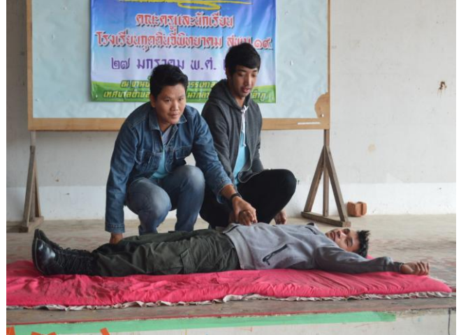
การสาธิตการช่วยเหลือผู้ประสบภัย เบื้องต้น