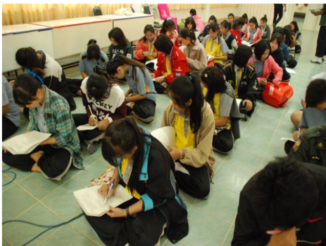
กลุ่มทดลองทำแบบสอบถามก่อน ทดลองการวิจัยในระยะที่ 3