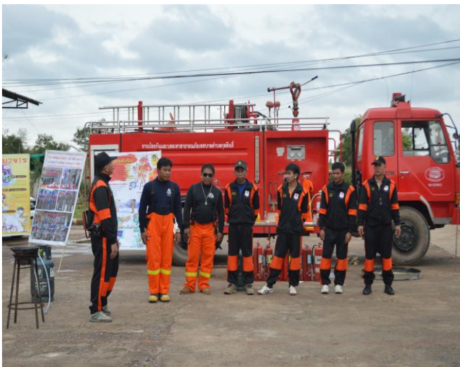
ทีมวิทยากรแนะนำตัวเอง