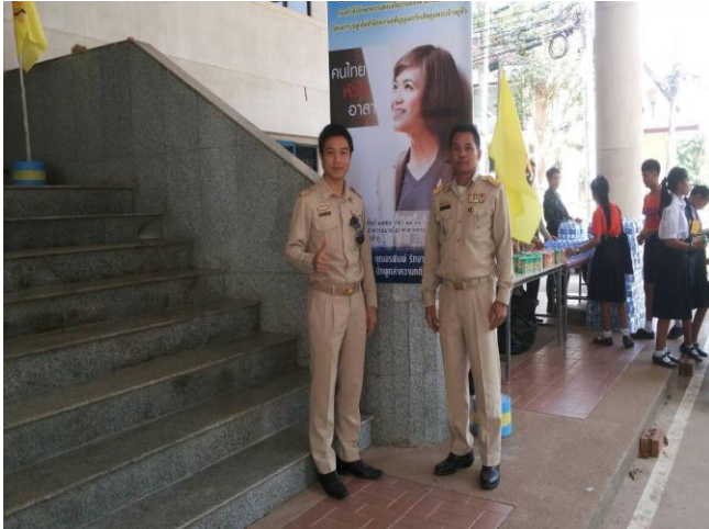
นำนักเรียนเข้าร่วมการอบรมเพื่อพัฒนาจิต ตาสาธารณะจัดโดยจังหวัดฯ