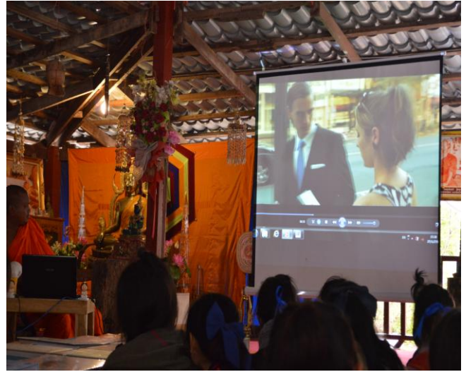
รับฟังคำบรรยายจากวิทยากร