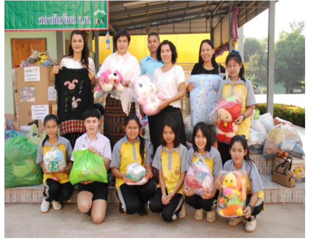
นักเรียนร่วมกันบริจาคสิ่งของค่ายจิต อาสาของกลุ่มคนหัวใจสิงห์