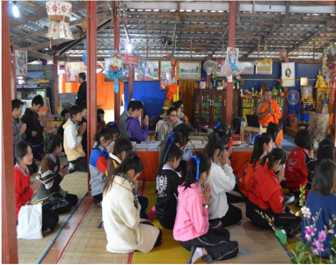
รับฟังการบรรยายจากวิทยากร