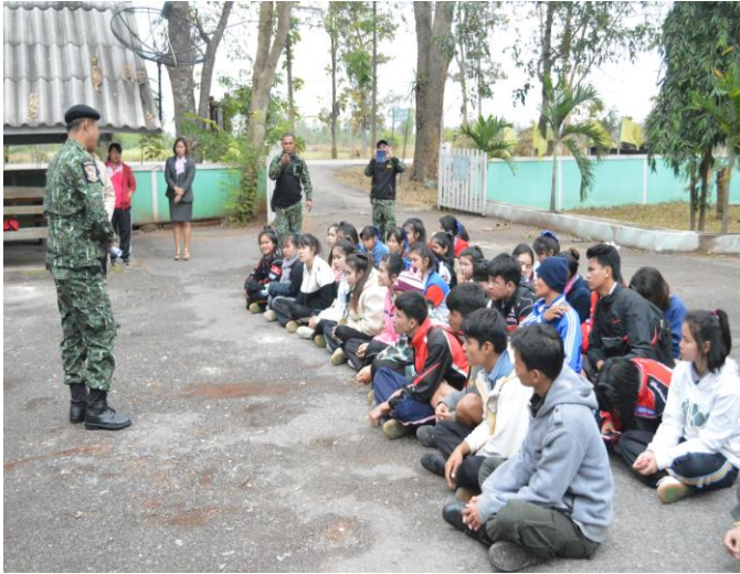
แนะนำและทำความรู้จักทีมวิทยากร