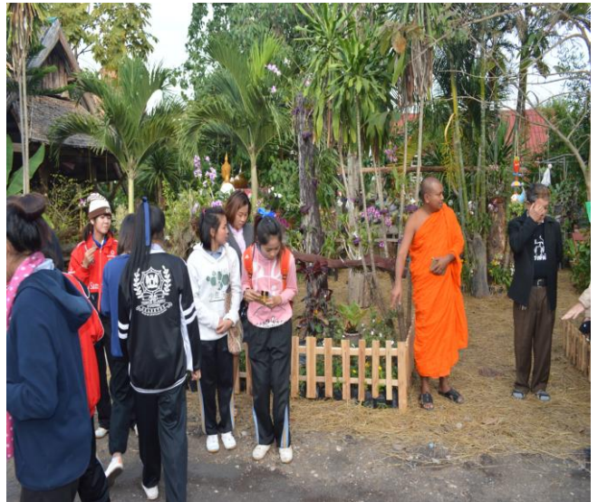
ศึกษาการจัดกิจกรรมจิตสาธารณะ โดยให้เขาชน มีส่วนร่วมในการจัดสวนหย่อมในวัดฯ