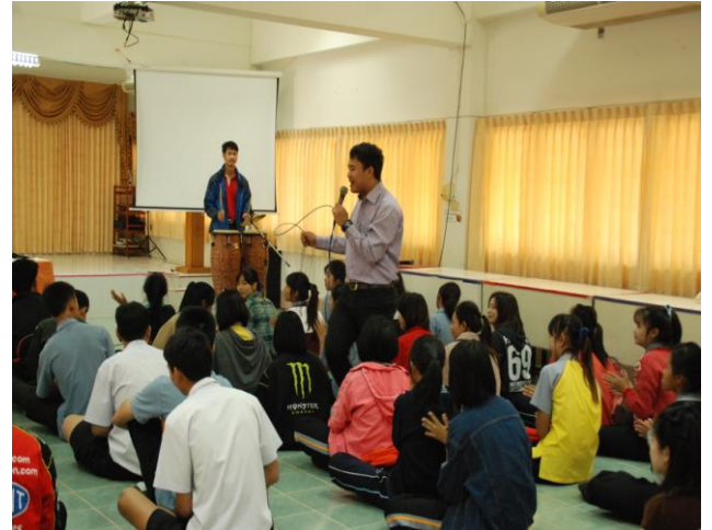
ทีมวิทยากรสนทนาก่อนการบรรยาย และการฝึกอบรม