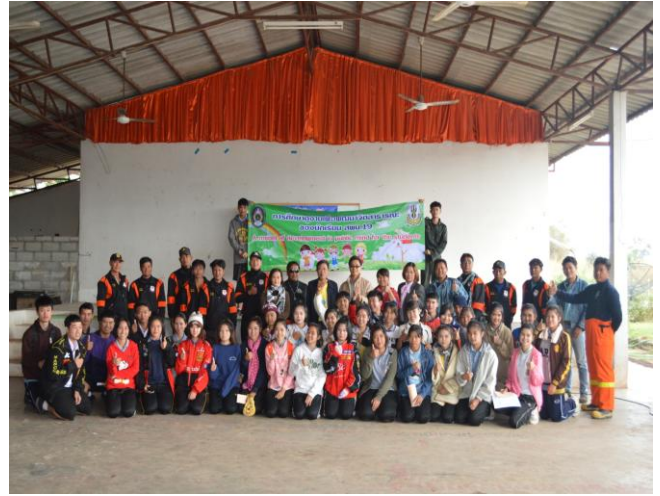
ถ่ายภาพร่วมกัน