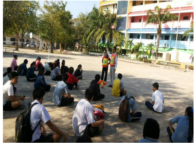
ฝึกกิจกรรมเรื่องระเบียบวินัย และให้ ความรู้เพิ่มเติมเรื่องวินัยจราจร