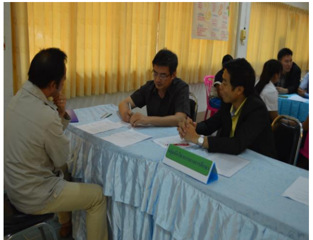
การประชุมกลุ่มย่อยเพื่อพัฒนา รูปแบบการพัฒนาจิตสาธารณะ