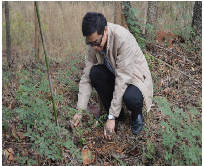
ผู้วิจัยร่วมกิจกรรมปลูกป่า