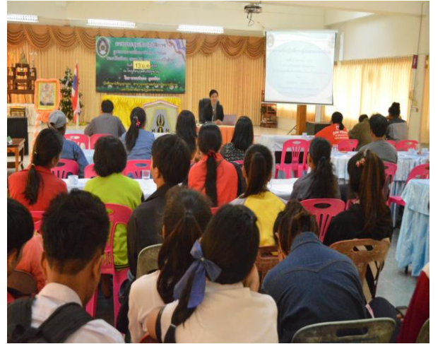
ผู้ปกครองถวายคำสัตย์ปฏิญาณตนเพื่อพัฒนาศาสนาธรรมของนักเรียน