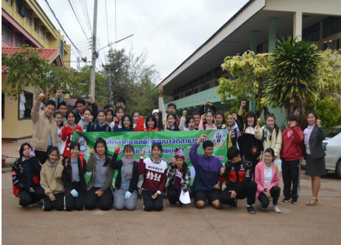
เตรียมความพร้อมก่อนออกเดินทางเพื่อ ศึกษา ดูงาน ด้านจิตสาธารณะ