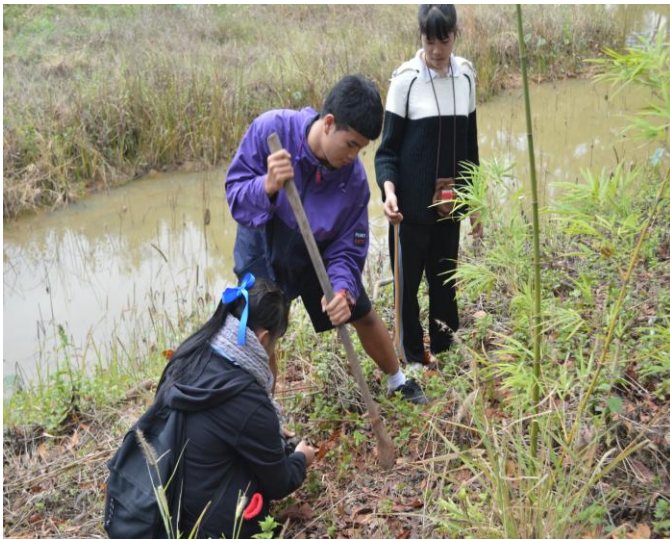
ผู้วิจัย นักเรียน และวิทยากรร่วมทำกิจกรรมปลูกป่า