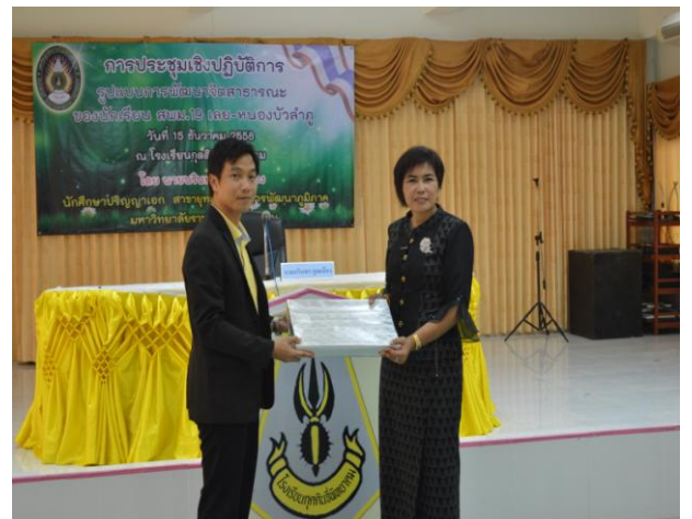
ผู้วิจัยมอบของที่ระลึกให้ผู้ดำเนินการ โรงเรียน กุศลจิตพิทยาคม และกล่าวปิดฯ