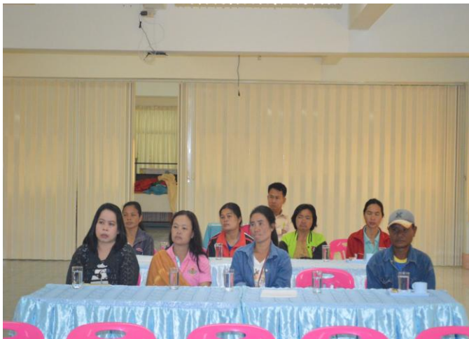
ผู้ปกครองรับฟังคำบรรยายเพื่อพัฒนา จิตสาธารณะของนักเรียน