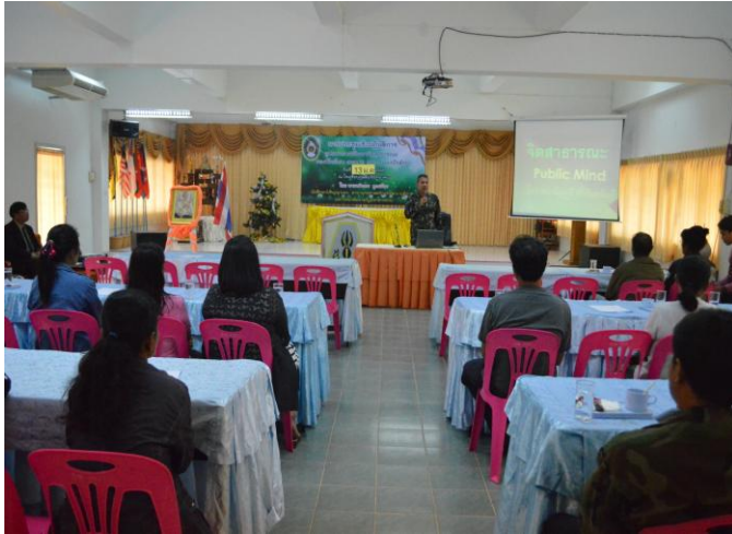
พิธีเปิดการอบรมเชิงปฏิบัติการโดยรอง ผู้อำนวยการ โรงเรียนฯ