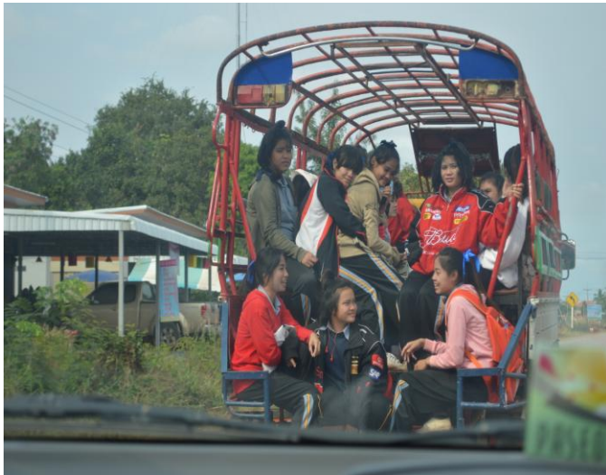
ผู้วิจัย นักเรียน เดินทางมุ่งสู่ วัดสิริบุญธรรม กุดคินจี