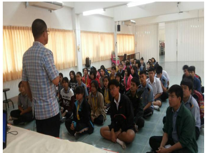
อบรมเรื่องการใช้เวลาและการฟัง