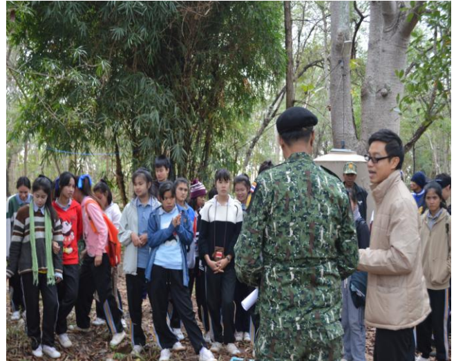
นักเรียนซักถามและแสดงความคิดเห็น