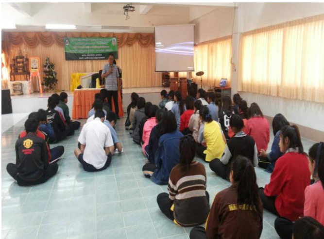
อบรมเรื่องวินัย