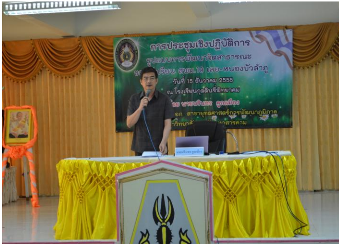
การนำเสนอผลการประชุมกลุ่มย่อย ในกลุ่มนักวิชาการ