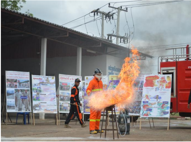
การอบรมรับการบรรยายเรื่องการ ช่วยเหลือและป้องกันอัคคีภัย