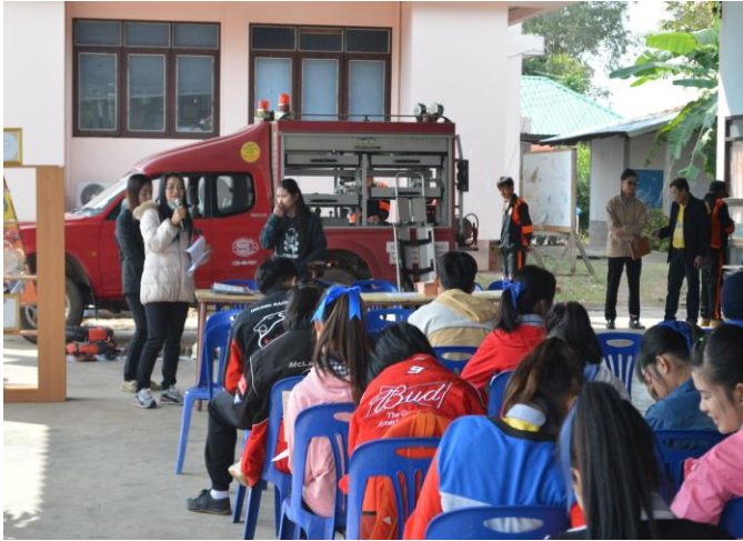
การอบรมเรื่องการกู้ภัยบนท้องถนน