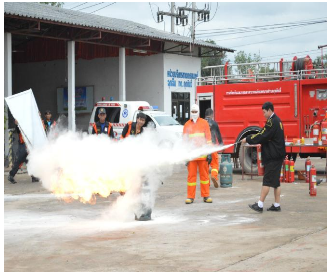
นักเรียน การดับเพลิงด้วยสารเคมี