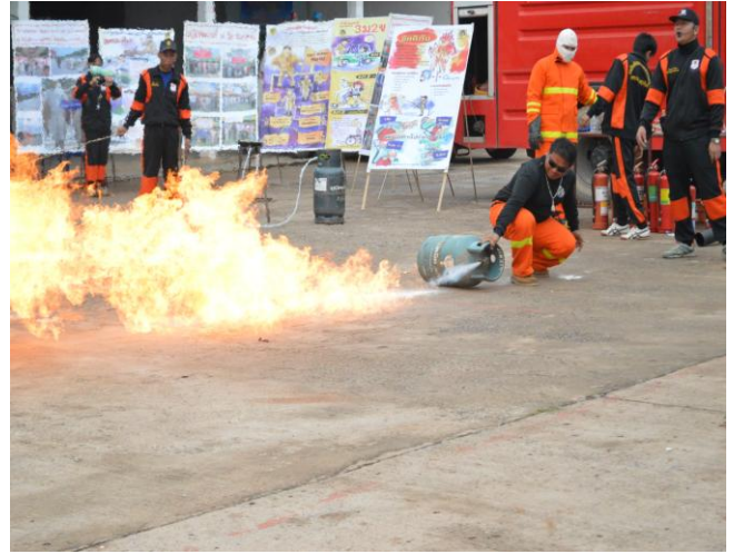
วิทยากรสาธิตการเกิดอัคคีภัย