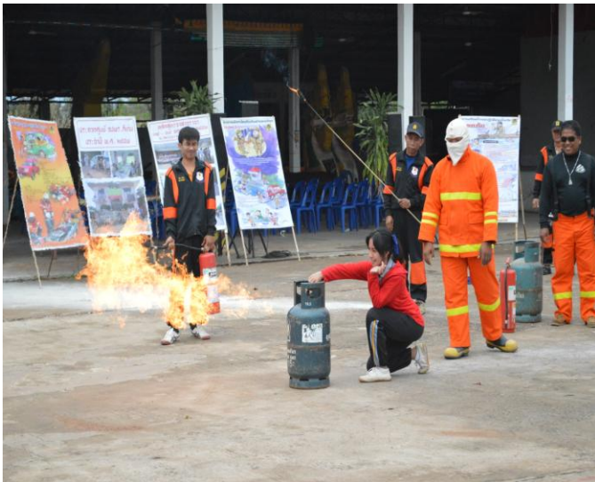
นักเรียน ฝึกปฏิบัติการ ดับเพลิงด้วยมือเปล่า