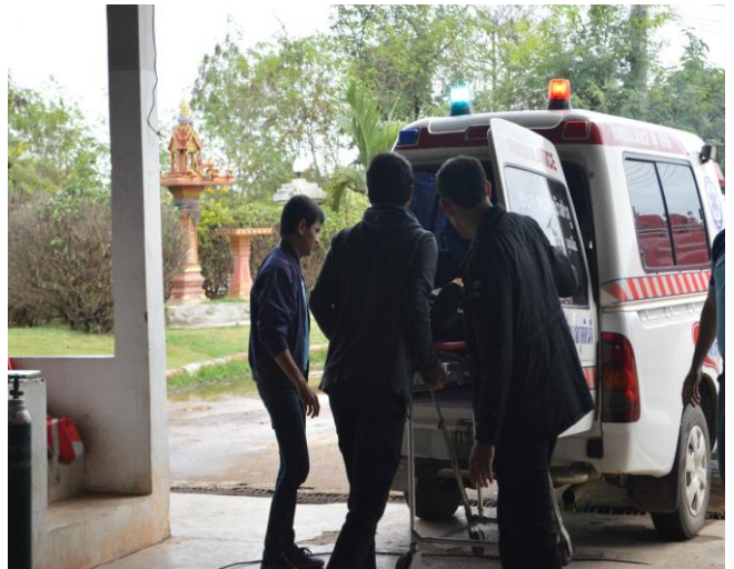
ฝึกปฏิบัติเรื่องการกู้ภัย และการช่วยเหลือผู้ประสบภัยเบื้องต้น