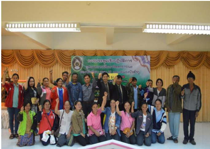
ร่วมสร้างเครือข่ายผู้วิจัยกับผู้ปกครองเพื่อพัฒนาศาสนาธรรมนักเรียน