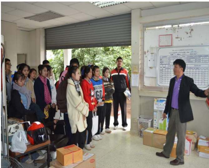
ศึกษา คู่มือ ที่ทำการไปรษณีย์กุดดินจี่