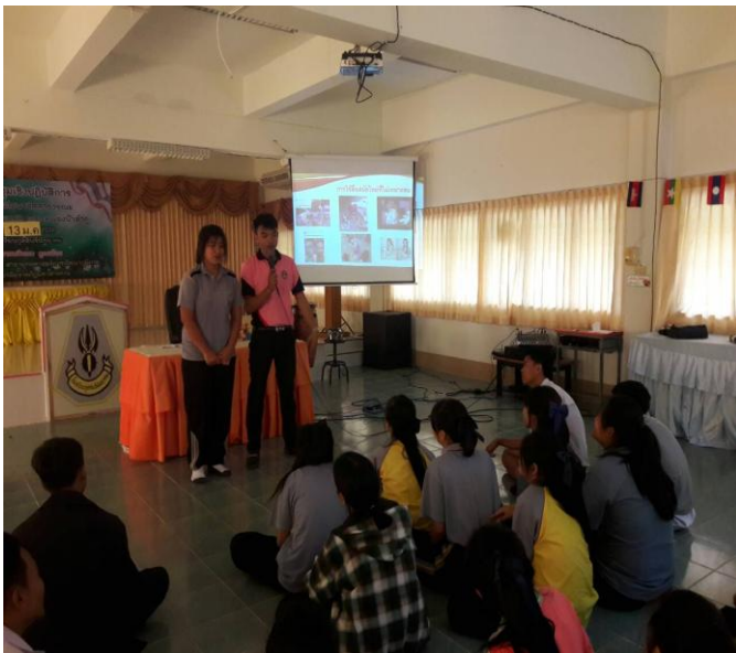
วิทยากรนำกิจกรรมกลุ่มและให้นักเรียนได้ ฝึกปฏิบัติเพื่อค้นหาเพื่อนที่เป็นบุคคลต้นแบบได้