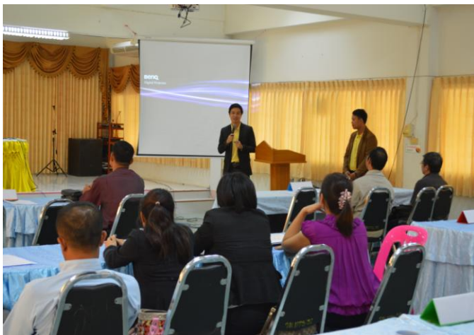
ผู้วิจัยสรุปผลการประชุมกลุ่มย่อย และ กล่าวขอบคุณผู้เข้าร่วมประชุมฯ