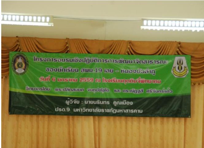
การอบรมเชิงปฏิบัติการเพื่อพัฒนา บุคลิกภาพของนักเรียน