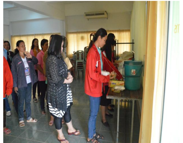
ร่วมรับประทานอาหารเที่ยงเพื่อสร้างความสัมพันธ์ก่อนกลับบ้าน