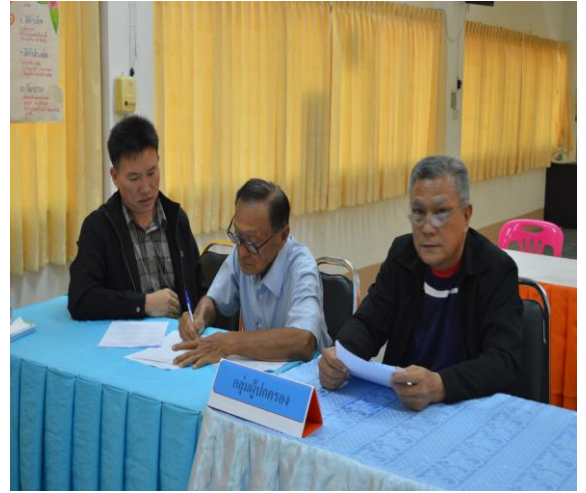
การประชุมกลุ่มย่อยเพื่อพัฒนา รูปแบบการพัฒนาจิตสาธารณะ