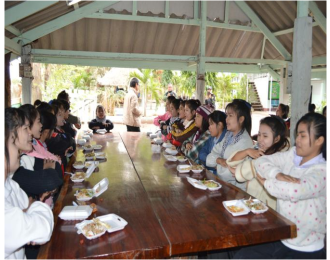
นักเรียนร่วมกันรับประทานอาหารเที่ยง