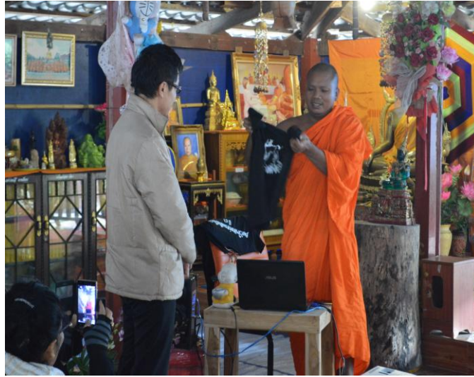
ผู้วิจัยกล่าวขอบคุณ และมอบของที่ระลึก