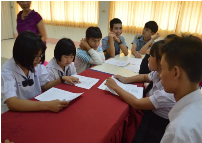
การประชุมกลุ่มย่อยเพื่อพัฒนา รูปแบบการพัฒนาจิตสาธารณะ