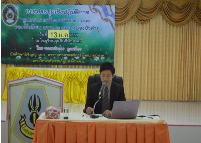
ผู้วิจัยนำเสนอรูปแบบและแนวทางการร่วมมือเพื่อพัฒนาศาสนาธรรมของนักเรียน