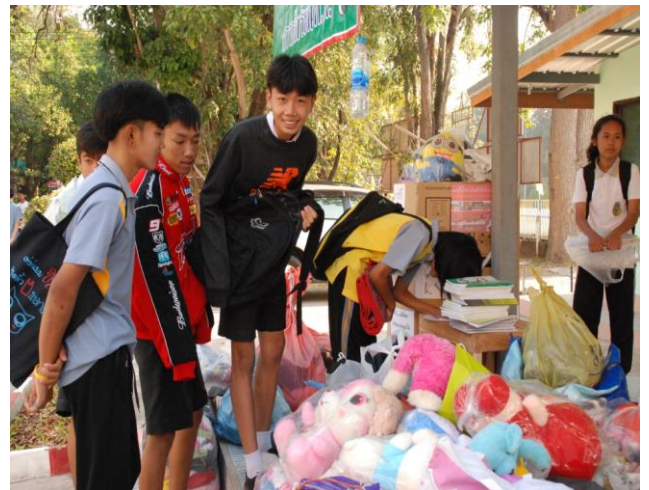
แกนนำนักเรียนร่วมกันจัดสถานที่และ ประชาสัมพันธ์การรับบริจาคสิ่งของ