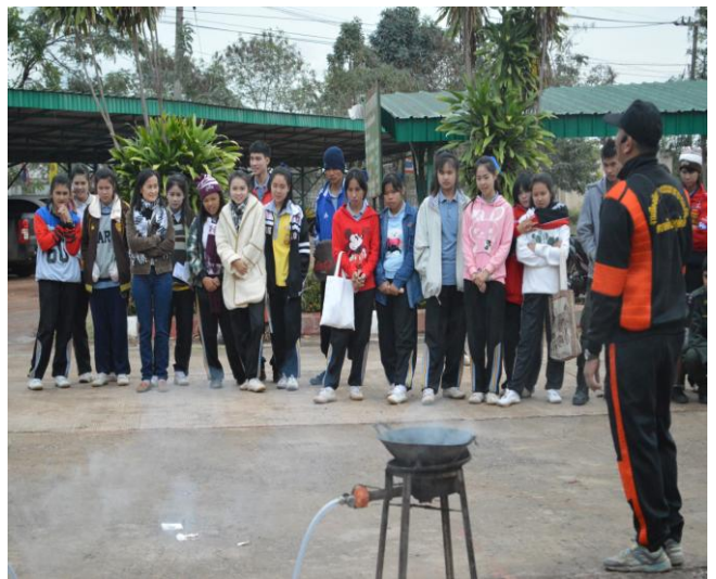
นักเรียน ฟังการบรรยายและสังเกตการณ์