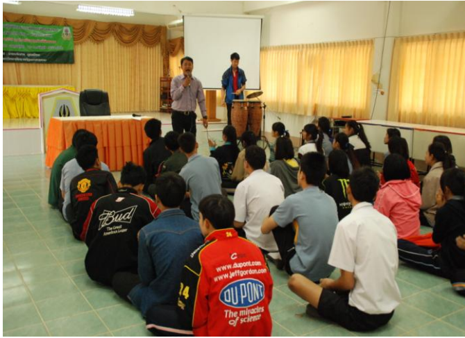
การประชุมเชิงปฏิบัติการเพื่อพัฒนา บุคลิกภาพ และพัฒนาจิตสาธารณะ