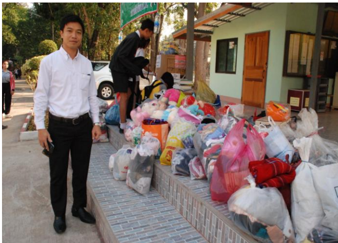
ผู้วิจัยสังเกตการณ์ทำงานของนักเรียนใน การเป็นแกนนำจิตอาสา