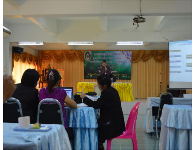
การนำเสนอผลการประชุมกลุ่มย่อยใน กลุ่มผู้บริหารโรงเรียน