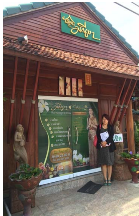
ภาพที่ ๑๐.10 การลงพื้นที่เก็บข้อมูลในภาคตะวันออกเฉียงเหนือ