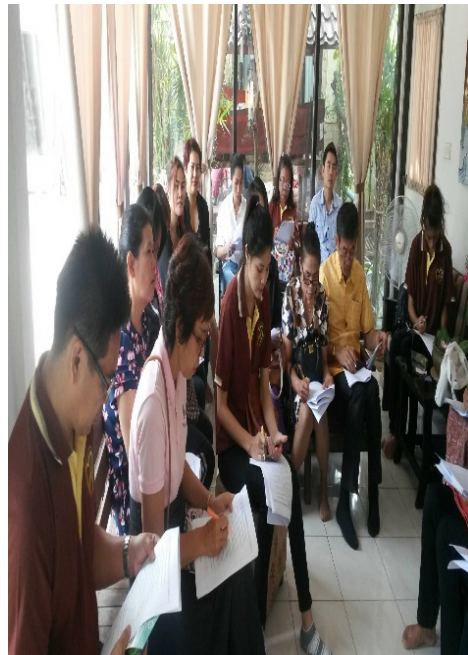
ภาพที่ ๑๒.12 การลงพื้นที่เก็บข้อมูลในภาคตะวันออกเฉียงเหนือ