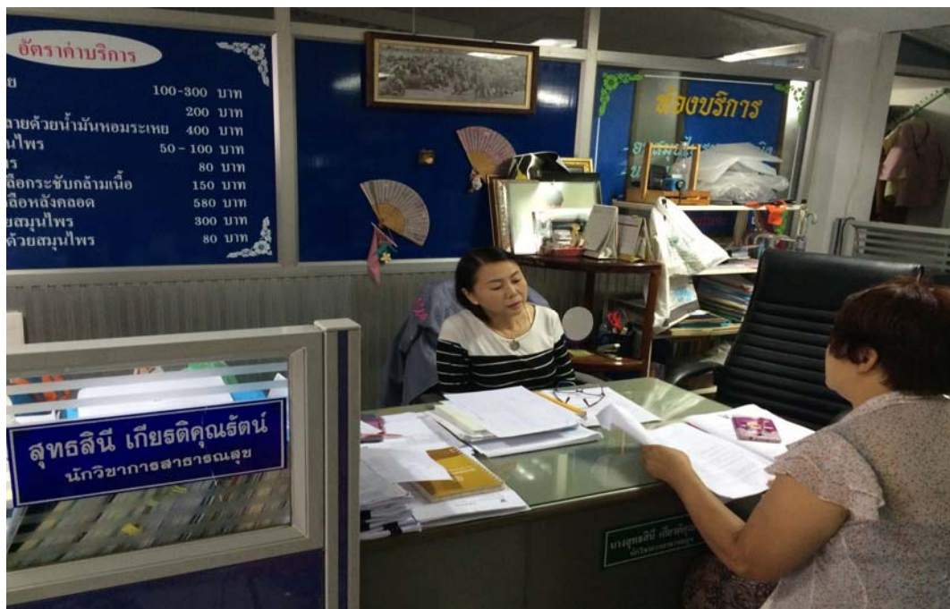
ภาพที่ ๓.1 การลงพื้นที่สัมภาษณ์ผู้ให้ข้อมูลหลัก จังหวัดสุรินทร์