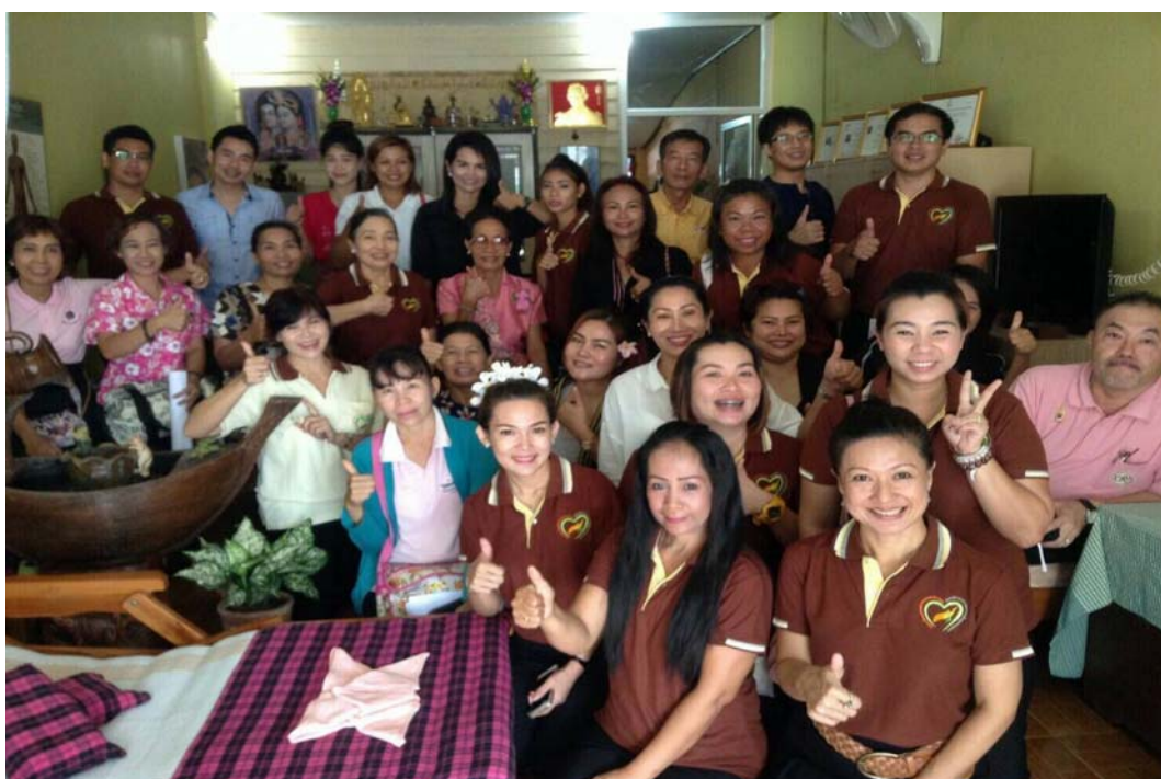
ภาพที่ ๓.13 การลงพื้นที่สังเกตการณ์ร้านสปาที่ผ่านมาตรฐานร่วมกับสำนักงานสาธารณสุขจังหวัดขอนแก่นและชมรมชมรมสถานประกอบการเพื่อสุขภาพจังหวัดขอนแก่น