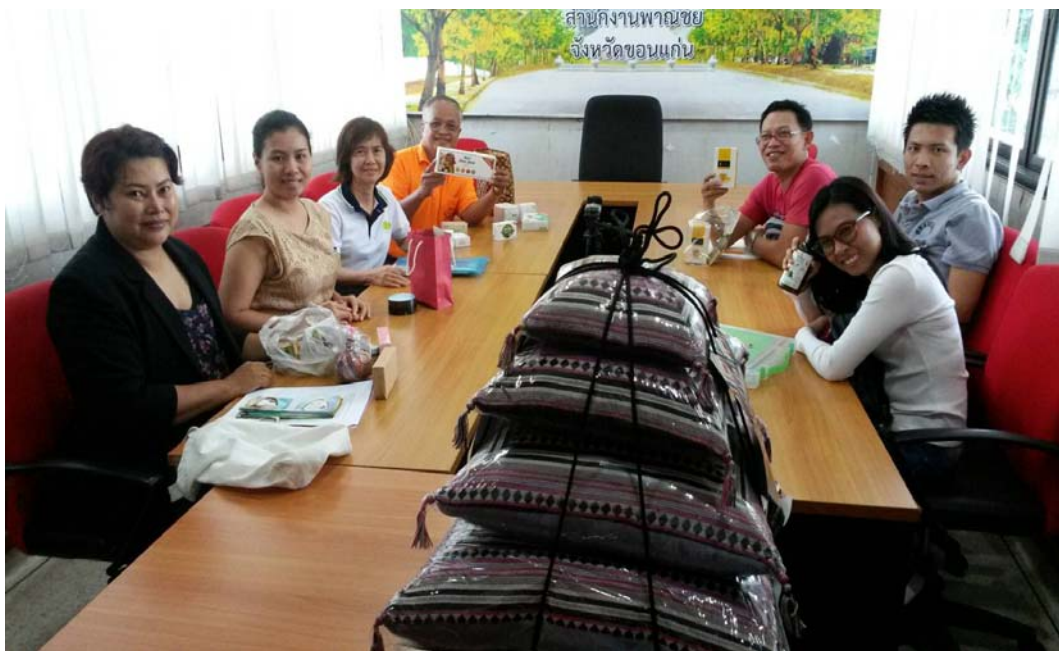
ภาพที่ ๗.๘ การลงพื้นที่สังเกตการณ์ในการต่อ ยอดธุรกิจสปาของผู้ประกอบการร่วมกับสำนักงานพาณิชย์จังหวัดขอนแก่น