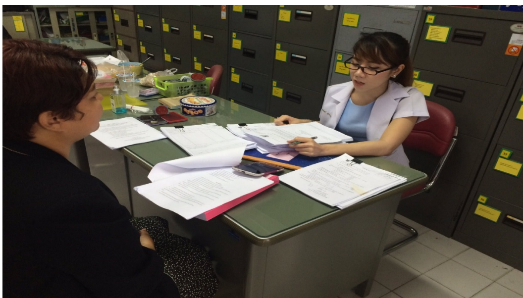
ภาพที่ ๕.๖ การลงพื้นที่สัมภาษณ์ผู้ให้ข้อมูลหลัก จังหวัดอุบลราชธานี