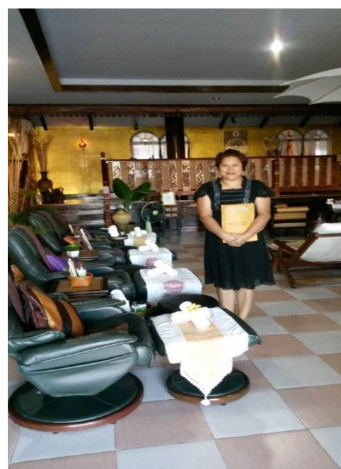
ภาพที่ ๑.11 การลงพื้นที่เก็บข้อมูลในภาคตะวันออกเฉียงเหนือ