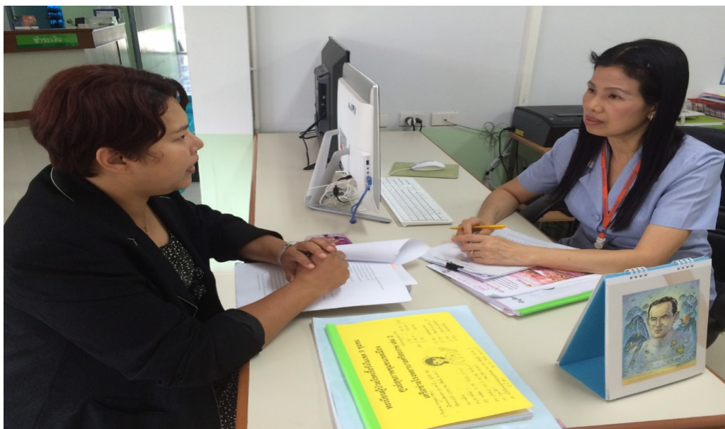
ภาพที่ ๓.4 การลงพื้นที่สัมภาษณ์ผู้ให้ข้อมูลหลัก จังหวัดศรีสะเกษ