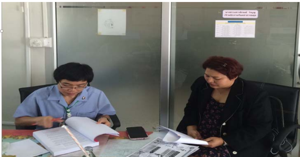
ภาพที่ ๕.๕ การลงพื้นที่สัมภาษณ์ผู้ให้ข้อมูลหลัก จังหวัดอำนาจเจริญ