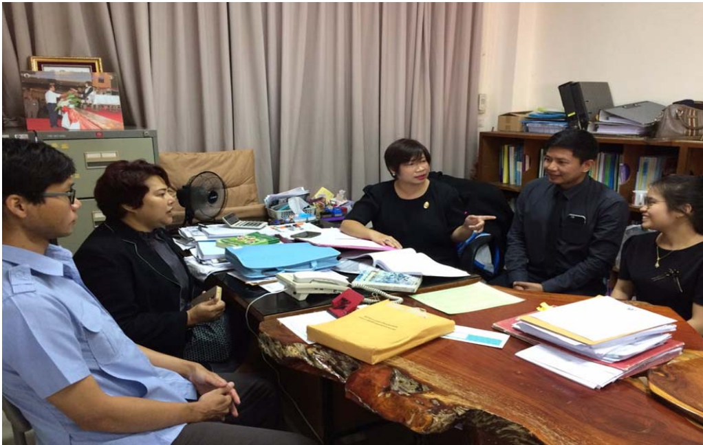
ภาพที่ ๓.3 การลงพื้นที่สัมภาษณ์ผู้ให้ข้อมูลหลัก จังหวัดบุรีรัมย์