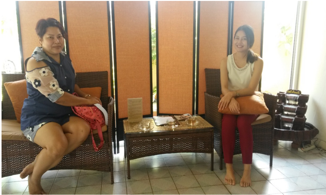
ภาพที่ ๗.7 การลงพื้นที่สัมภาษณ์ผู้ให้ข้อมูลหลัก จังหวัดร้อยเอ็ด