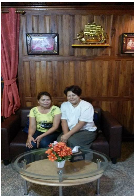
ภาพที่ ๓.๙ การลงพื้นที่เก็บข้อมูลในภาคตะวันออกเฉียงเหนือ