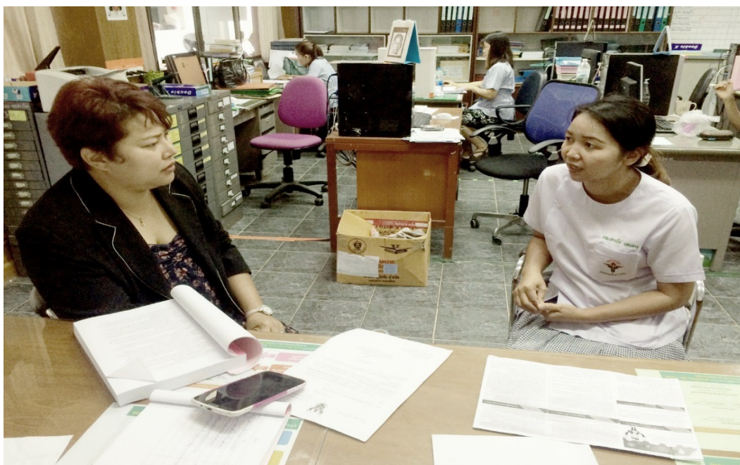
ภาพที่ ๓.2 การลงพื้นที่สัมภาษณ์ผู้ให้ข้อมูลหลัก จังหวัดยโสธร