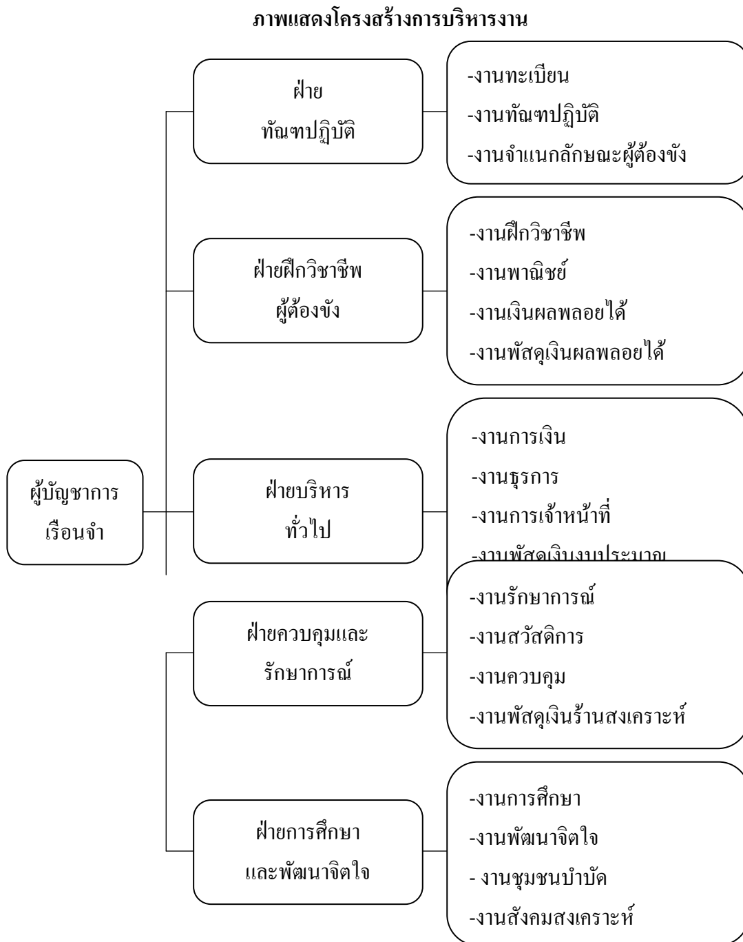
ภาพที่ 2.1 แผนภูมิแสดงโครงสร้างการบริหารงาน