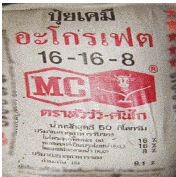
ภาพที่ ก.2 ปุ๋ยเคมีสูตร 16-16-8 ของบริษัท ไทยเซ็นทรัล เคมี จำกัด (มหาชน) จำกัด ใส่ในช่วงก่อนปักดำ 1 วัน (ข้าวอายุ 25 วัน หลังงอก) อัตรา 20 กิโลกรัมต่อไร่