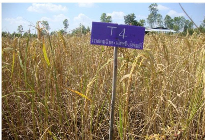
ภาพที่ ก.10 ข้าวพันธุ์ข้าวตอกมะลิ 105 อายุ 110 วัน หลังปักดำ ช่วงเดือนพฤศจิกายน พ.ศ. 2557 ในแปลงทดลองใส่ปุ๋ยเคมีสูตร 16-16-8 ร่วมกับปุ๋ยอินทรีย์คุณภาพสูง สูตร 3