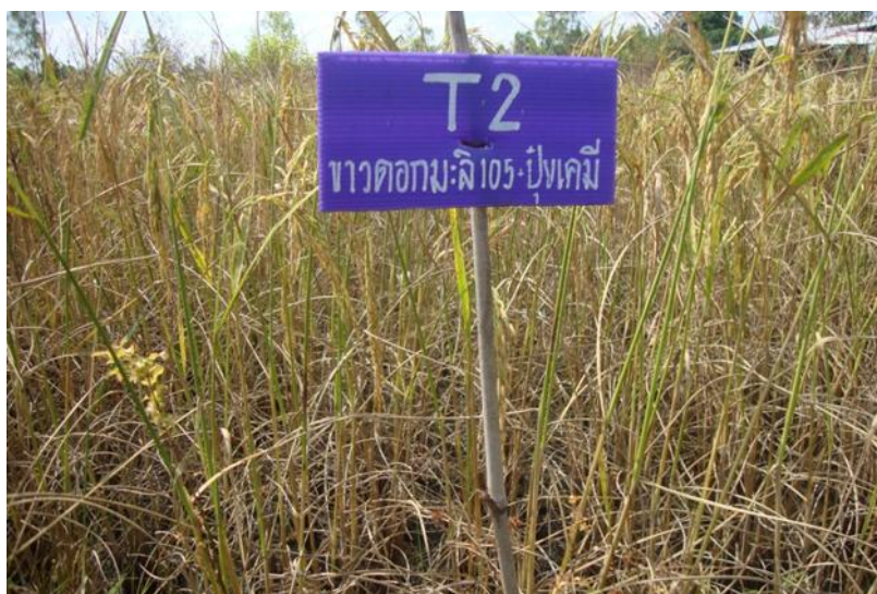
ภาพที่ ก.8 ข้าวพันธุ์ข้าวดอกมะลิ 105 อายุ 110 วัน หลังปักดำ ช่วงเดือนพฤศจิกายน พ.ศ. 2557 ในแปลงทดลองใส่ปุ๋ยเคมีสูตร 16-16-8 และสูตร 46-0-0