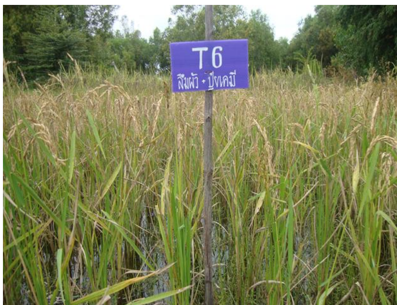
ภาพที่ ก.12 ข้าวพันธุ์ลิมดำอายุ 110 วัน หลังปักดำช่วงเดือนพฤศจิกายน พ.ศ. 2557 ในแปลง ทดลองใส่ปุ๋ยเคมีสูตร 16-16-8 และสูตร 46-0-0