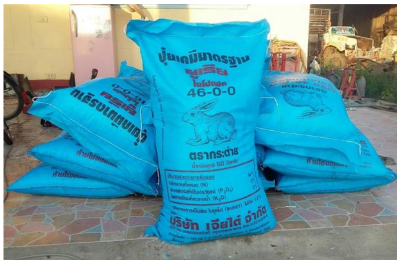
ภาพที่ ก.3 ปุ๋ยเคมีสูตร 46-0-0 ของบริษัทเจริญได้ จำกัด ใส่ระยะ 30 วัน ก่อนข้าวออกดอก อัตรา 10 กิโลกรัมต่อไร่