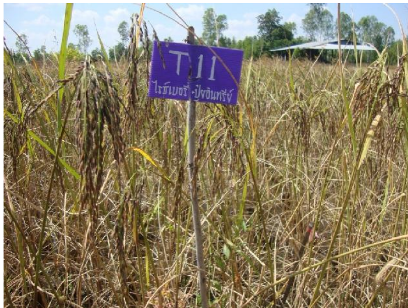
ภาพที่ ก.17 ข้าวพันธุ์ไรซ์เบอร์รี่อายุ 110 วันหลังปักดำช่วงเดือนพฤศจิกายน พ.ศ. 2557 ในแปลงทดลองใส่ปุ๋ยอินทรีย์คุณภาพสูง สูตร 3