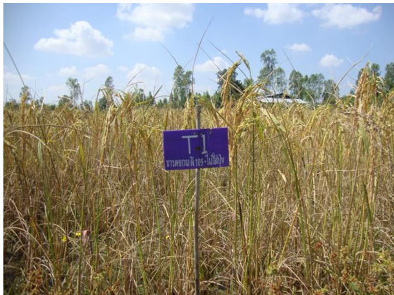
ภาพที่ ก.7 ข้าวพันธุ์ข้าวดอกมะลิ 105 อายุ 110 วัน หลังปักดำ ช่วงเดือนพฤศจิกายน พ.ศ. 2557 ในแปลงทดลองไม่ได้ใส่ปุ๋ย