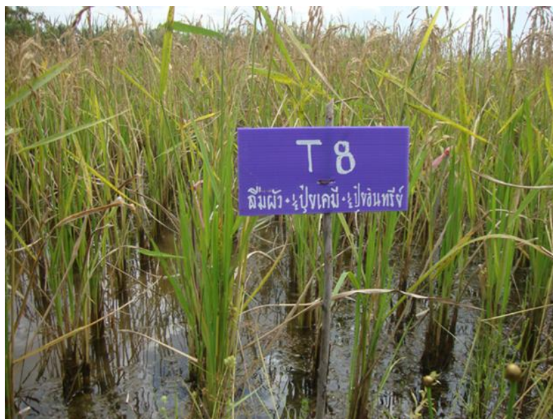
ภาพที่ ก.14 ข้าวพันธุ์ส้มผิวอายุ 110 วัน หลังงอก ช่วงเดือนพฤศจิกายน พ.ศ. 2557 ในแปลงทดลองใต้น้ำเคมีสูตร 16-16-8 ร่วมกับน้ำอินทรีย์คุณภาพสูง สูตร 3