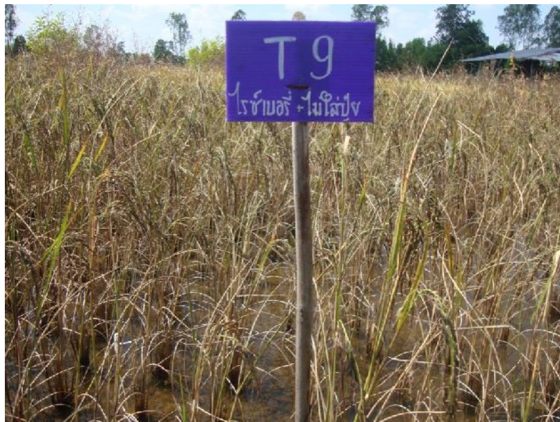
ภาพที่ ก.15 ข้าวพันธุ์ไรซ์เบอร์รี่อายุ 110 วัน หลังปักดำช่วงเดือนพฤศจิกายน พ.ศ. 2557 ในแปลงทดลองไม่ใส่ปุ๋ย