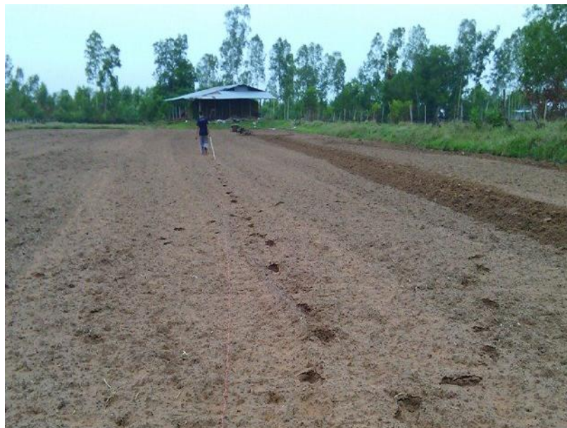
ภาพที่ ก.1 การเตรียมดินทำแปลงทดลอง ก่อนปลูกข้าวในแปลงทดลองตำบลคงครั้งน้อย อำเภอกษัตริย์ จังหวัดร้อยเอ็ด