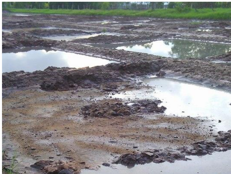
ภาพที่ ก.5 การใส่ปุ๋ยอินทรีย์คุณภาพสูง ก่อนปักดำ 2 สัปดาห์ ช่วงเดือนกรกฎาคม พ.ศ. 2557 ในสภาพแปลงทดลอง