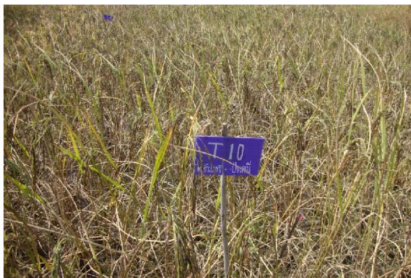
ภาพที่ ก.16 ข้าวพันธุ์ไรซ์เบอร์รี่อายุ 110 วัน หลังปักดำช่วงเดือนพฤศจิกายน พ.ศ. 2557 แปลงทดลองใส่ปุ๋ยเคมีสูตร 16-16-8 และสูตร 46-0-0