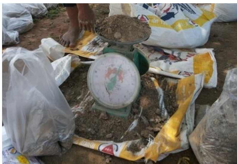
ภาพที่ ก.4 ปุ๋ยอินทรีย์คุณภาพสูง ใส่ในช่วง 2 สัปดาห์ ก่อนการปักดำ อัตรา 400 กิโลกรัมต่อไร่