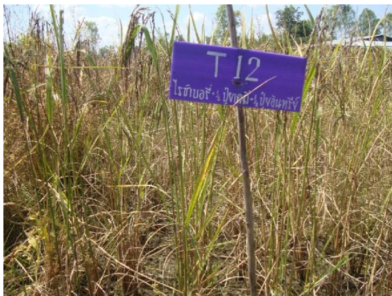
ภาพที่ ก.18 ข้าวพันธุ์ไรซ์เบอร์รี่อายุ 110 วันหลังปักดำช่วงเดือนพฤศจิกายน พ.ศ. 2557 ในแปลงทดลองใส่ปุ๋ยเคมีสูตร 16-16-8 ร่วมกับปุ๋ยอินทรีย์คุณภาพสูง สูตร 3