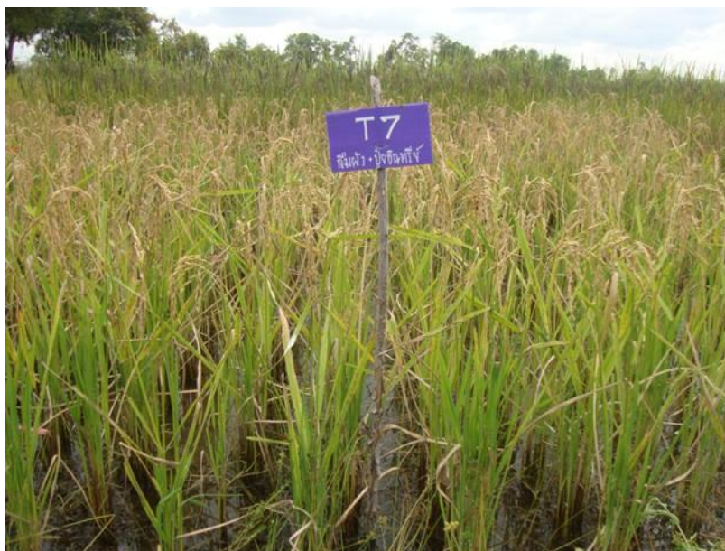
ภาพที่ ก.13 ข้าวพันธุ์ส้มผิวอายุ 110 วัน หลังงอก ช่วงเดือนพฤศจิกายน พ.ศ. 2557 ในแปลงทดลอง ใต้น้ำอินทรีย์คุณภาพสูงสุด 3