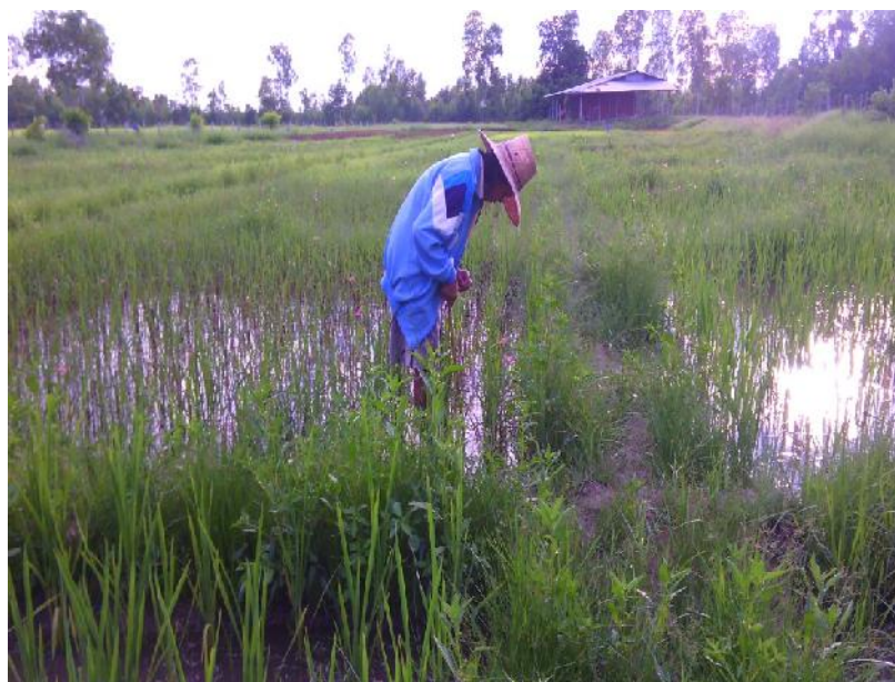
ภาพที่ ก.6 การเก็บข้อมูลด้านความสูงเมื่อข้าวอายุได้ 60 วัน หลังปักดำ ช่วงเดือนสิงหาคม พ.ศ. 2557 ในแปลงทดลอง