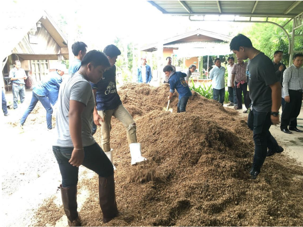
ภาพที่ 14 กลุ่มเลี้ยงวัวทำมันหมักยีสต์

เกษตรกรมีกำไรเฉลี่ยตัวละ 3,000-5,000 บาท ซึ่งการเลี้ยงโคเนื้อ-โคขุนนี้นับเป็นงานที่สร้างรายได้ที่มั่นคงให้แก่ครัวเรือนของเกษตรกร และมันหมักก็ยังสามารถนำไปใช้เลี้ยง ควาย หมู เป็ด ไก่ และสัตว์เลี้ยงอื่น ๆ ได้อีกด้วย