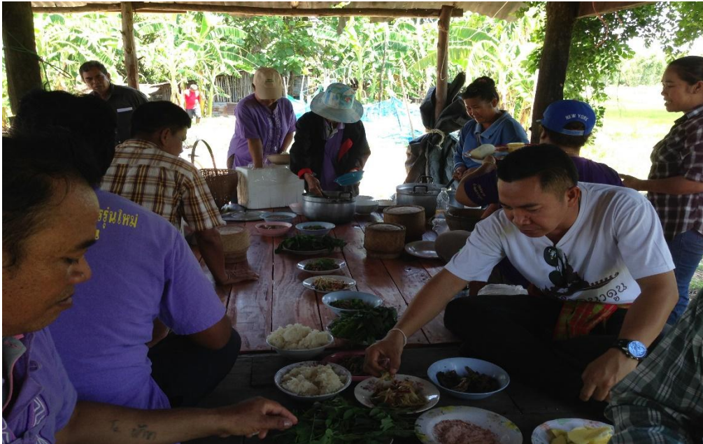
ภาพที่ 19 การกินข้าวร่วมพาของสมาชิกเครือข่าย หลังเสร็จจากการทำกิจกรรมร่วมกัน