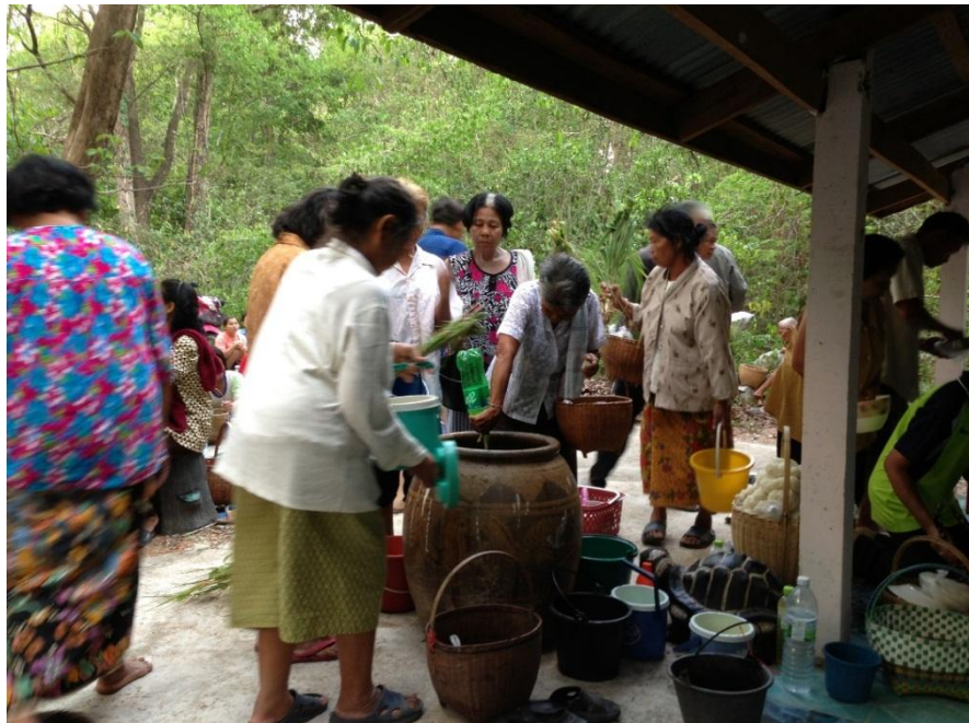
ภาพที่ 22 ประเพณีเลี้ยงตาปู่ ของเกษตรกรตำบลนาคูน