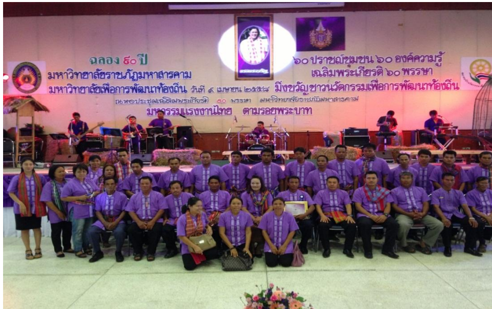
ภาพที่ 25 งาน 60ปราชญ์ชุมชน 60 องค์ความรู้ เฉลิมพระเกียรติ 60 พรรษา สมเด็จพระเทพรัตนราชสุดาสยามบรมราชกุมารี

จากการพัฒนารูปแบบการสร้างเครือข่ายเกษตรกรภาคครัวเรือน ผ่านการทำกิจกรรมตามคุณลักษณะของเกษตรกรรุ่นใหม่ทั้ง 7 ประการ ผู้วิจัยสามารถนำมาสรุปเป็นรูปแบบได้ดังแผนภูมิต่อไปนี้