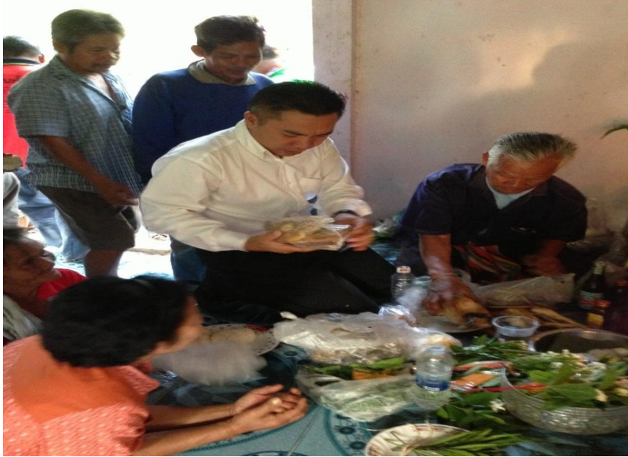
ภาพที่ 21 ประเพณีเลี้ยงตาปู่ ของเกษตรกรตำบลนาคูน

ถือเป็นการสร้างสภาวะจิตเกษตรกร ให้มองเห็นความสำคัญและคุณค่าของสิ่งเหนือธรรมชาติ และเป็นการสืบสานอนุรักษ์วัฒนธรรมประเพณีอันดีงามของชุมชนท้องถิ่นให้ดำรงอยู่ต่อไปได้อีกด้วย