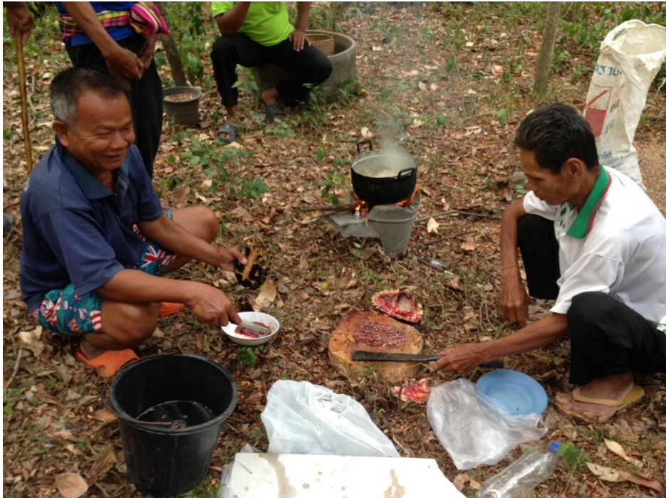
ภาพที่ 23 ประเพณีเลี้ยงตาปู ของเกษตรกรตำบลนาควน