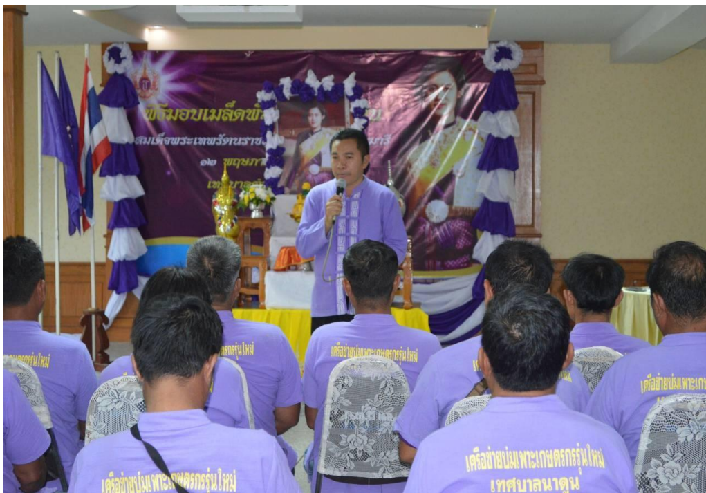
ภาพที่ 9 จัดการสนทนากลุ่มของเกษตรกร

สถานการณ์ผ่านเวทีสนทนา ยังเป็นการเปิดโอกาสให้เกษตรกรได้แลกเปลี่ยนข้อมูล ความคิด และประสบการณ์ในการทำการเกษตรของตนเองกับผู้อื่น ซึ่งในช่วงที่ผ่านมาเกษตรกรไม่เคยได้ทำอย่างนี้มาก่อน ทำให้เกษตรกรได้รับชุดความรู้ใหม่ในด้าน เทคนิค วิธีการในการทำการเกษตร ทั้งการปลูกพืช และเลี้ยงสัตว์ให้ได้ผลผลิตดี การจัดเวทีแลกเปลี่ยนเรียนรู้นี้ทำให้เกษตรกรได้พัฒนาระบบความคิด มุมมอง และฝึกวางแผนเพื่อแก้ปัญหา เกษตรกรคิดได้เป็นระบบมากขึ้น และสามารถวิเคราะห์ปัญหา วางแผนเพื่อแก้ปัญหาได้ด้วยตนเอง ผ่านกระบวนการกลุ่ม เป็นลักษณะ ร่วมกันคิด ช่วยกันทำ