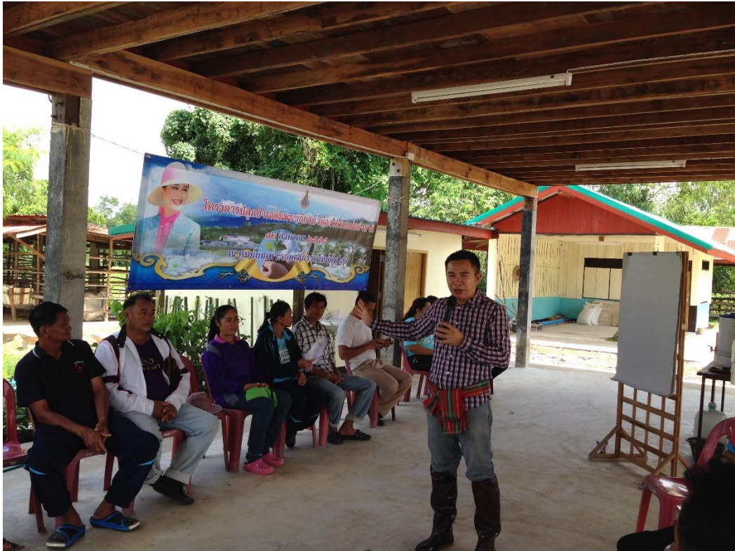
ภาพที่ 16 กิจกรรมสนทนากลุ่มเพื่อวิเคราะห์ตนเอง