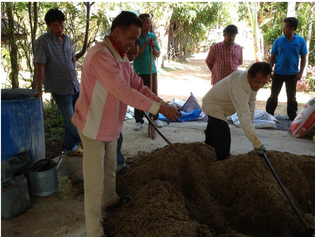
ภาพที่ 15 กิจกรรมทำปุ๋ยอินทรีย์ชีวภาพ

จากการร่วมกิจกรรมทำปุ๋ยอินทรีย์และน้ำหมักชีวภาพ ใช้งบ ของกลุ่มเครือข่าย ทำให้เกษตรกรที่เข้าร่วมกิจกรรม เกิดความรู้ ทักษะ และเรียนรู้ เทคนิค วิธีการใหม่ ๆ ในการผลิตปุ๋ยอินทรีย์ และน้ำหมักชีวภาพ หลังจากผ่านฝึกปฏิบัติร่วมกันจนครบทุกครัวเรือนของสมาชิกแล้ว เกษตรกรแต่ละรายสามารถนำความรู้และประสบการณ์ที่ได้ไปทำปุ๋ยและน้ำหมัก ใช้งบ ได้ที่แปลงเกษตรของตน ผลจากกิจกรรมกลุ่มปุ๋ยอินทรีย์ชีวภาพนี้ ทำให้เกษตรกรได้ใช้ ปุ๋ยดีราคาถูกในปริมาณที่เพียงพอต่อการเพาะปลูกของตน ซึ่งเป็นการนำความรู้ ทักษะ ประสบการณ์ที่ได้รับ ไปปรับประยุกต์ใช้ในการทำการเกษตรของตนเองได้อย่างเหมาะสม