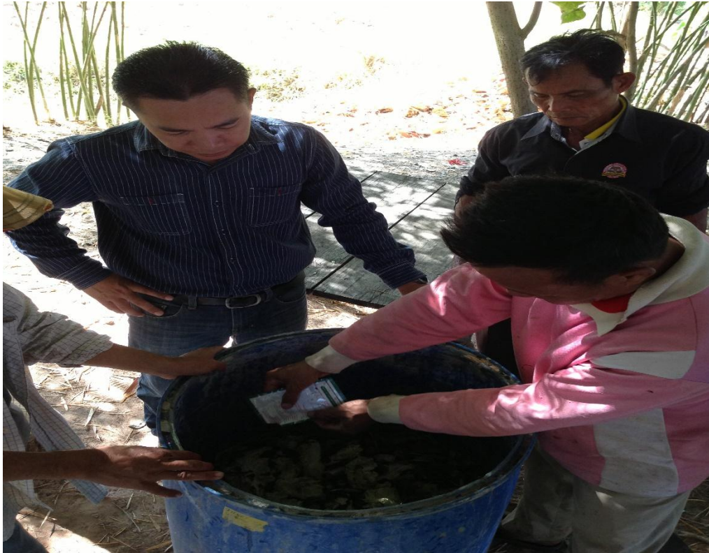
ภาพที่ 20 การทำน้ำหมักชีวภาพ