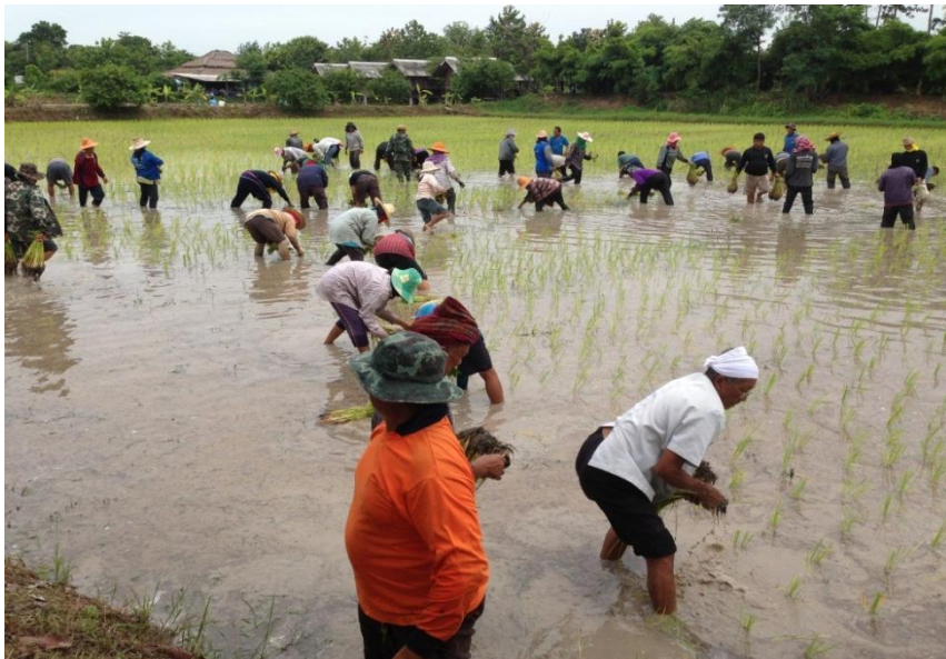
ภาพที่ 1 ประเพณีการลงแขกดำนา

สรุปโดยรวมแล้วสังคมภาคเกษตรยุคดั้งเดิมของตำบลนาควน มีลักษณะคล้ายคลึง กับสังคมเกษตรทั่วไป คือ ทำการเกษตรด้วยแรงงานคน และสัตว์เลี้ยง เช่น วัว ควาย และวิถี ชีวิตดำรงอยู่บนการพึ่งพิงธรรมชาติ อาศัยธรรมชาติในการทำเกษตร ทั้งน้ำฝน ป่าไม้ ความ อุดมสมบูรณ์ของผืนดิน และสภาพภูมิอากาศที่เกื้อหนุนให้สามารถผลิตปัจจัยสี่เพื่อเลี้ยงชีวิต ของตนและบุคคลในครอบครัวได้ ลักษณะการทำเกษตรเป็นการทำเพื่ออยู่เพื่อกิน เหลือ จากการกินนำไปแลกเปลี่ยนปัจจัยอื่น ๆ ที่จำเป็นต่อการดำรงชีพ และแบ่งปัน ทำบุญตามจารีต ประเพณี ลักษณะโครงสร้างทางสังคม ส่วนใหญ่อยู่แบบเป็นครอบครัวใหญ่คือมี พ่อ แม่ พี่ น้อง ปู่ ย่า ตา ยาย มีความสัมพันธ์แบบเครือญาติ พึ่งพาอาศัยกัน อยู่ร่วมกันอย่างสงบ เคารพเชื่อ พึ่งผู้อาวุโส มีวิถีชีวิตที่เรียบง่ายไม่ต้องดิ้นรนมาก ครอบครัวอบอุ่น ชุมชน สังคมสงบร่มเย็น