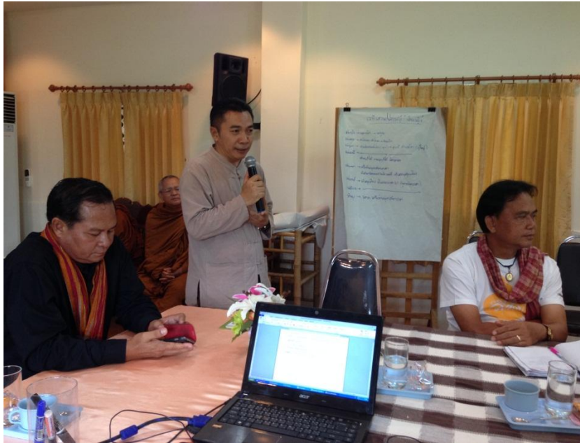
ภาพที่ 8 วิเคราะห์จุดเปลี่ยนผ่านจากความเป็นเกษตรกรรมเก่าสู่ความเป็นเกษตรกรรมใหม่