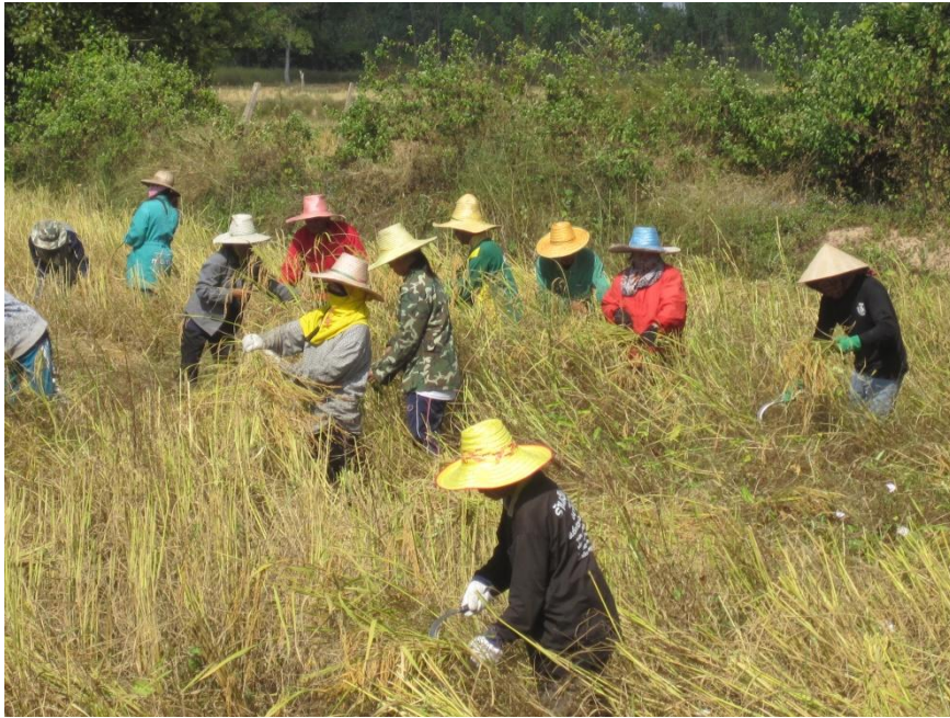
ภาพที่ 2 ประเพณีลงแขกเกี่ยวข้าว