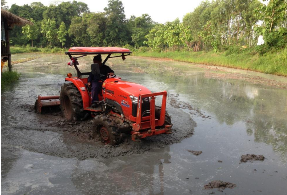
ภาพที่ 3 การใช้เครื่องจักรกลทำการเกษตรแทนแรงงานคนและสัตว์

น้อยลง การดำเนินชีวิตของคนในยุคนี้ถือเอาเงินเป็นตัวตั้ง มากกว่าการเอาชีวิตเป็นตัวตั้ง เข้าลักษณะสังคมแบบตัวใครตัวมัน เกิดสภาพสังคมมีปัญหา การพัฒนาไม่ยั่งยืน