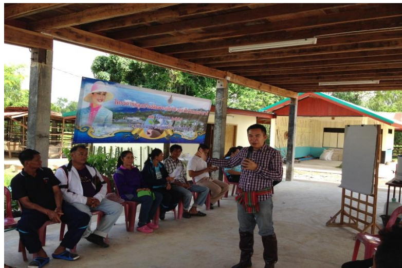
ภาพที่ 7 เกษตรกรร่วมกันวิเคราะห์จุดเปลี่ยนผ่านจากความเป็นเกษตรกรรุ่นเก่าสู่ความเป็นเกษตรกรรุ่นใหม่

จากการเปลี่ยนผ่านของสังคมภาคเกษตรยุคทุนนิยมสู่ยุคเกษตรทฤษฎีใหม่ วิฤตติการณ์ทางสังคมที่เกิดขึ้นกับภาคเกษตร ที่ประสบปัญหา สังคมอ่อนแอ การพัฒนาไม่ยั่งยืน ขาดทายาทที่จะสืบต่อการทำอาชีพเกษตรกรรมจากรุ่นพ่อแม่สู่รุ่นลูกหลาน ทำให้เกษตรกรต้องหันกลับมาแสวงหาวิธีการที่จะทำให้อยู่รอดในการประกอบอาชีพเกษตรกรรม จากการร่วมเสวนากลุ่มเกษตรกรมีความเห็นร่วมกันว่า การทำการเกษตรแบบผสมผสานตามแนวทฤษฎีใหม่ น่าจะเป็นทางเลือกรอดของสังคมภาคเกษตรในพื้นที่ตำบลนาคูน ดังนั้นจึงมีความจำเป็นที่จะต้องบ่มเพาะให้เกิดเกษตรกรรุ่นใหม่ที่มีคุณลักษณะเหมาะสมต่อการประกอบอาชีพเกษตรกรรมขึ้น ที่ประชุมจึงมีความเห็นร่วมกันให้จัดตั้งศูนย์บ่มเพาะเกษตรกรรุ่นใหม่ขึ้น