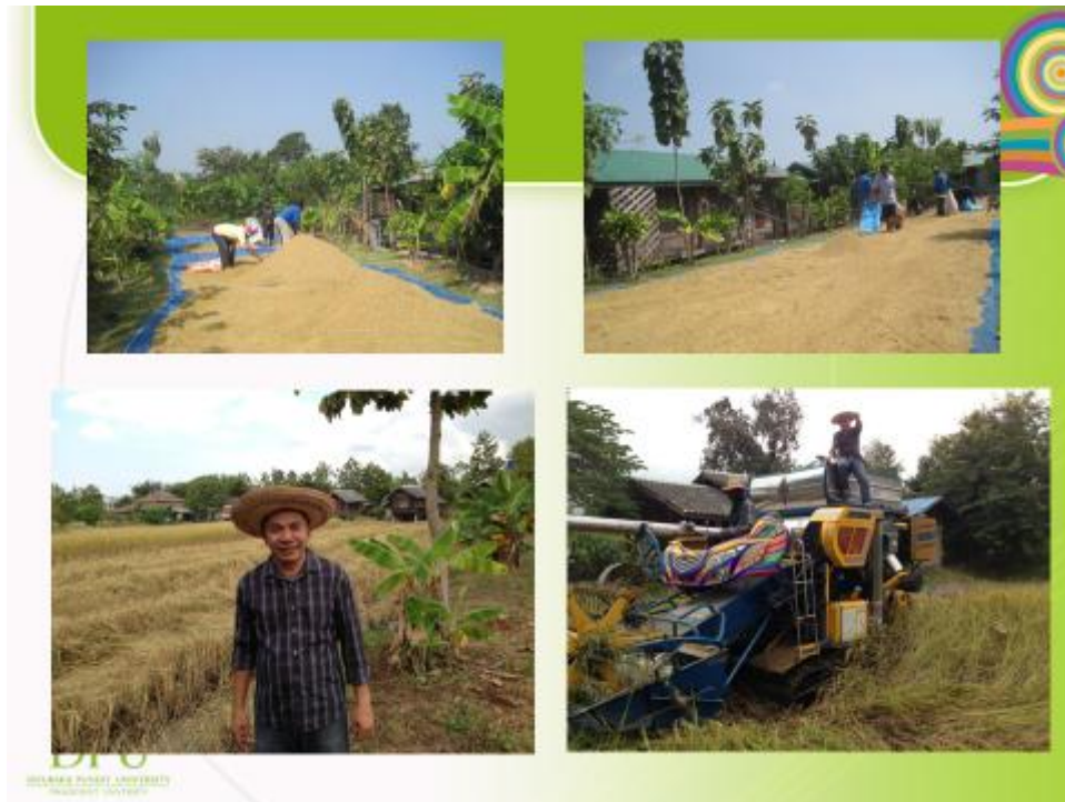
ภาพที่ 4 การใช้เครื่องจักรกลทำการเกษตรแทนแรงงานคนและสัตว์