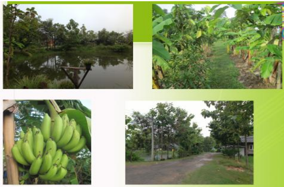
ภาพที่ 5 การทำเกษตรผสมผสานของเกษตรกรตำบลนาคูน

3. ผลจากการทำเกษตรผสมผสาน ทำให้เกิดการเปลี่ยนแปลงขึ้นภายในชุมชน ภาคเกษตรของตำบลนาคูน เกษตรกรที่ผ่านการฝึกอบรมส่วนใหญ่ ลงมือทำการเกษตรผสมผสานอย่างจริงจัง จากการสัมภาษณ์ นายนิยม สิงหาร เกษตรกรชาวบ้าน โนนสะอาด หมู่ที่ 8 พบว่า การทำเกษตรผสมผสานของตนเองและครอบครัวทำให้มีสภาพชีวิตความเป็นอยู่ดีขึ้น คือ มีอาหารเพียงพอต่อการบริโภคของคนในครัวเรือนซื้อหาเฉพาะสิ่งจำเป็นที่ตนเองผลิตไม่ได้เท่านั้น ผลผลิตที่เหลือได้นำไปขายในตลาด ทำให้มีรายได้ทุกวันอย่างน้อยวันละ 500-1,000 บาท