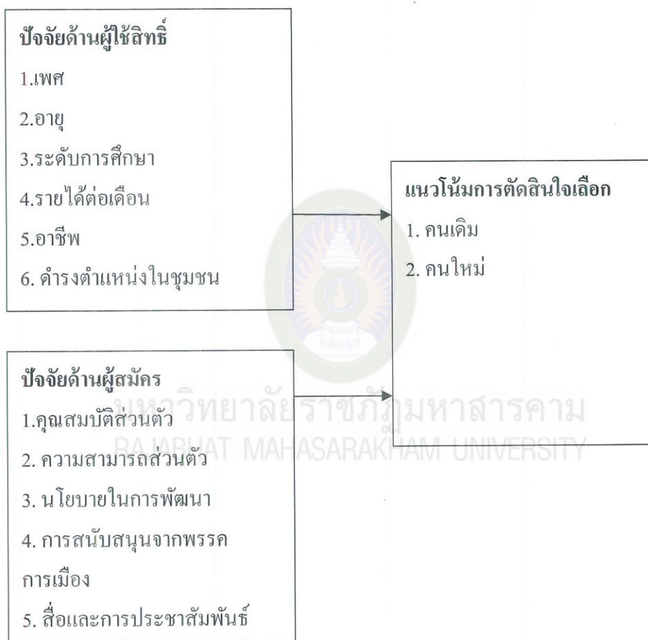
แผนภาพที่ 1 กรอบแนวคิดในการวิจัย