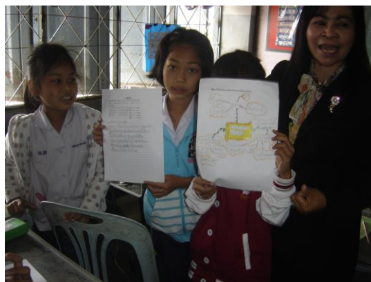
ภาพประกอบการใช้รูปแบบการเรียนการสอนเขียนเชิงสร้างสรรค์