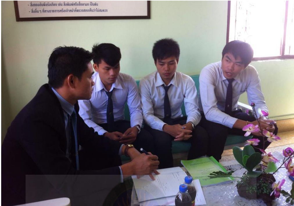
ภาพภาคผนวกที่ 3 การสัมภาษณ์นักศึกษา วันที่ 18 เดือน เมษายน พ.ศ. 2558