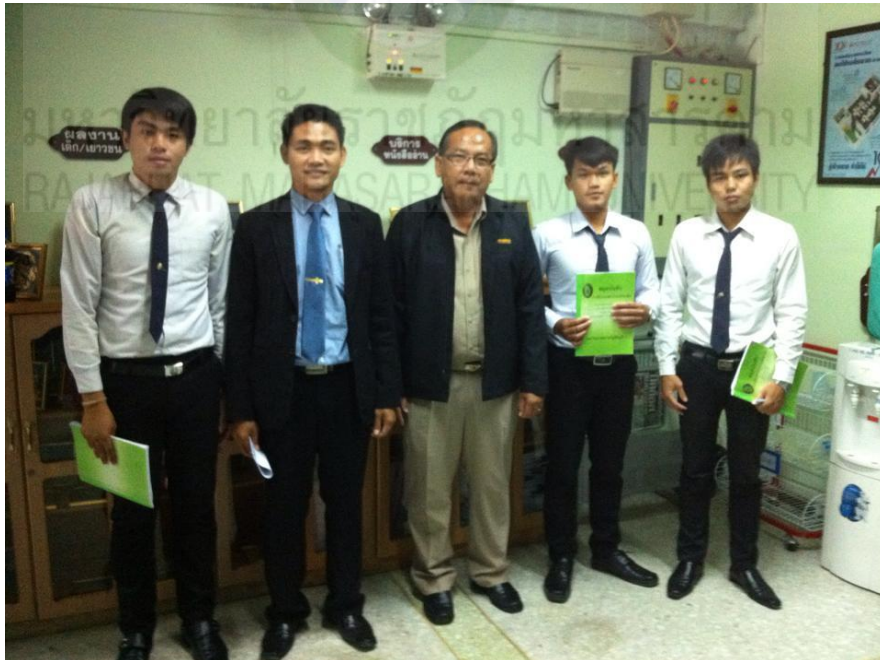
ภาพภาคผนวกที่ 2 การสัมภาษณ์ผู้ใช้บัณฑิตและนักศึกษา วันที่ 18 เดือน เมษายน พ.ศ. 2558