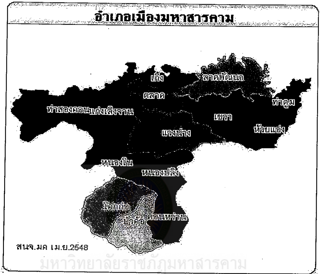
แผนที่ 2 แผนที่อำเภอเมืองมหาสารคาม