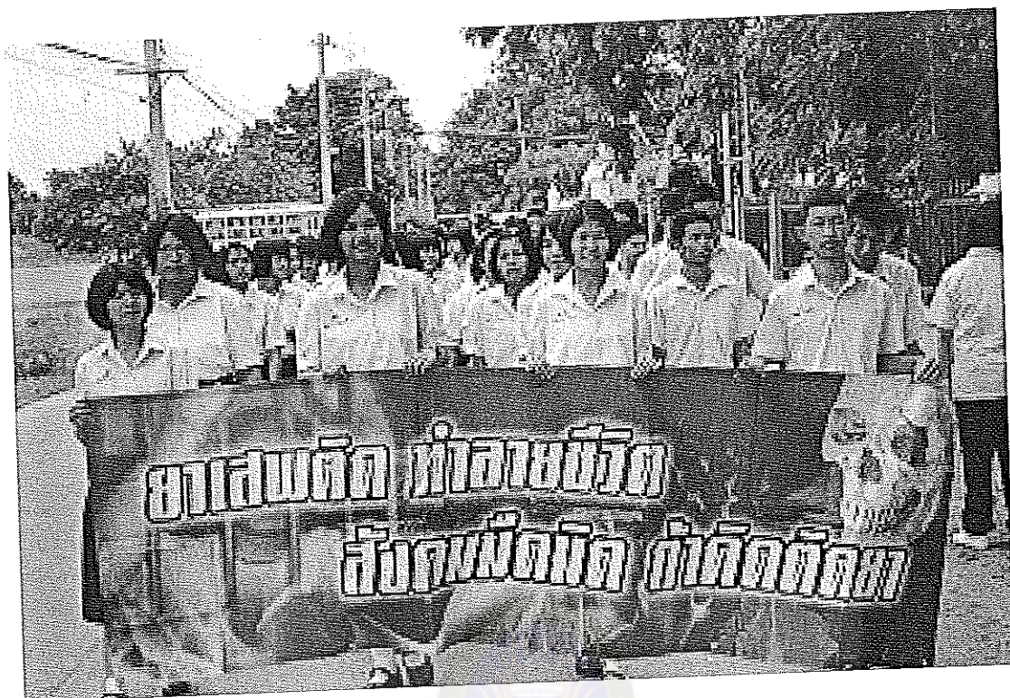
ภาพที่ 11 กิจกรรมรณรงค์ด้านยาเสพติด