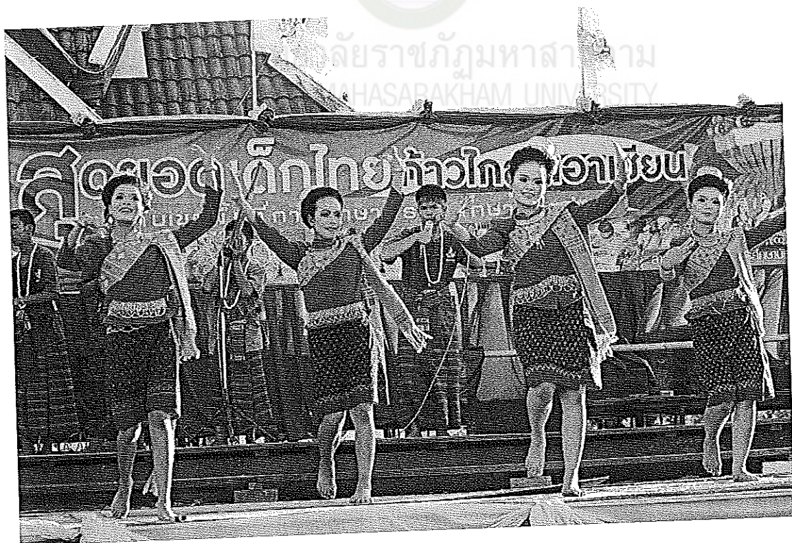
ภาพที่ 12 กิจกรรม TO BE NUMER ONE