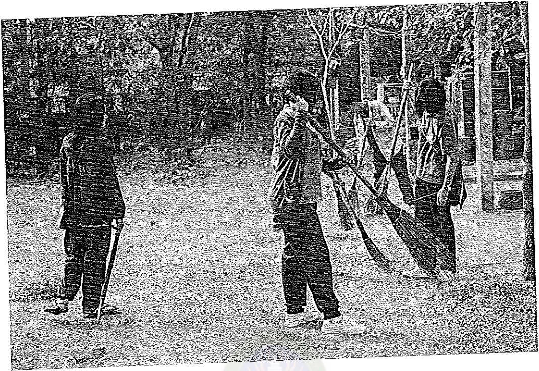
ภาพที่ 9 นักเรียนรักษาภาพแวดล้อมของโรงเรียน