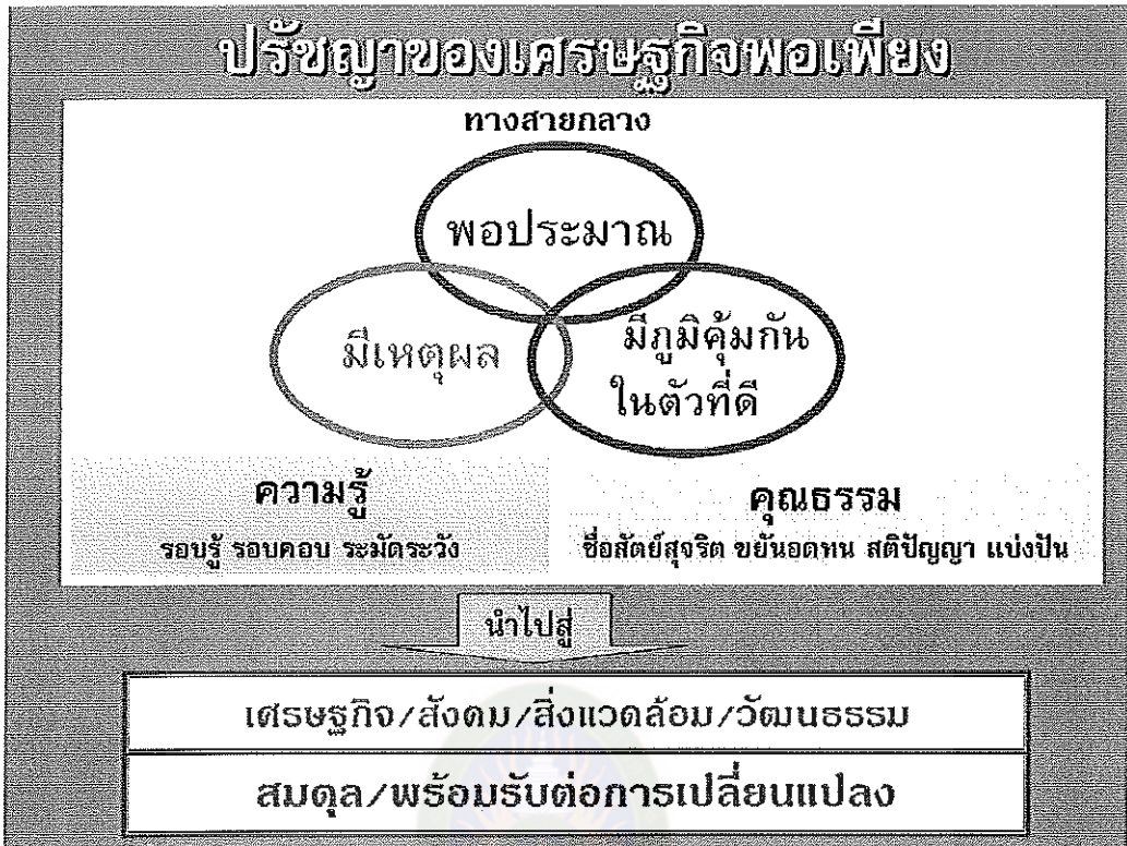
แผนภาพที่ 2 องค์ประกอบปรัชญาของเศรษฐกิจพอเพียง