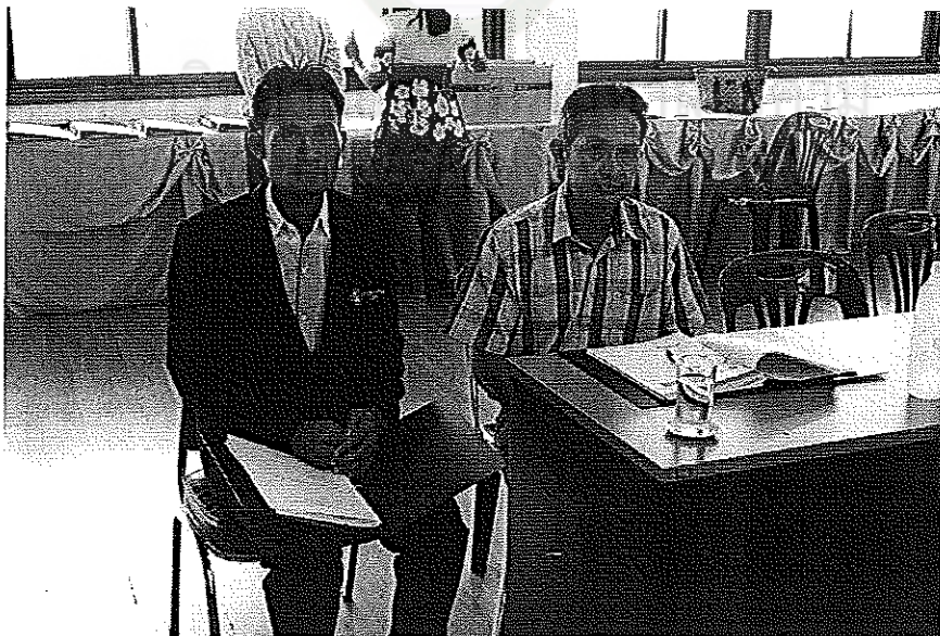
สัมภาษณ์ผู้ทรงคุณวุฒิ โรงเรียนประชาพัฒนา