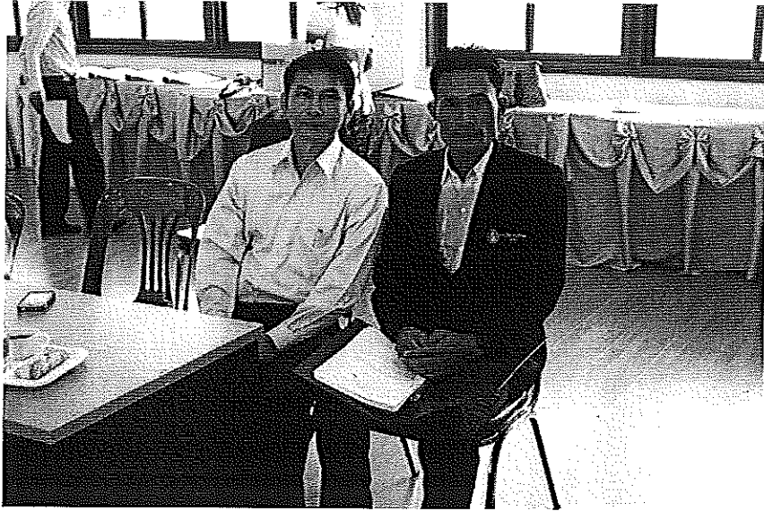
สัมภาษณ์ผู้ทรงคุณวุฒิโรงเรียนมัธยมยางสีสุราช