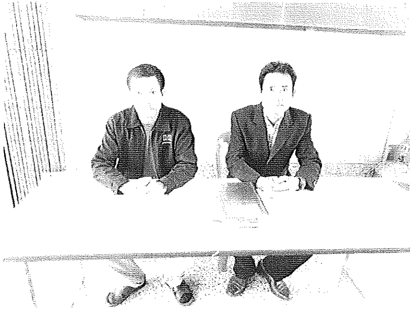
สัมภาษณ์ผู้ทรงคุณวุฒิ โรงเรียนพณิชยการวิทย์วิทยาการ