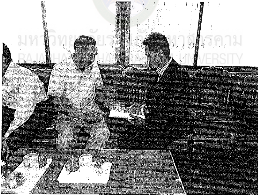
สัมภาษณ์ผู้ทรงคุณวุฒิโรงเรียนนาคนประชาสรรค์