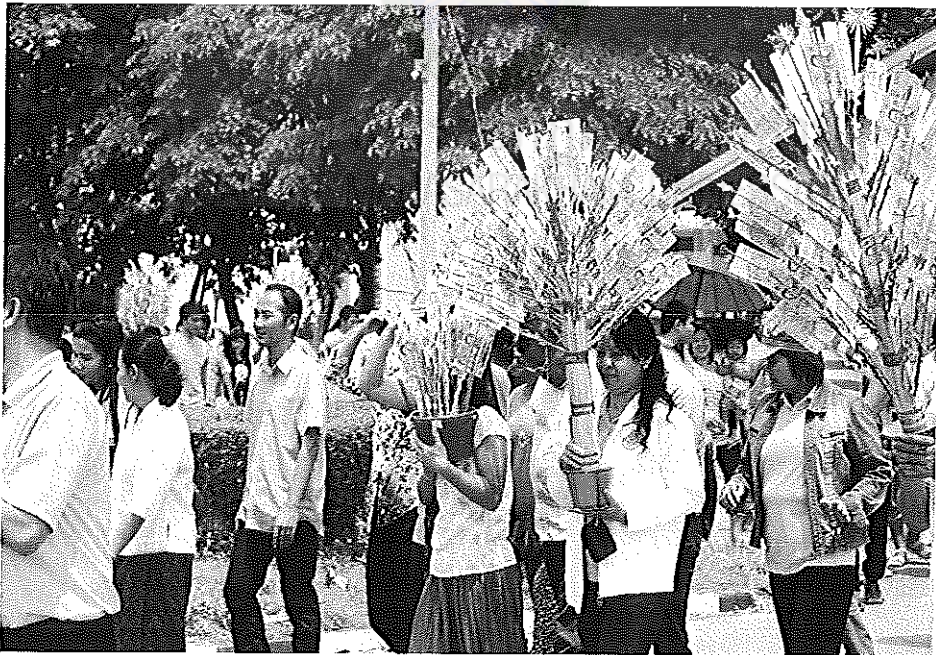
ภาพภาคผนวกที่ 6 การระดมทุนของโรงเรียนท่าขนอยางพิทยาคม