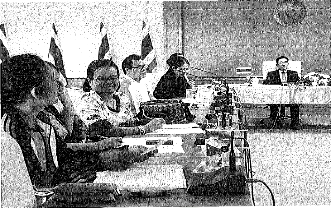
ภาพภาคผนวกที่ 3 การสัมภาษณ์ผู้ที่ประสบความสำเร็จในการระดมทุน