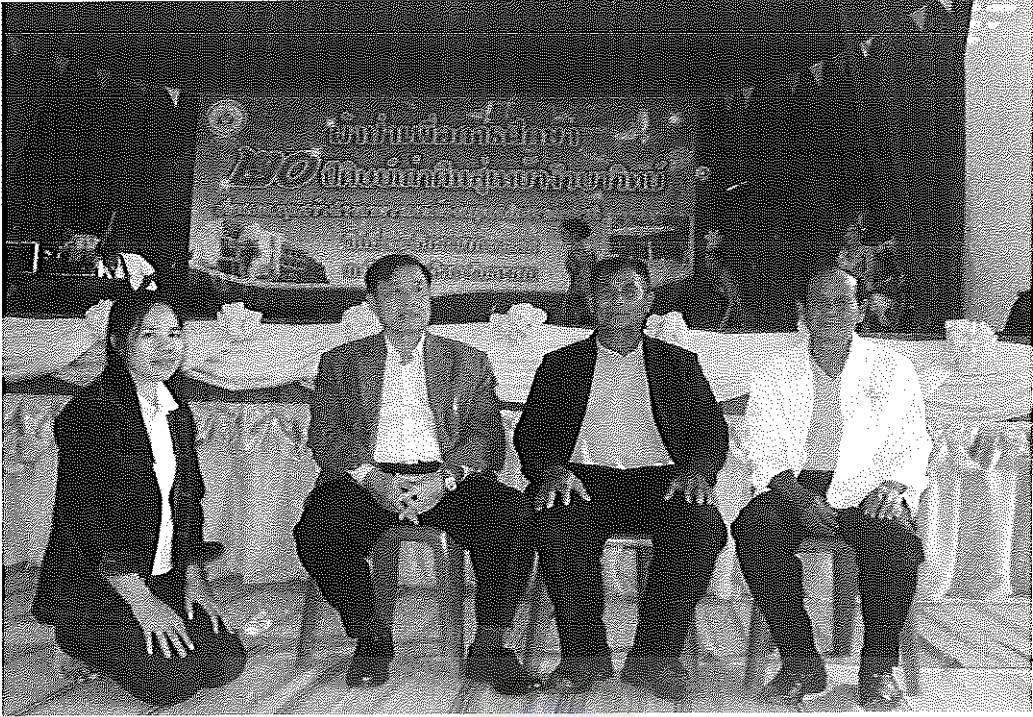
ภาพภาคผนวกที่ 13 การระดมทุนของโรงเรียนจ้วบวิทยาคม