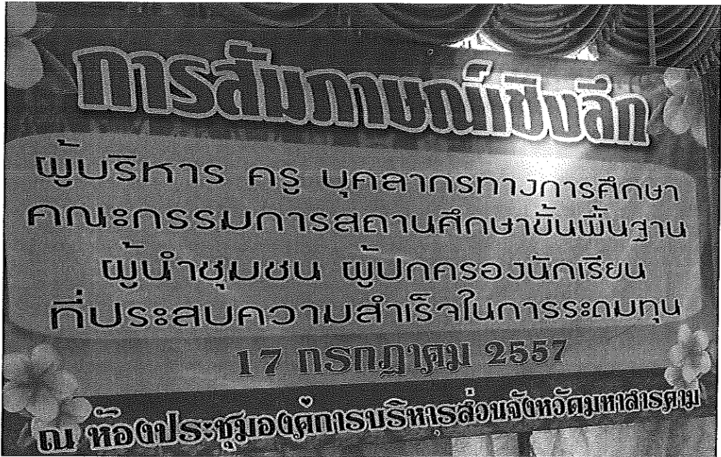
ภาพภาคผนวกที่ 1 แผ่นป้ายประกอบการสัมภาษณ์เชิงลึก