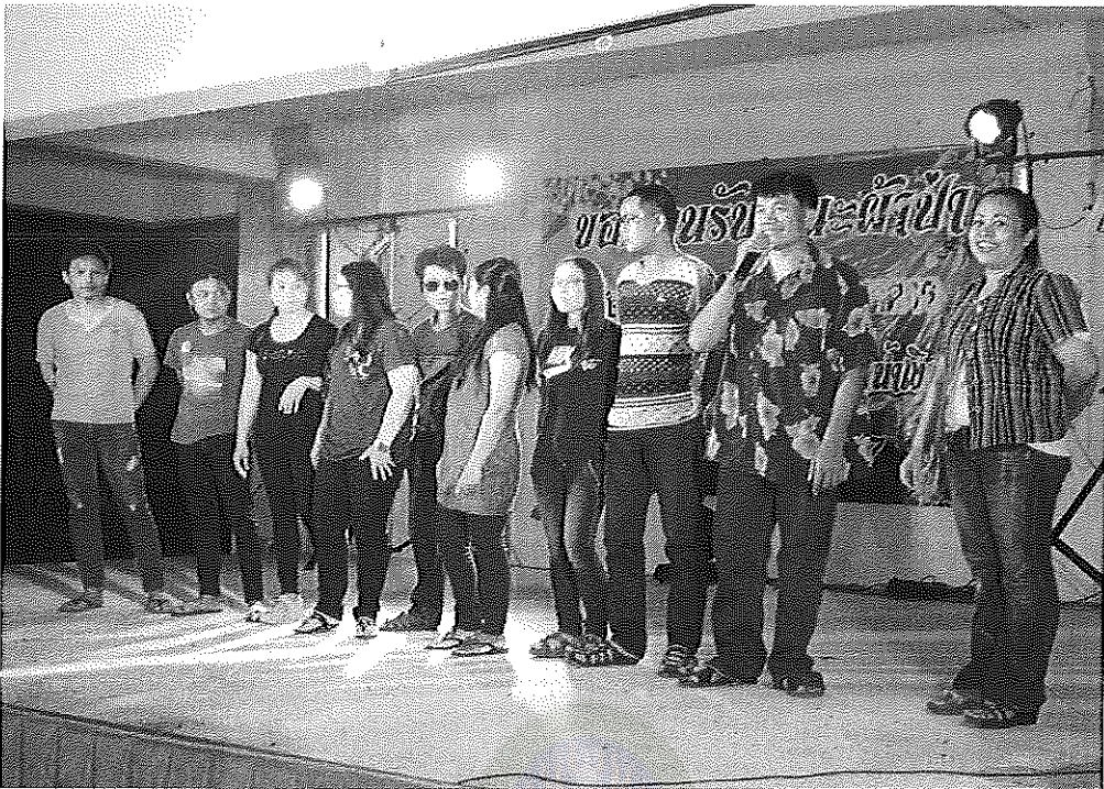
ภาพภาคผนวกที่ 17 การระดมทุนของโรงเรียนคอนเงินพิทยาคาร