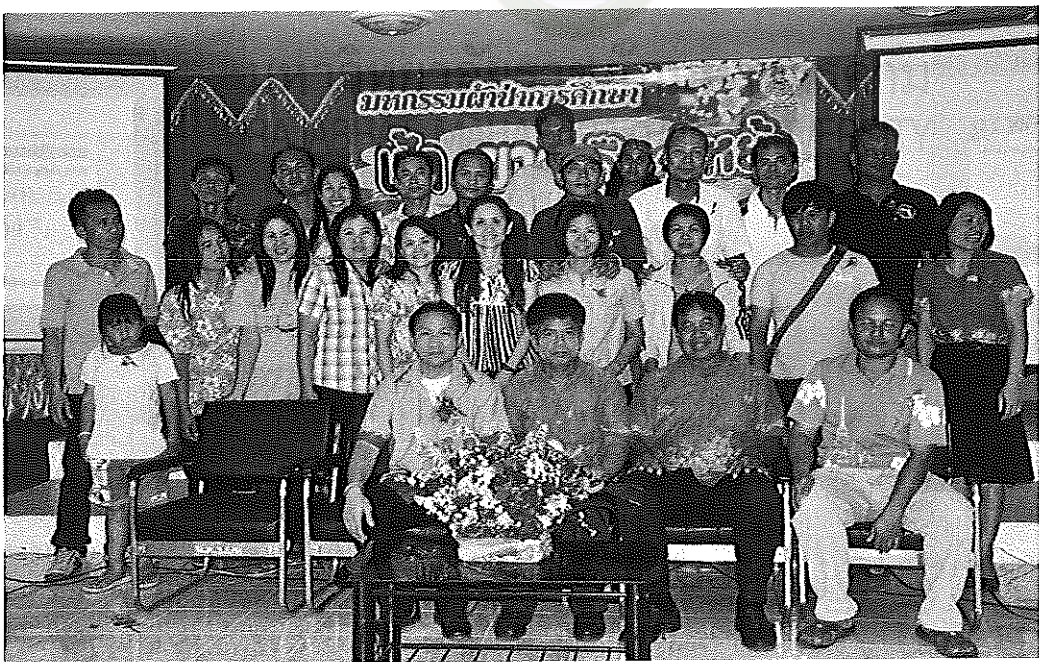
ภาพภาคผนวกที่ 8 การระดมทุนของโรงเรียนนาข้าววิทยาคม