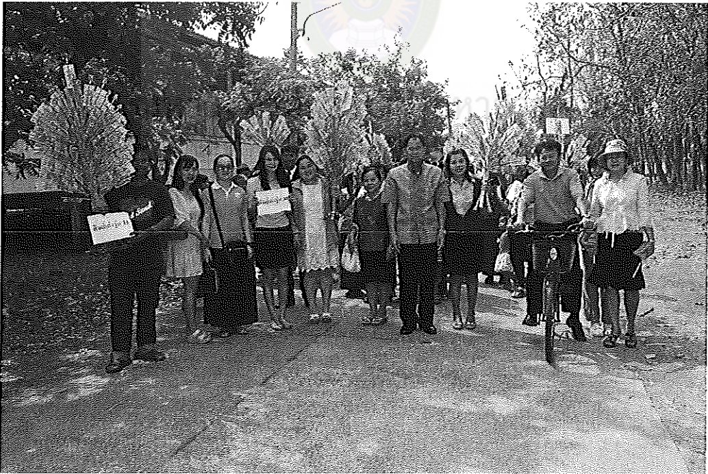
ภาพภาคผนวกที่ 16 การระดมทุนของโรงเรียนนาสีนวนพิทยาสรรค์