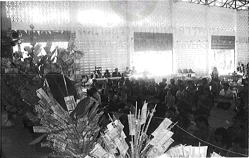
ภาพภาคผนวกที่ 14 การระดมทุนของโรงเรียนจ้วบวิทยาคม