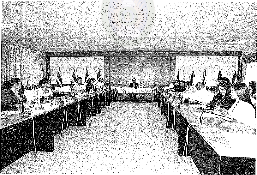
ภาพภาคผนวกที่ 2 ผู้วิจัยแนะนำข้อมูลการวิจัย