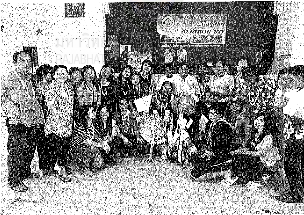
ภาพภาคผนวกที่ 12 การระดมทุนของโรงเรียนโคกก่อพิทยาคม