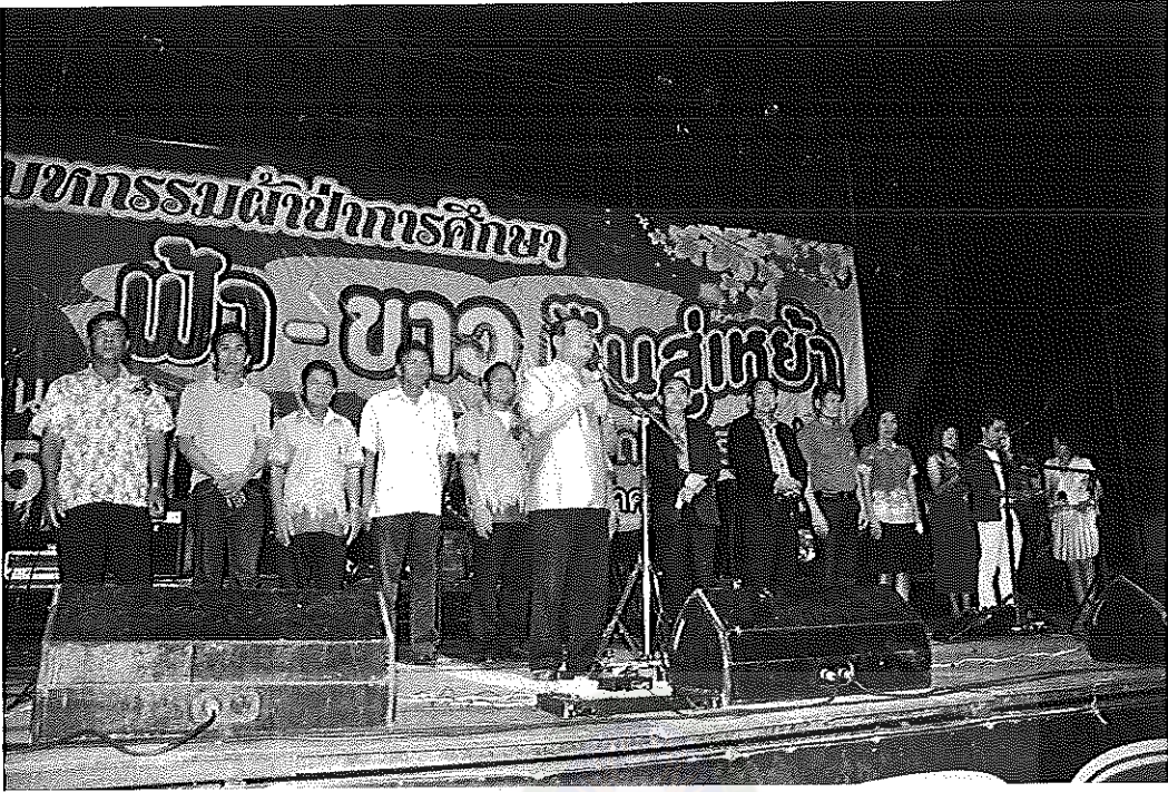
ภาพภาคผนวกที่ 7 การระดมทุนของโรงเรียนนาข้าววิทยาคม