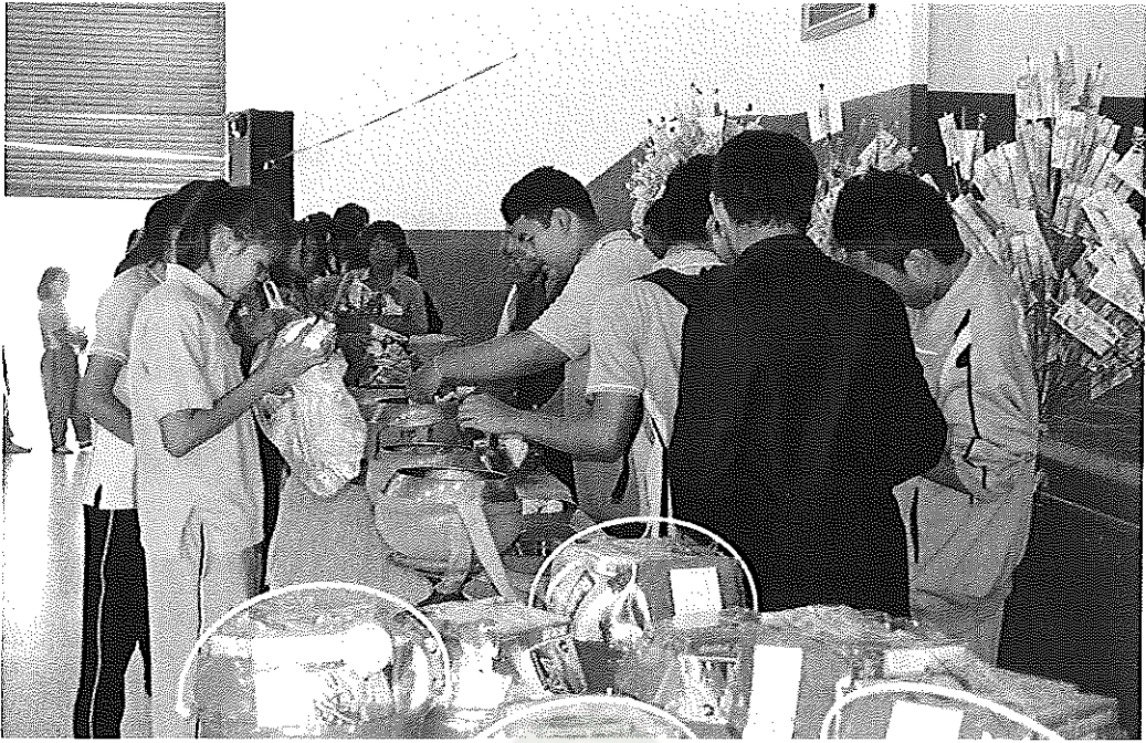
ภาพภาคผนวกที่ 15 การระดมทุนของโรงเรียนนาสีนวนพิทยาสรรค์