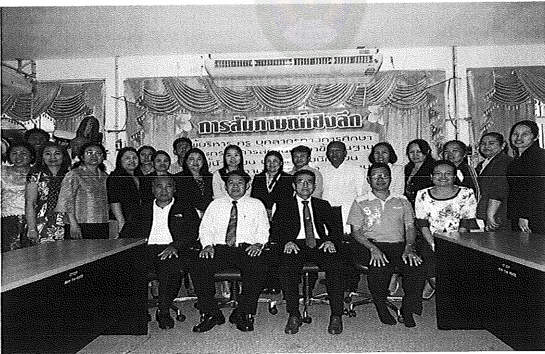
ภาพภาคผนวกที่ 4 ถ่ายภาพเป็นที่ระลึกกับผู้ให้ข้อมูลการสัมภาษณ์เชิงลึก