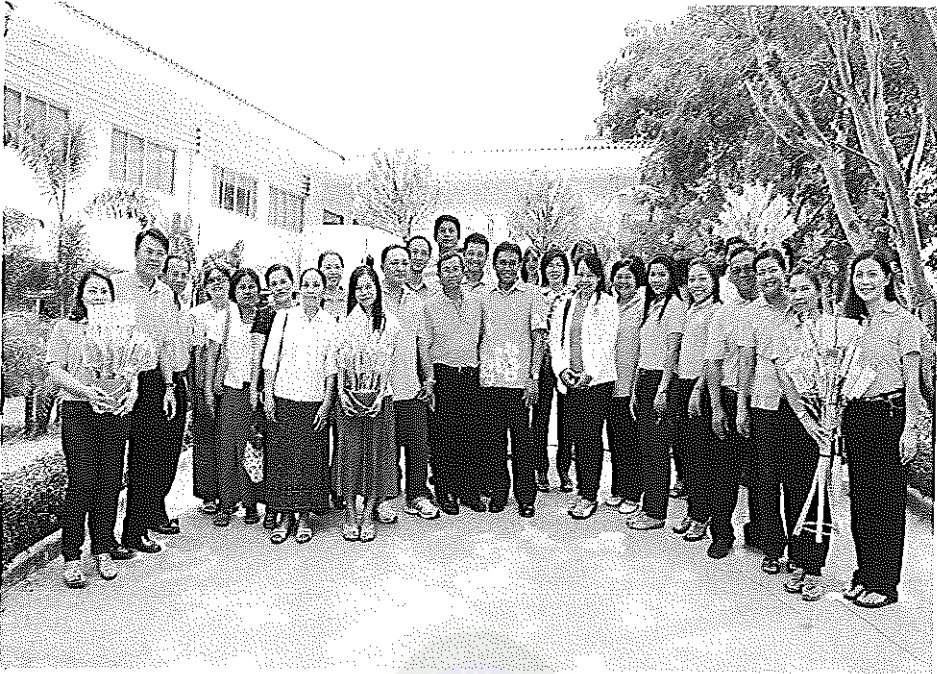
ภาพภาคผนวกที่ 5 การระดมทุนของโรงเรียนท่าขนอยางพิทยาคม