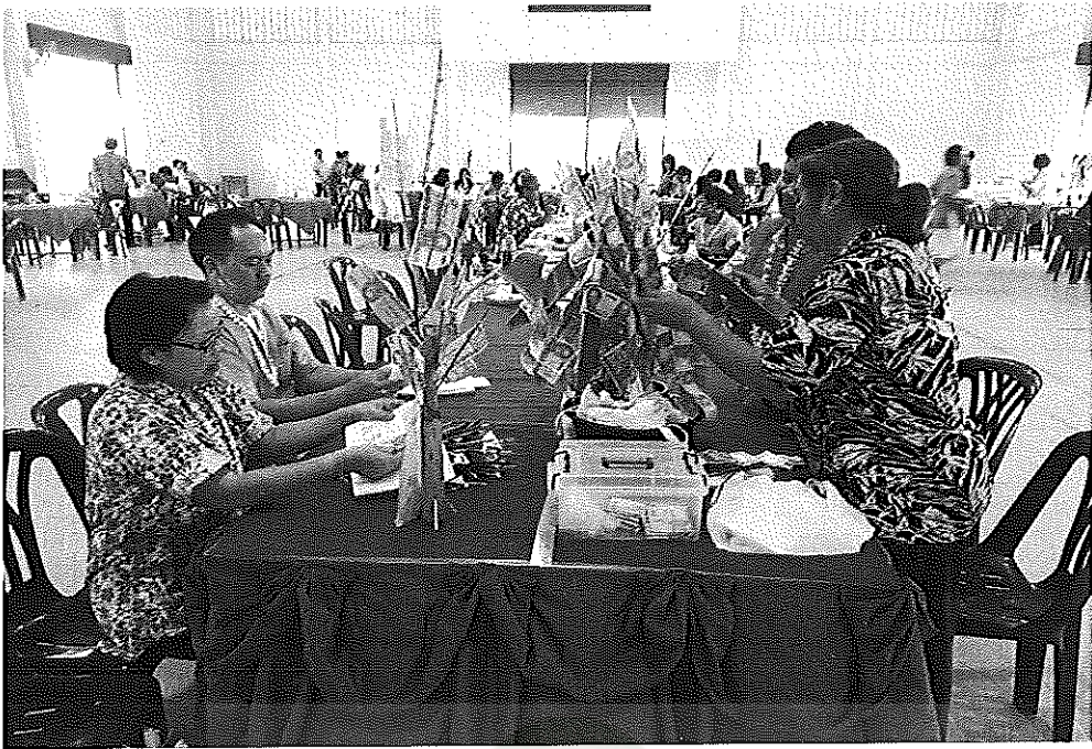
ภาพภาคผนวกที่ 11 การระดมทุนของโรงเรียนโคกก่อพิทยาคม