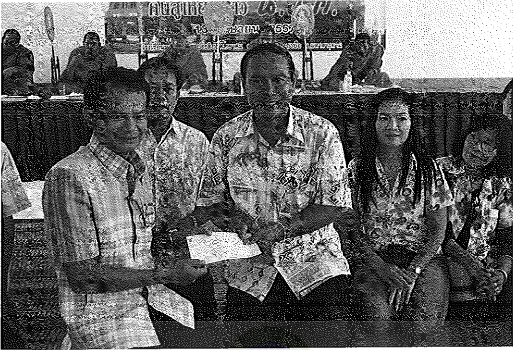
ภาพภาคผนวกที่ 9 การระดมทุนของโรงเรียนหนองโกวิชาประสิทธิ์พิทยาคม