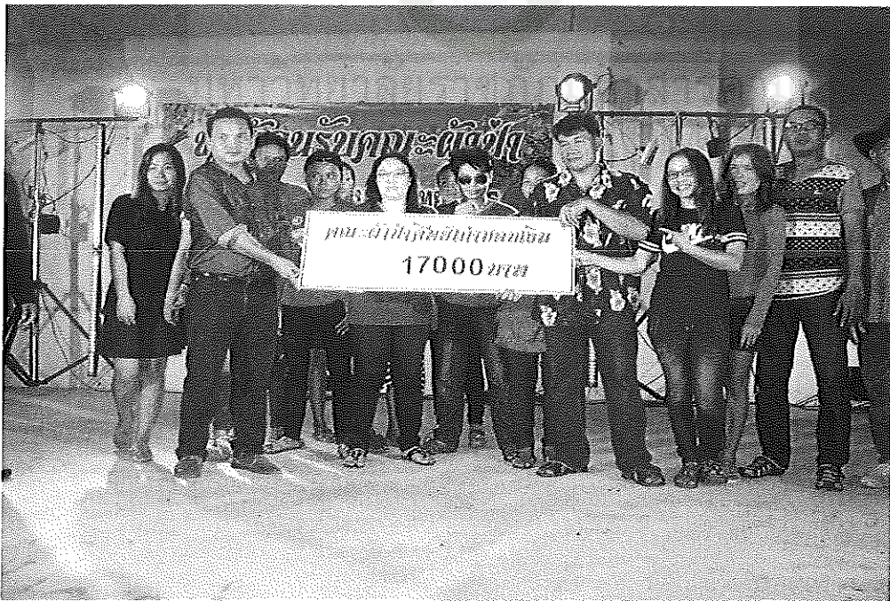
ภาพภาคผนวกที่ 18 การระดมทุนของโรงเรียนคอนเงินพิทยาคาร