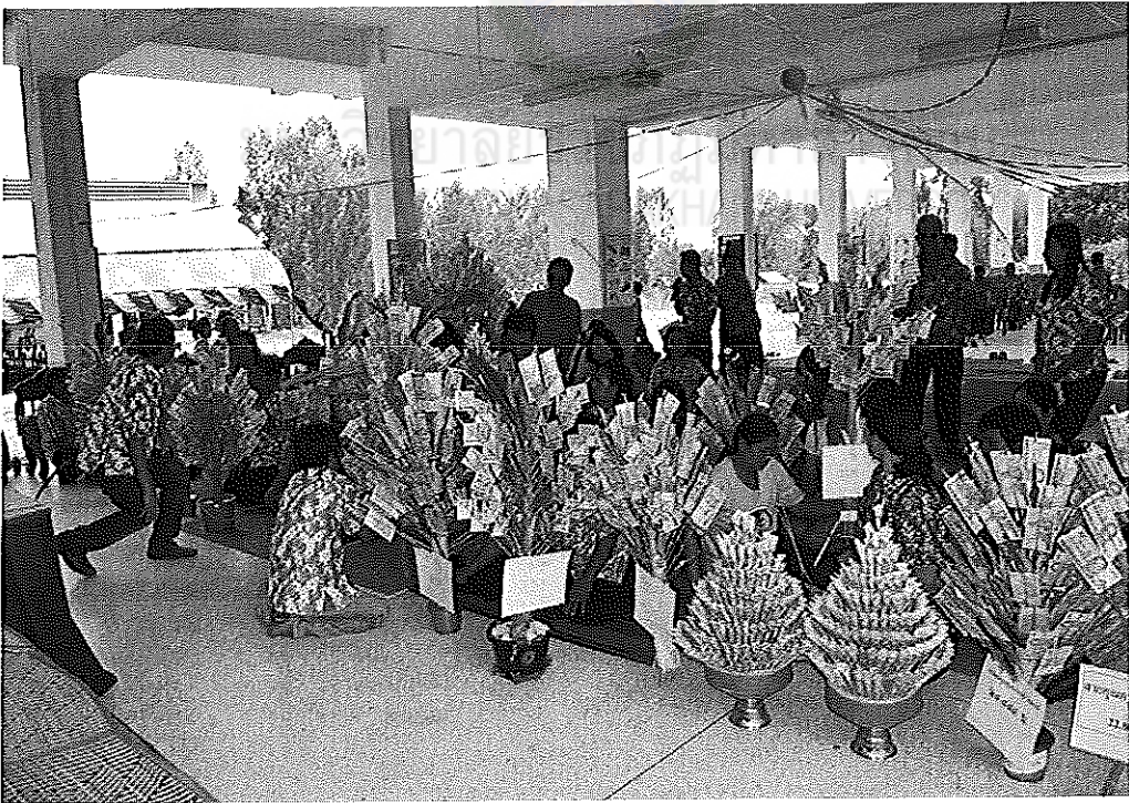
ภาพภาคผนวกที่ 10 การระดมทุนของโรงเรียนหนองโกวิชาประสิทธิ์พิทยาคม