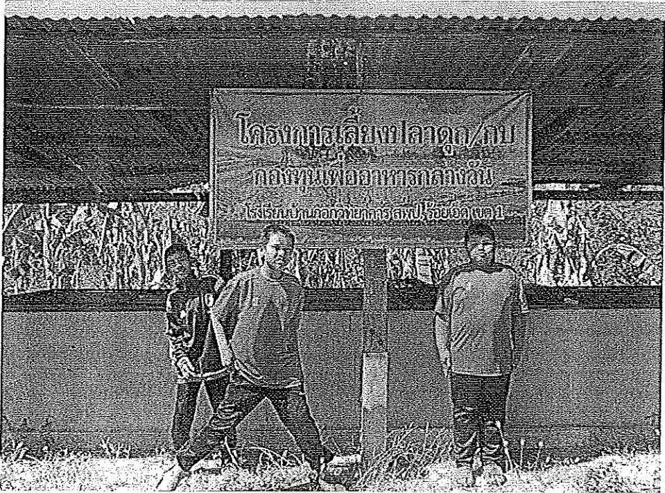
ภาพที่ 9 การเลี้ยงปลาตู้