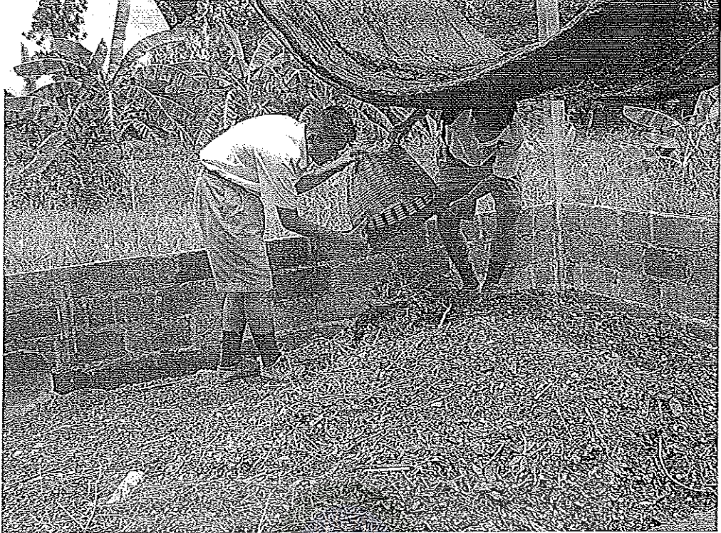
ภาพที่ 7 การทำปุ๋ยหมัก