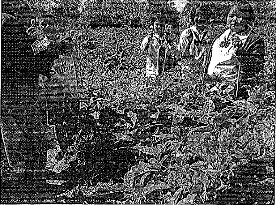
ภาพที่ 11 การปลูกผักปลอดสารพิษ