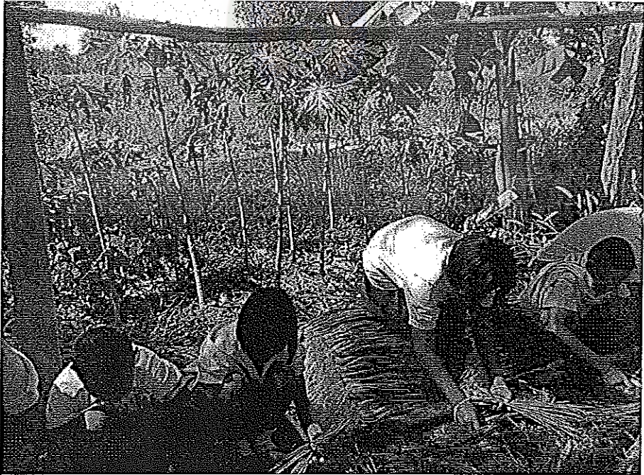
ภาพที่ 12 การปลูกผักปลอดสารพิษ