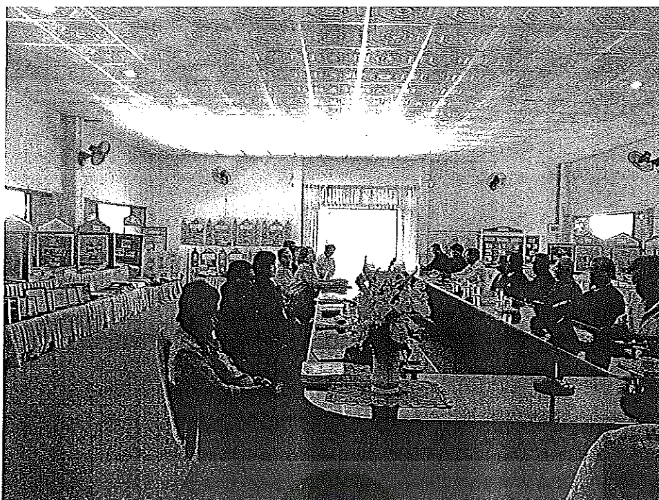
ผู้เข้าร่วมสนทนากลุ่มอภิปรายตามประเด็นอย่างหลากหลาย