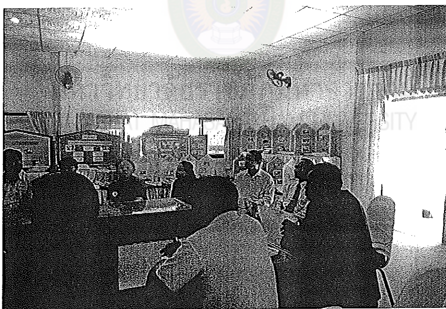
บรรยายการสนทนากลุ่ม