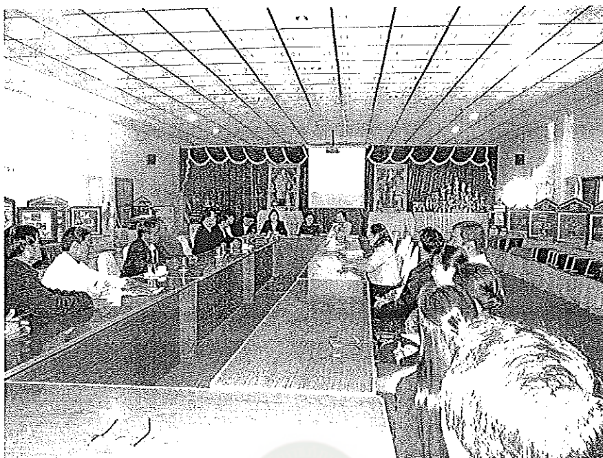
ผู้วิจัยนำเสนอผลการวิจัยที่ได้จากแบบสอบถาม