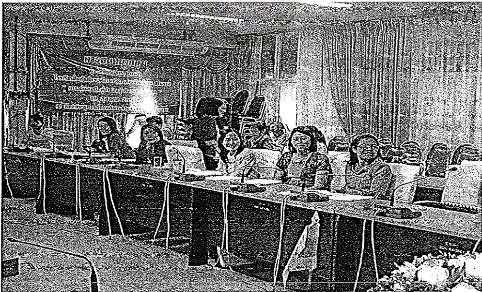
ภาพภาคผนวกที่ 4 การสนทนากลุ่มผู้บริหาร และครูผู้สอน โรงเรียนในสังกัดองค์การบริหาร ส่วนจังหวัดมหาสารคาม วันที่ 7 พฤศจิกายน 2557