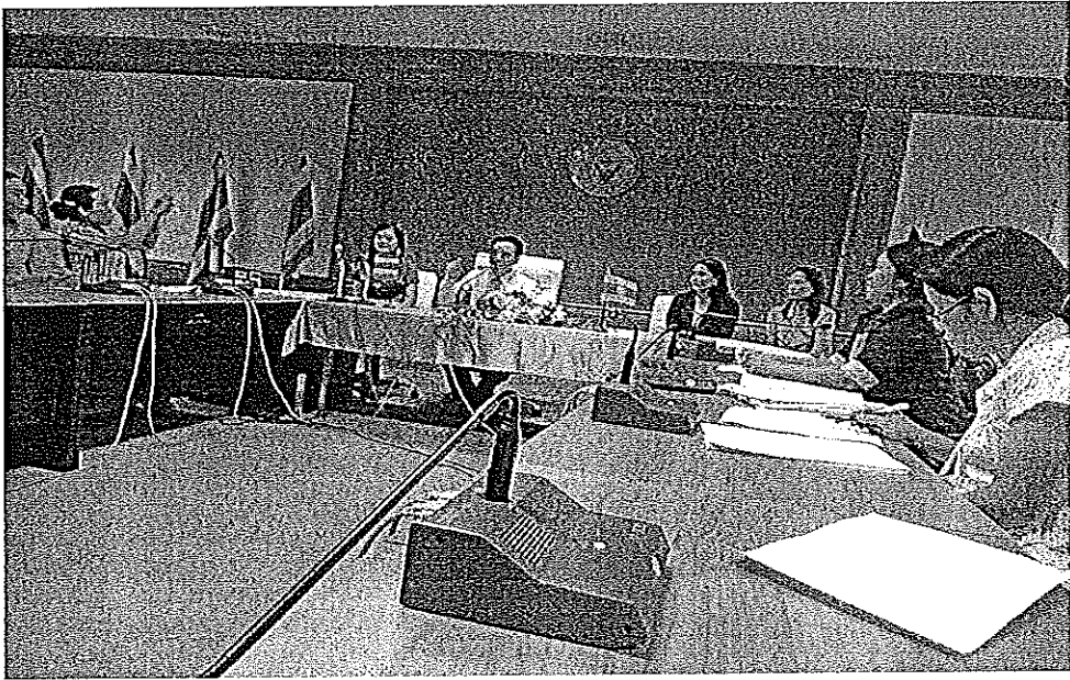
ภาพภาคผนวกที่ 1 การสนทนากลุ่มผู้บริหาร และครูผู้สอน โรงเรียนในสังกัดองค์การบริหาร ส่วนจังหวัดมหาสารคาม วันที่ 7 พฤศจิกายน 2557