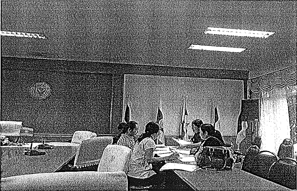
ภาพภาคผนวกที่ 3 การสนทนากลุ่มผู้บริหาร และครูผู้สอน โรงเรียนในสังกัดองค์การบริหาร ส่วนจังหวัดมหาสารคาม วันที่ 7 พฤศจิกายน 2557