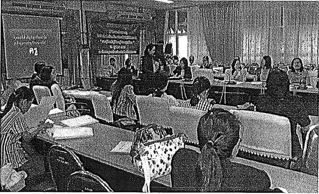
ภาพภาคผนวกที่ 5 การสนทนากลุ่มผู้บริหาร และครูผู้สอน โรงเรียนในสังกัดองค์การบริหาร ส่วนจังหวัดมหาสารคาม วันที่ 7 พฤศจิกายน 2557