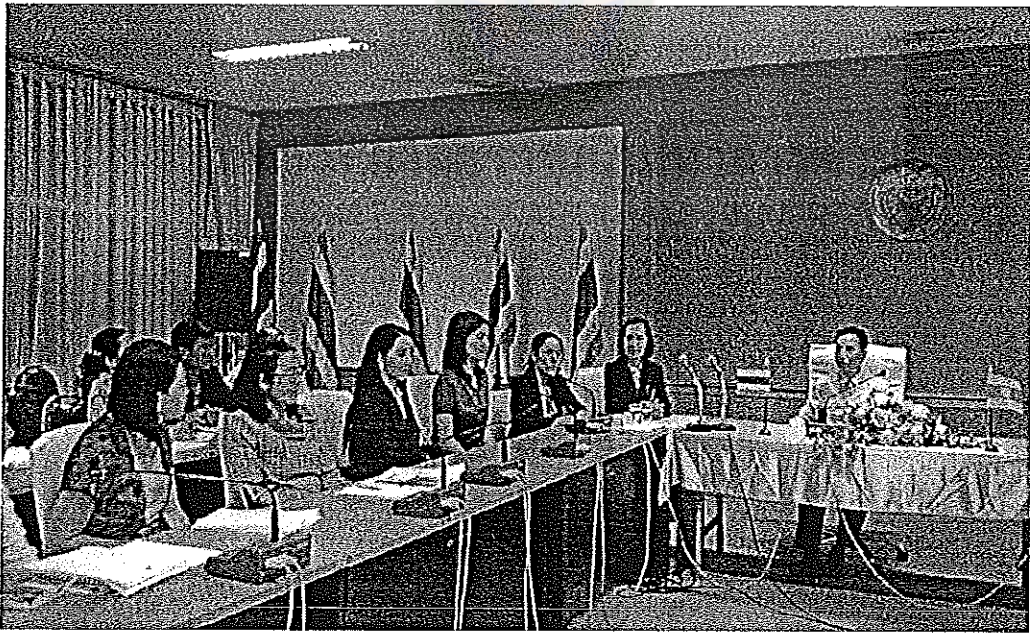
ภาพภาคผนวกที่ 6 การสนทนากลุ่มผู้บริหาร และครูผู้สอน โรงเรียนในสังกัดองค์การบริหาร ส่วนจังหวัดมหาสารคาม วันที่ 7 พฤศจิกายน 2557