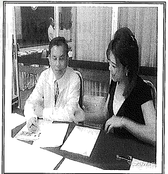
ภาพภาคผนวกที่ 2 แสดงการสัมภาษณ์ความพึงพอใจของบุคลากรสายสนับสนุน