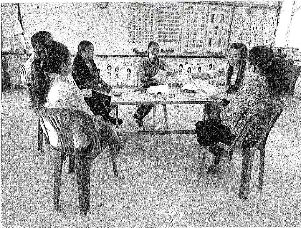
ภาพภาคผนวกที่ 2 อธิบายสภาพการบริหารหลักสูตรสถานศึกษาปฐมวัย