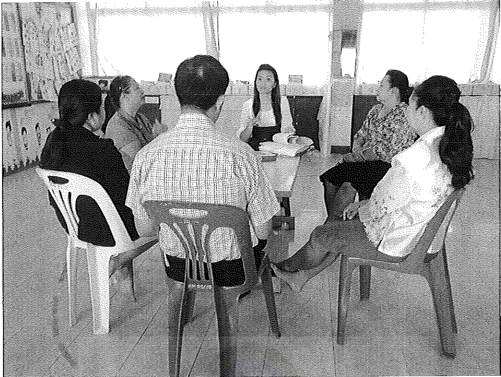
ภาพภาคผนวกที่ 3 สรุปผลการประชุมกลุ่มผู้ร่วมวิจัย