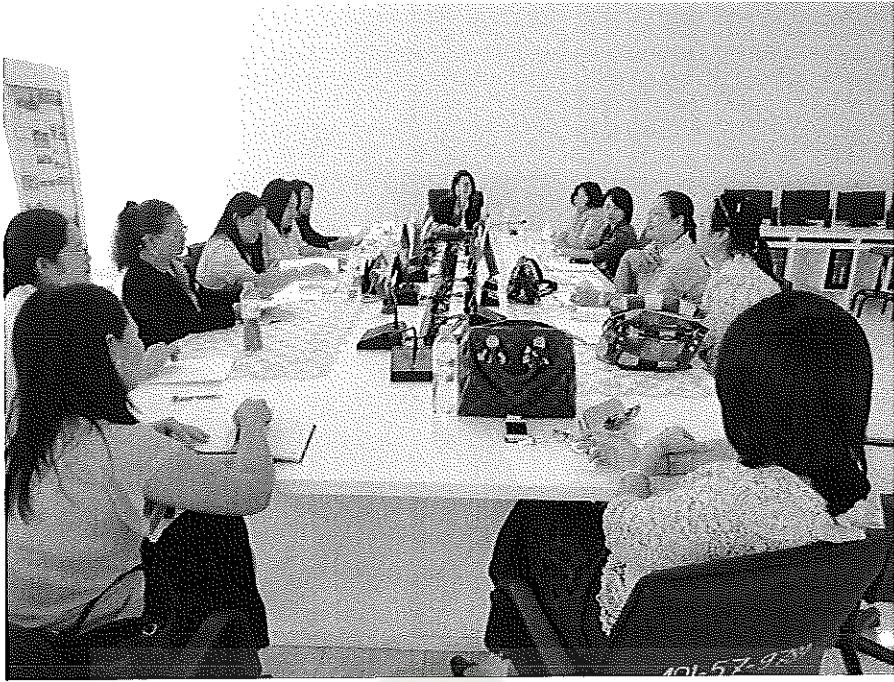
ภาพภาคผนวกที่ 7 บรรณาธิการสนทนากลุ่ม ผู้ร่วมสนทนาให้ความร่วมมือในการให้ข้อมูล