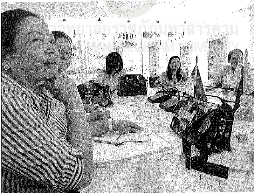
ภาพภาคผนวกที่ 10 ผู้ร่วมสนทนาร่วมแสดงความคิดเห็นเกี่ยวกับการนำข้อมูลเพื่อจัดทำร่าง หลักสูตรสถานศึกษาปฐมวัยเตรียมความพร้อมสู่ประชาคมอาเซียน