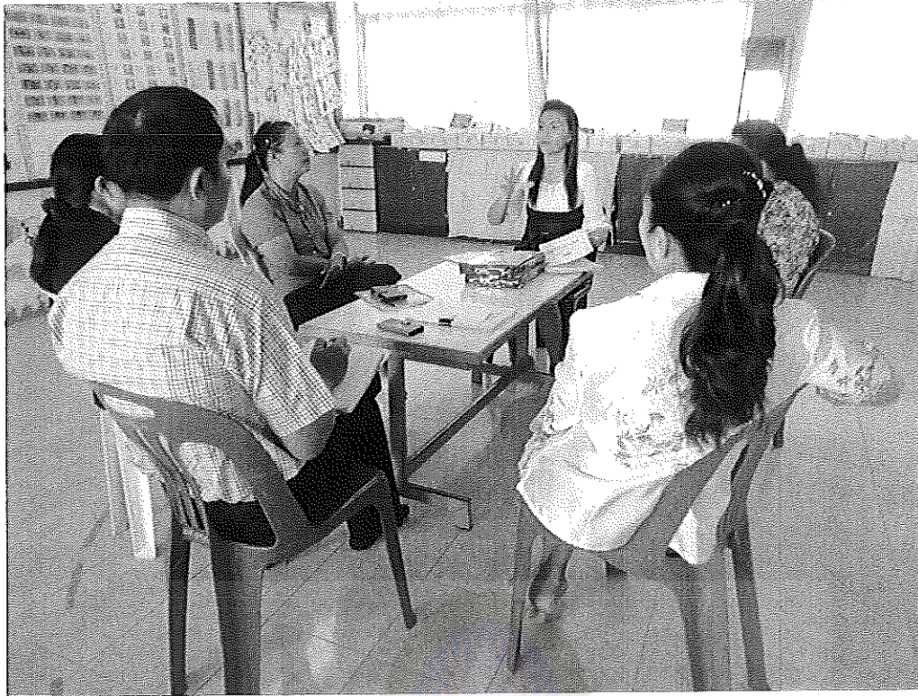
ภาพภาคผนวกที่ 1 ศึกษาเอกสารเกี่ยวกับวาระการประชุม