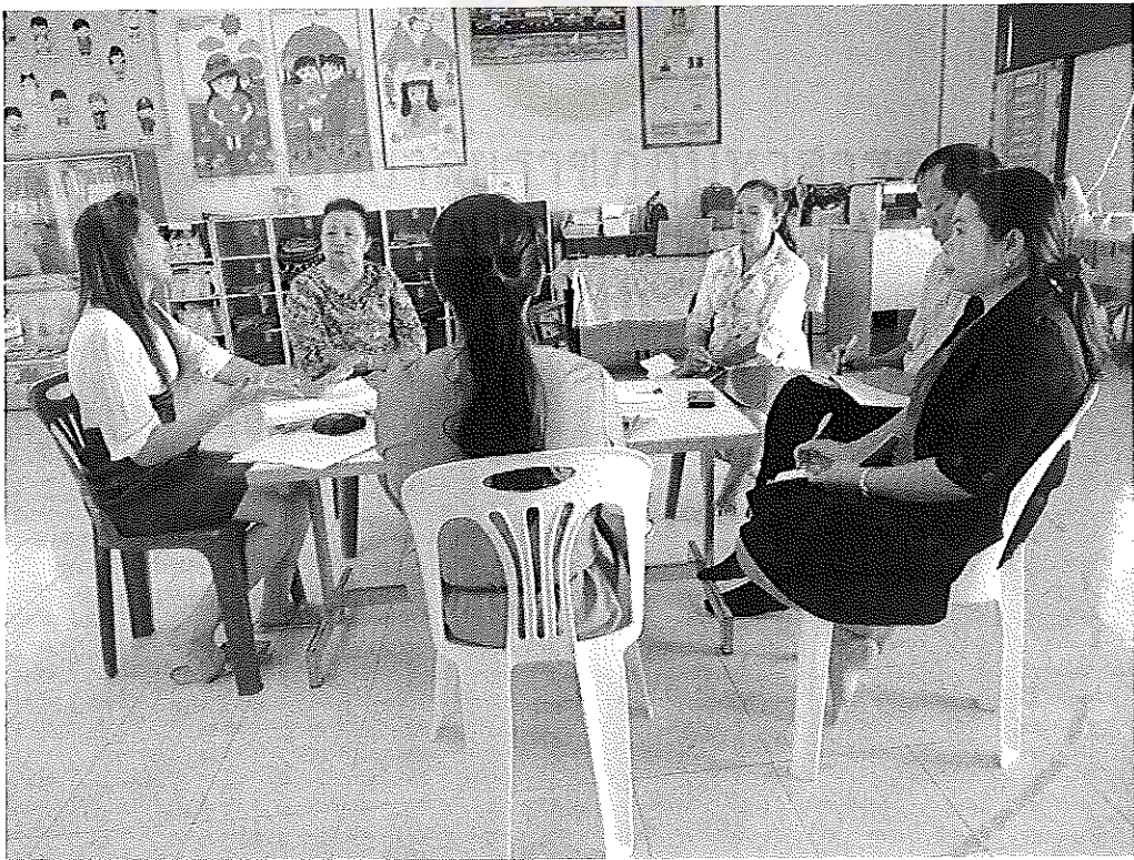
ภาพภาคผนวกที่ 4 ลงมติเกี่ยวกับสภาพการบริการหลักสูตรสถานศึกษาปฐมวัย