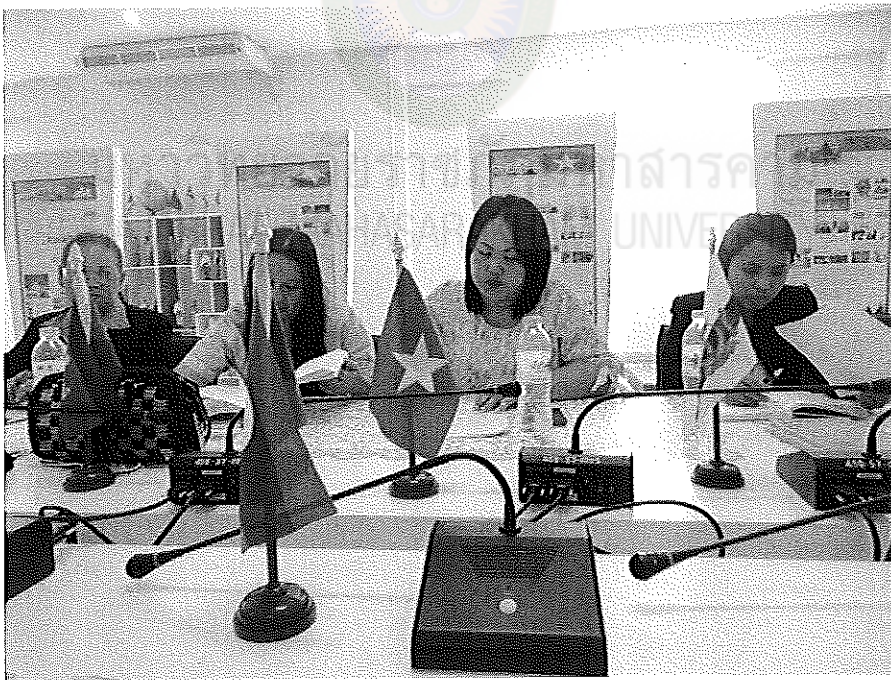
ภาพภาคผนวกที่ 8 ผู้ร่วมสนทนากลุ่มศึกษาเอกสารประกอบการสนทนา