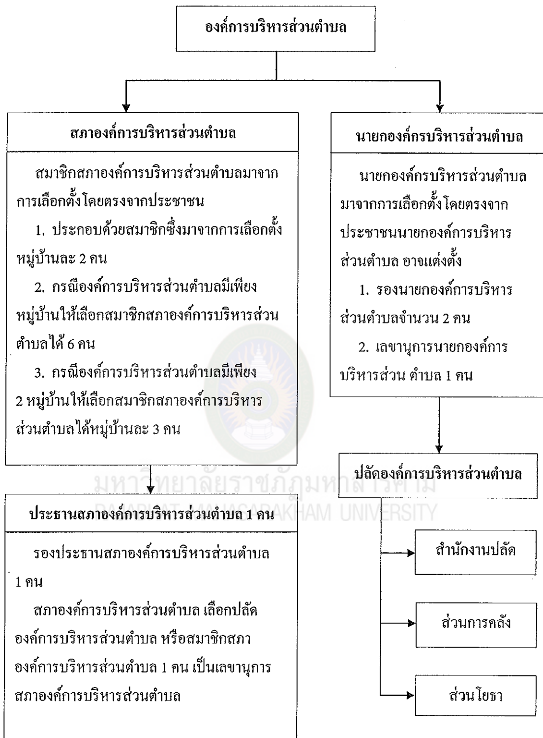
แผนภาพที่ 1 โครงสร้างการบริหารงานองค์การบริหารส่วนตำบล ที่มา : กรมส่งเสริมการปกครองท้องถิ่น (2547 : 40)