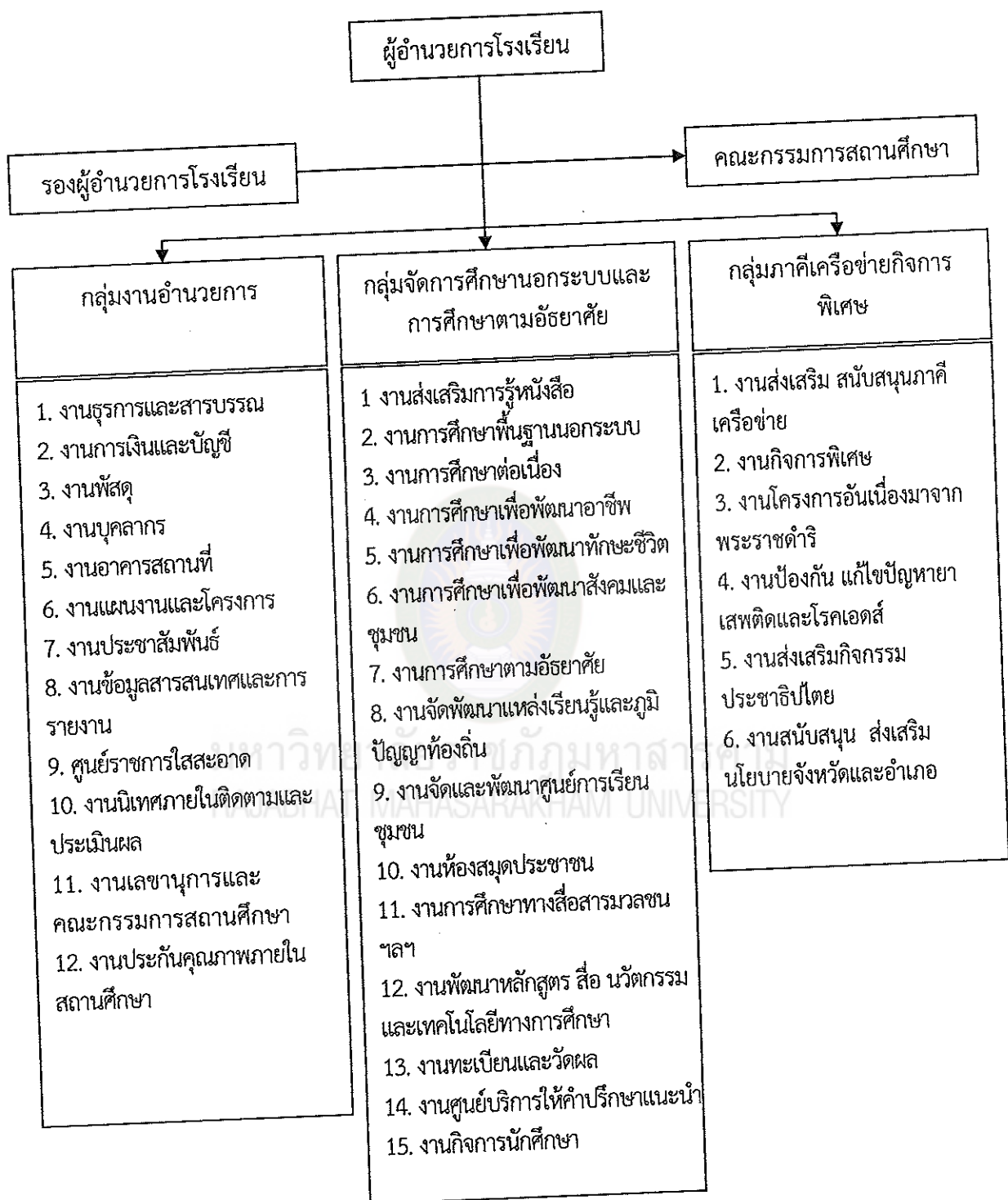
แผนภาพที่ 3 โครงสร้างการบริหารงานศูนย์การศึกษานอกระบบและการศึกษาตามอัธยาศัย อำเภออย่างตลาด