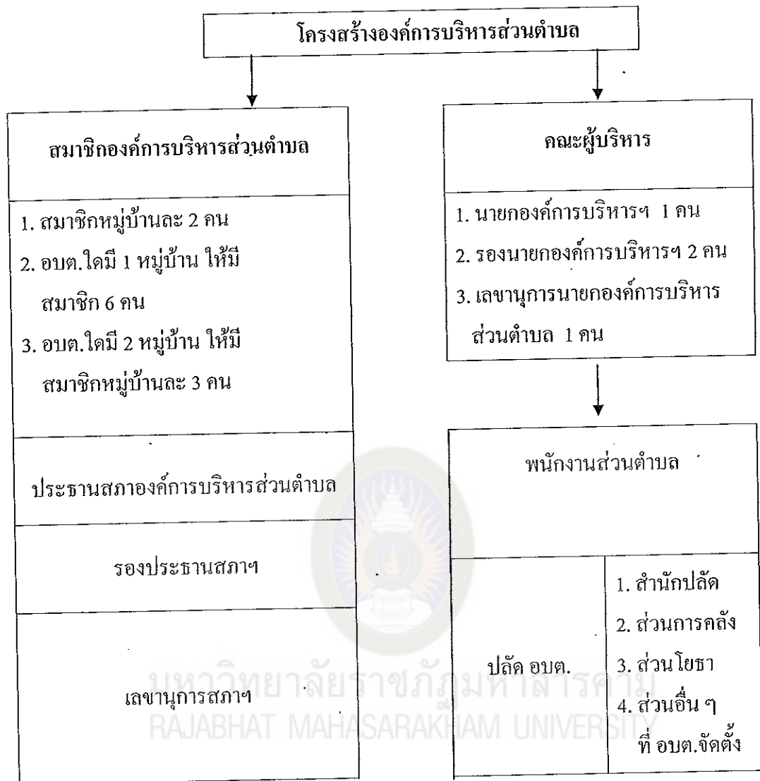
แผนภาพที่ 2 โครงสร้างองค์การบริหารส่วนตำบล