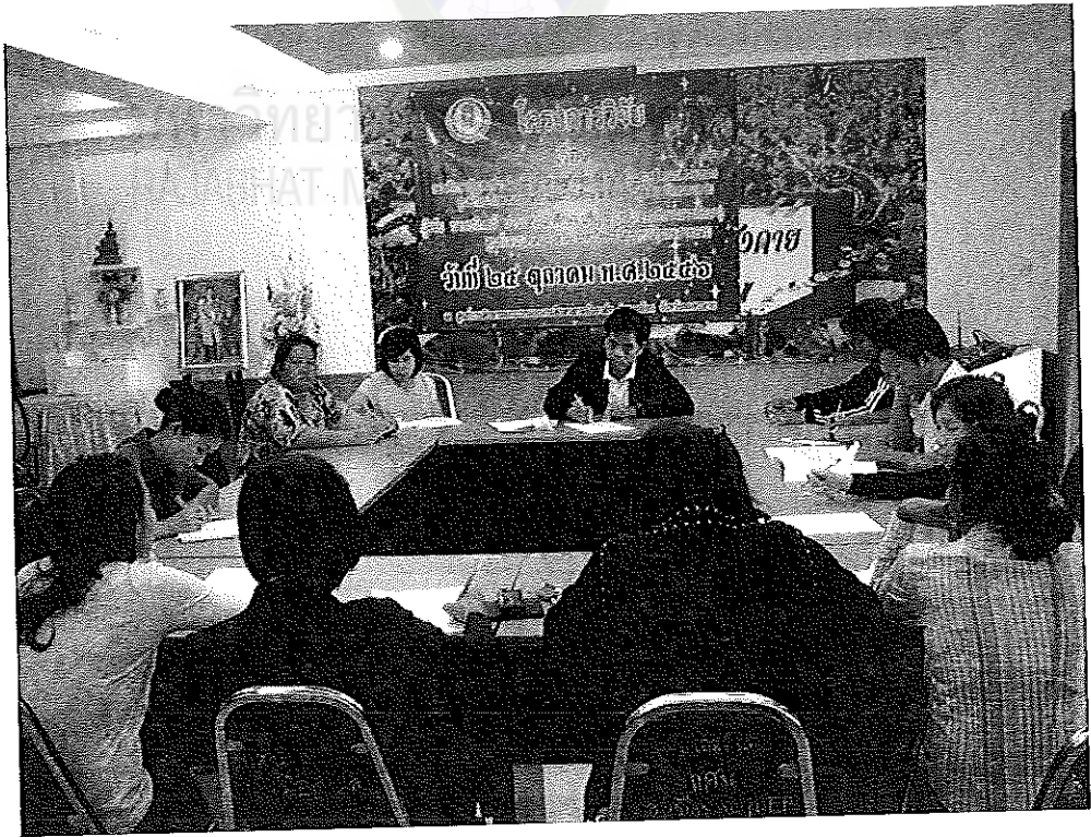
ภาพภาคผนวกที่ 4 การสนทนากลุ่มของผู้ทรงคุณวุฒิ