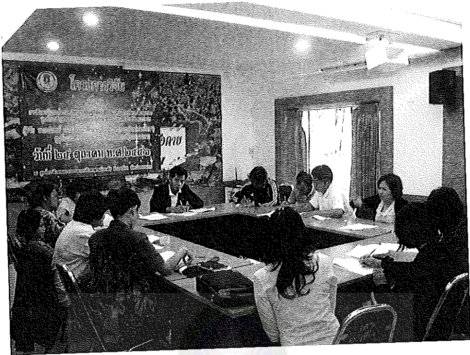
ภาพภาคผนวกที่ 1 การสนทนากลุ่มของผู้ทรงคุณวุฒิ