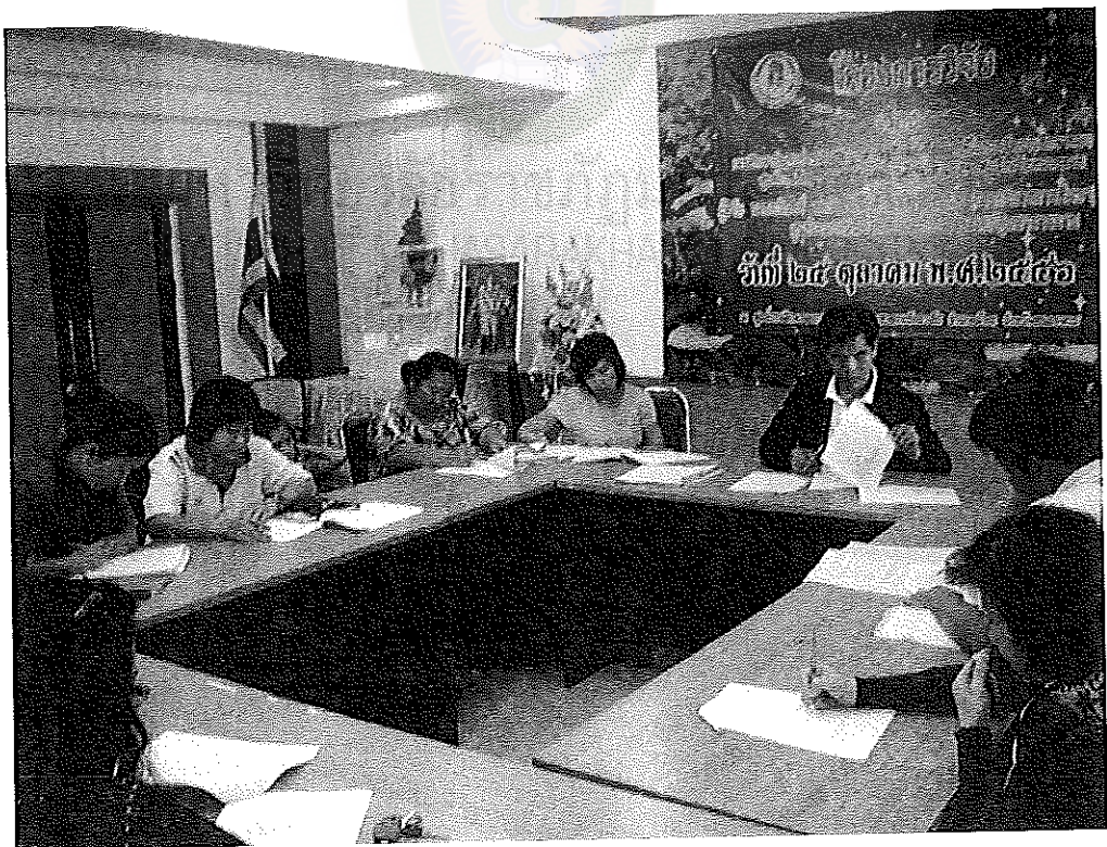
ภาพภาคผนวกที่ 5 การสนทนากลุ่มของผู้ทรงคุณวุฒิ