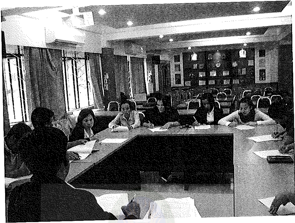
ภาพภาคผนวกที่ 3 การสนทนากลุ่มของผู้ทรงคุณวุฒิ