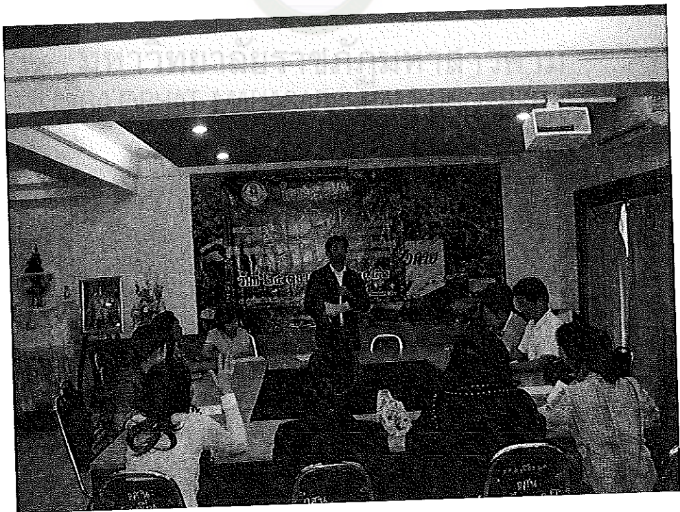
ภาพภาคผนวกที่ 2 การสนทนากลุ่มของผู้ทรงคุณวุฒิ