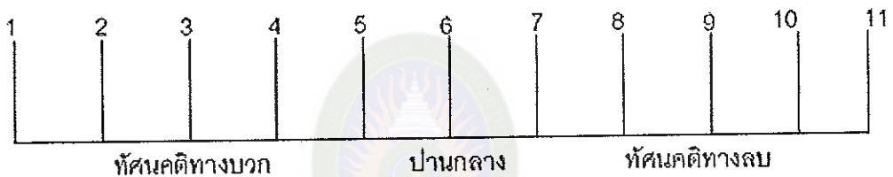
แผนภาพที่ 2 สเกลของเทอร์สโตน

1. สเกลของเทอร์สโตน (The Thurstone Scale) สเกลนี้สร้างโดย หลุยส์เทอร์สโตน (Louis Thurstone) ในปี ค.ศ. 1928 มีทั้งหมด 11 ระดับความรู้สึก ดังนี้