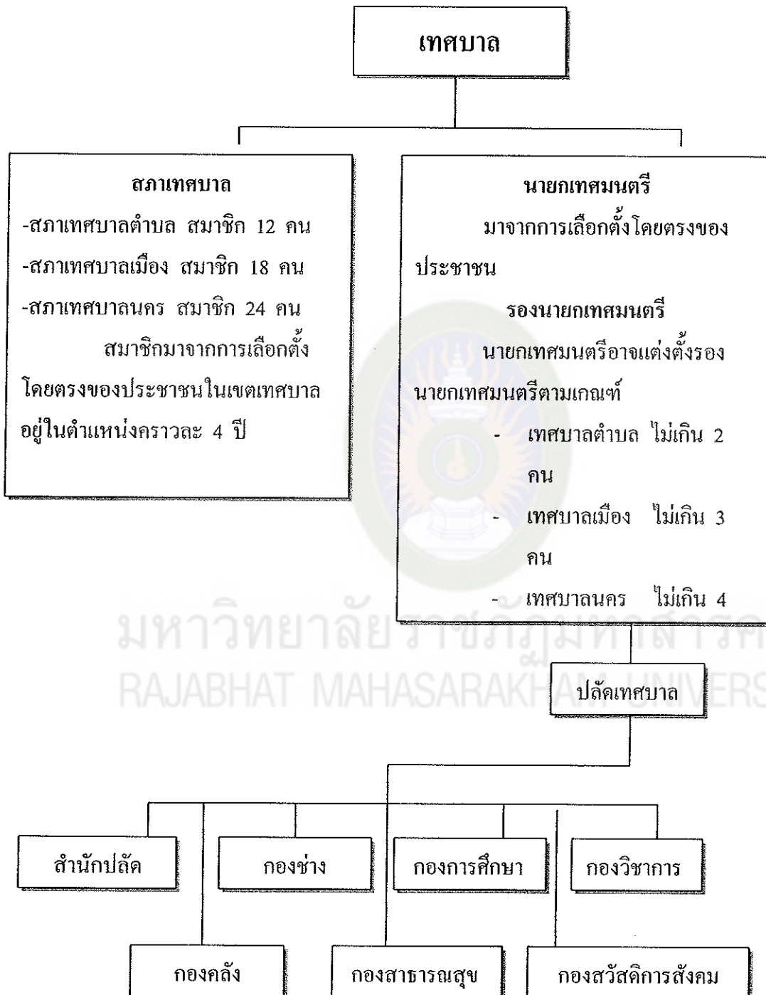
แผนภาพที่ 1 โครงสร้างของเทศบาล

ที่มา : ดัดแปลงจากพระราชบัญญัติเทศบาล พ.ศ. 2496 แก้ไขเพิ่มเติม (ฉบับที่ 12) พ.ศ. 2546