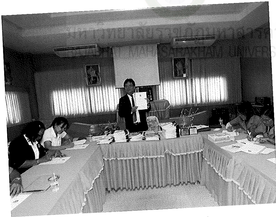
ภาพภาคผนวกที่ 2 ภาพการวิพากษ์หลักสูตรฝึกอบรม