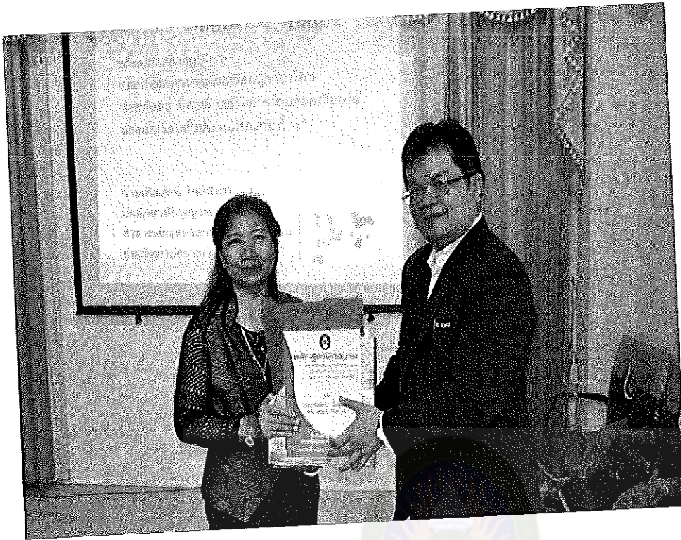
ภาพภาคผนวกที่ 3 ภาพการอบรมเชิงปฏิบัติการ