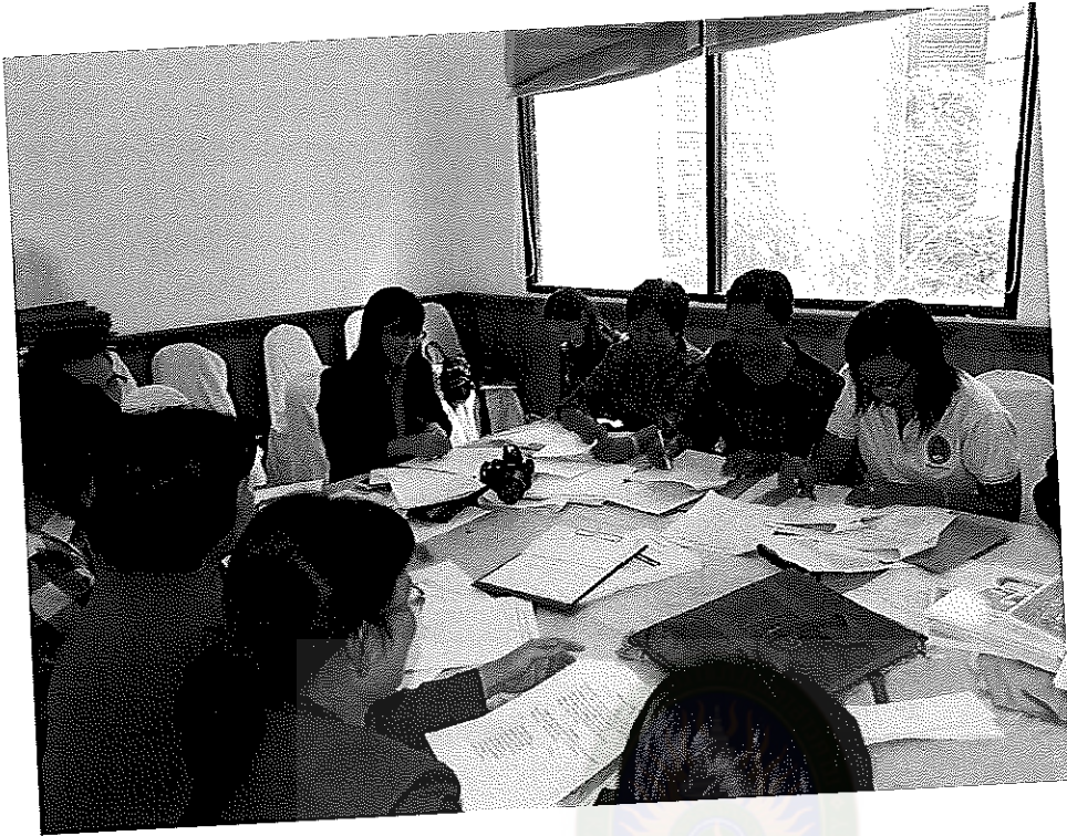
ภาพภาคผนวกที่ 1 ภาพการจัดสนทนากลุ่ม