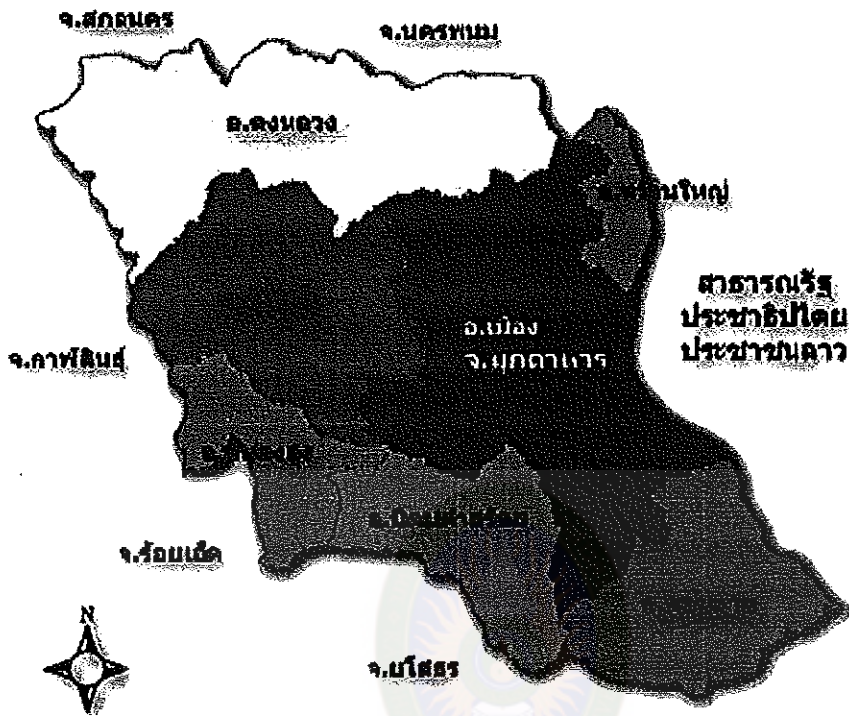
ภาพที่ 2 แผนที่จังหวัดมุกดาหาร (แผนที่ทั่วไป : จังหวัดมุกดาหาร, 2553)