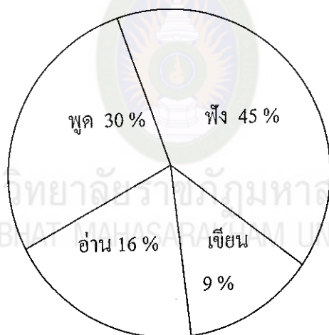
แผนภาพที่ 1 แสดงเปอร์เซ็นต์ของทักษะทางภาษาที่ใช้ในวัน

วันทิพย์ สิ้นสูงสุด (2535 : 6) อ้างถึงการศึกษานของสมาคมโสตทัศนูปกรณ์ แสดงให้เห็นทักษะสำคัญ ๆ นั้น การฟังเป็นทักษะแนวหน้าที่ต้องทำมากที่สุด ตัวเลขแสดงว่าในชั่วโมงทำงานคนเราฟัง 45 เปอร์เซ็นต์ พูด 30 เปอร์เซ็นต์ อ่าน 16 เปอร์เซ็นต์ และเขียน 9 เปอร์เซ็นต์ของเวลาทำงานในวันหนึ่ง ๆ เท่านั้น ซึ่งแสดงให้เห็นได้ดังแผนภาพที่ 1