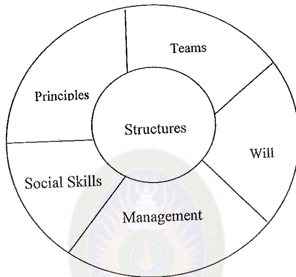
แผนภูมิที่ 2 แนวคิดหลักของการเรียนแบบร่วมมือ

ในเอเชีย แนวคิดหลักที่จะนำไปสู่การเรียนรู้แบบร่วมมืออย่างมีประสิทธิภาพ ประกอบด้วย 6 ประการ ดังแผนภูมิที่ 2