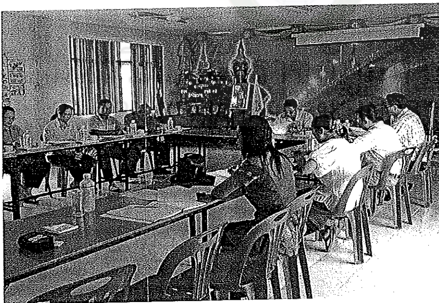
ภาพภาคผนวกที่ 2 การประชุมร่างยุทธศาสตร์การมีส่วนร่วมของชุมชน ต่อการบริหารจัดการศูนย์พัฒนาเด็กเล็กเทศบาลตำบลหาดคำ อำเภอเมือง จังหวัดหนองคาย ณ ห้องประชุมเทศบาลตำบลหาดคำ อำเภอเมือง จังหวัดหนองคาย