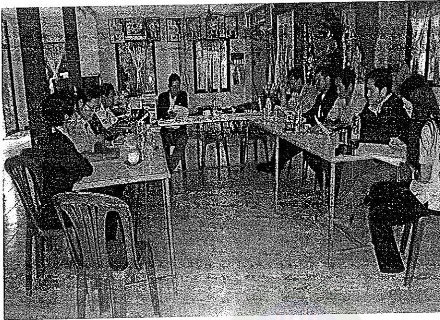
ภาพภาคผนวกที่ 1 การสนทนากลุ่ม ณ วัดเจริญสมณกิจ ตำบลหาดคำ อำเภอเมือง จังหวัดหนองคาย