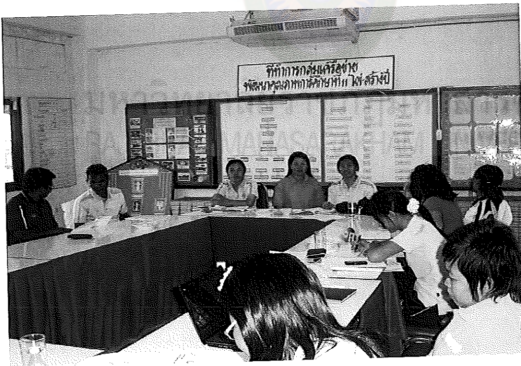
ภาพภาคผนวกที่ 2 การประชุมเชิงปฏิบัติการระบบดูแลช่วยเหลือนักเรียน