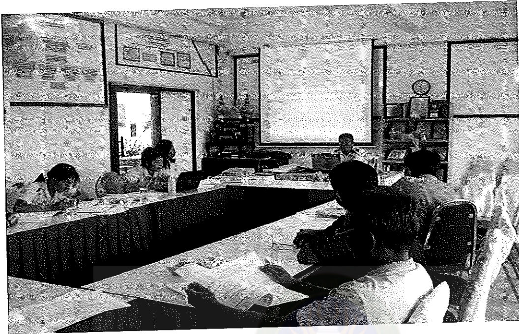
ภาพภาคผนวกที่ 3 วิทยากรให้ความรู้เรื่องระบบดูแลช่วยเหลือนักเรียน