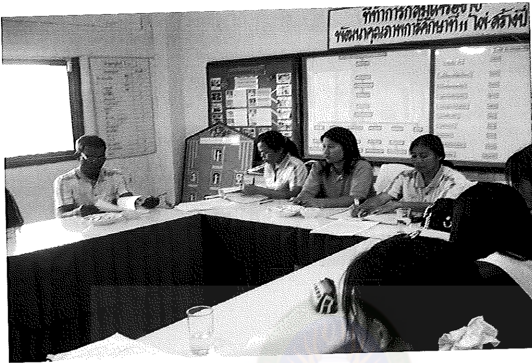
ภาพภาคผนวกที่ 1 การประชุมเพื่อศึกษาปัญหาตามระบบช่วยเหลือนักเรียน