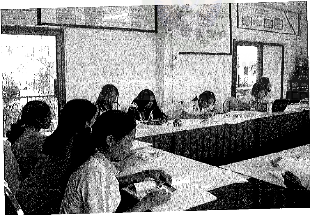
ภาพภาคผนวกที่ 4 กลุ่มผู้ร่วมวิจัยรับการนิเทศและฝึกปฏิบัติการคัดกรองนักเรียน