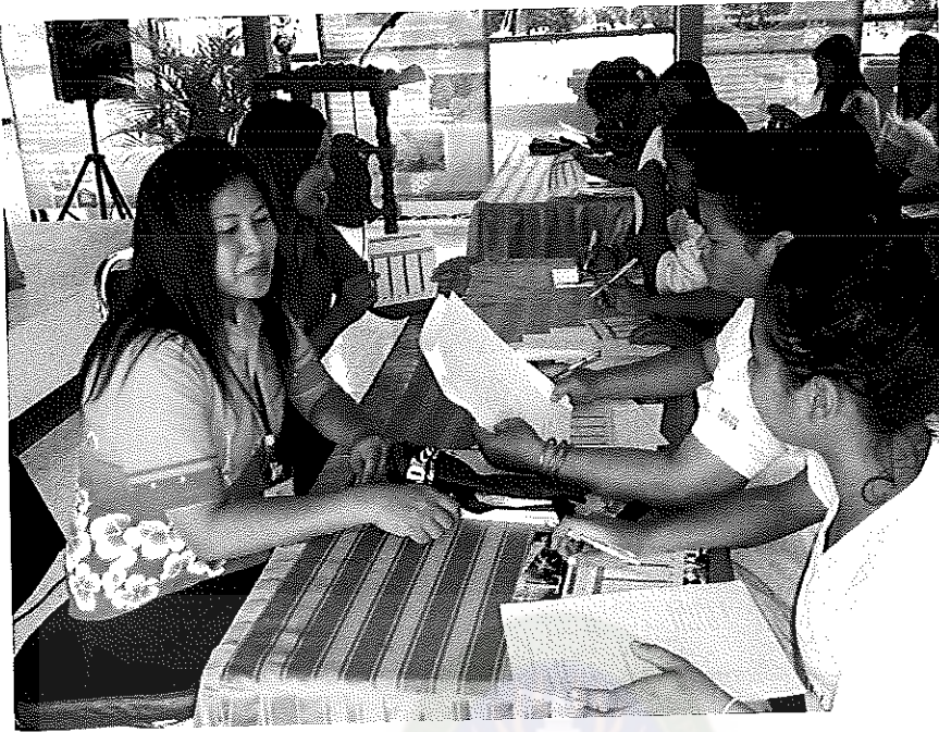
ภาพภาคผนวกที่ 3 สัมภาษณ์ประธานองค์กรนักศึกษา