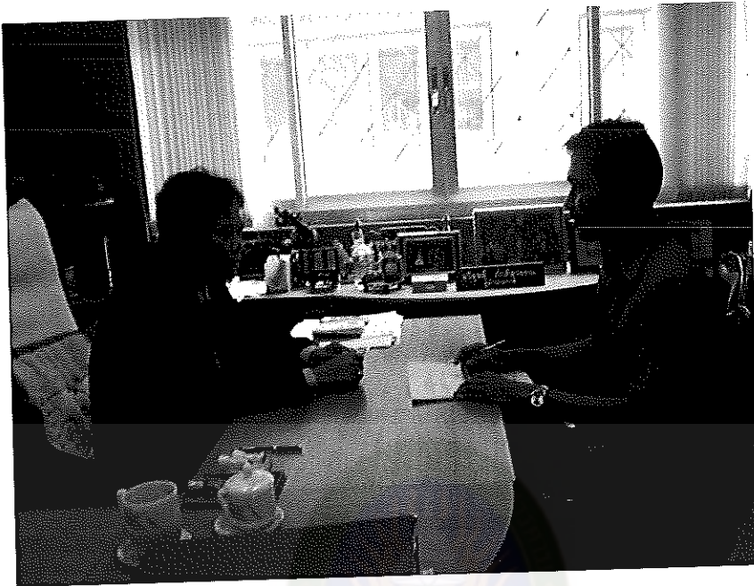
ภาพภาคผนวกที่ 1 สัมภาษณ์ประธานผู้บริหารสถานศึกษา