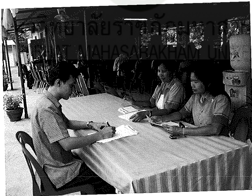
ภาพภาคผนวกที่ 2 สัมภาษณ์ประธานองค์กรครูผู้สอน