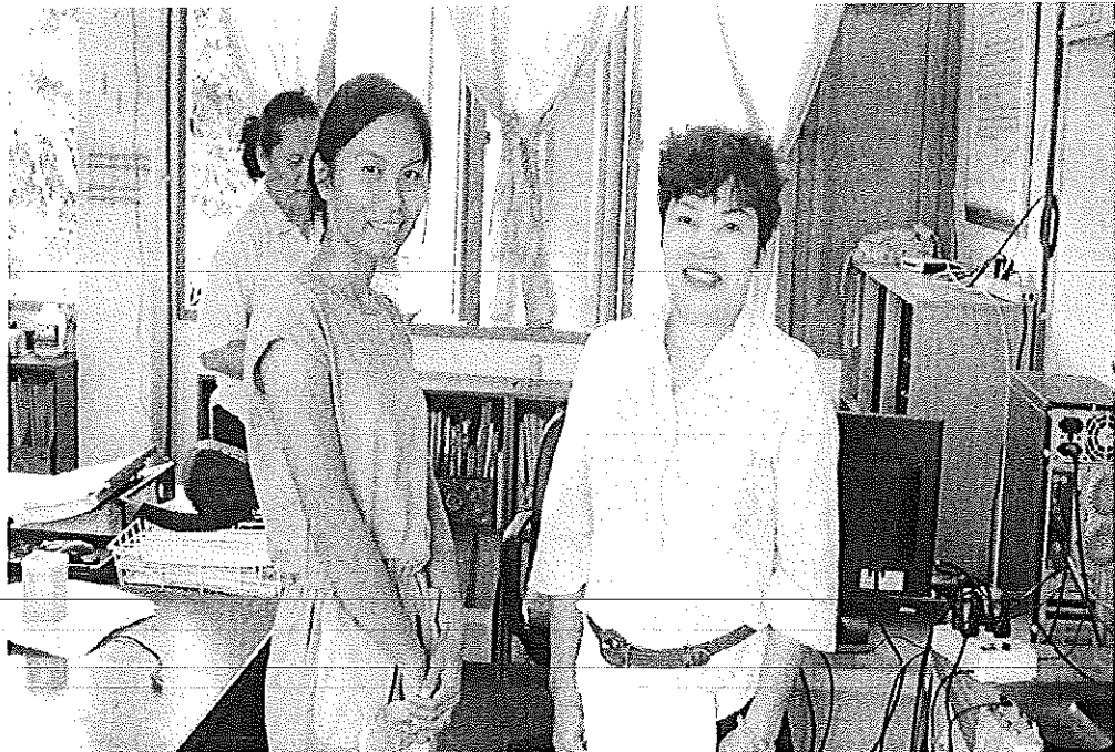
ผู้วิจัยแจกแบบสอบถามให้กับตัวแทนครู โรงเรียนบ้านคอกม้า อำเภอกันทรวิชัย

จังหวัดมหาสารคาม วันที่ 5 พฤศจิกายน 2555