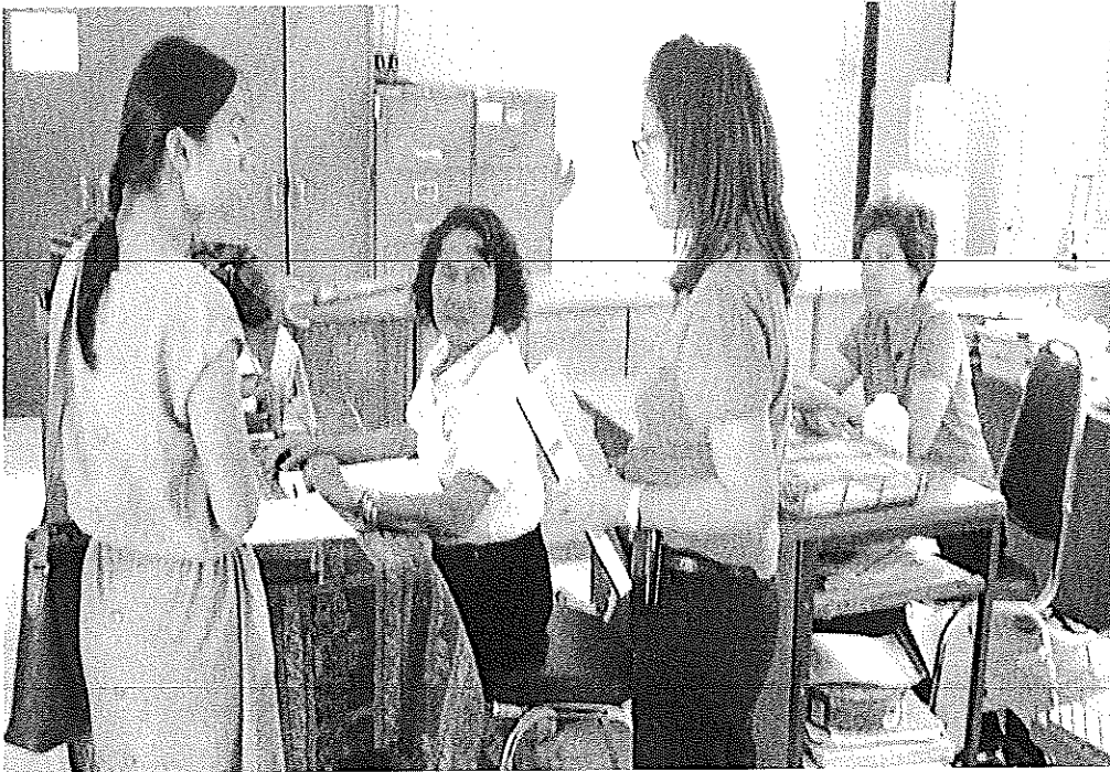
ผู้วิจัยแจกแบบสอบถามให้กับตัวแทนครู โรงเรียนท่าสองคอน อำเภอเมือง จังหวัดมหาสารคาม