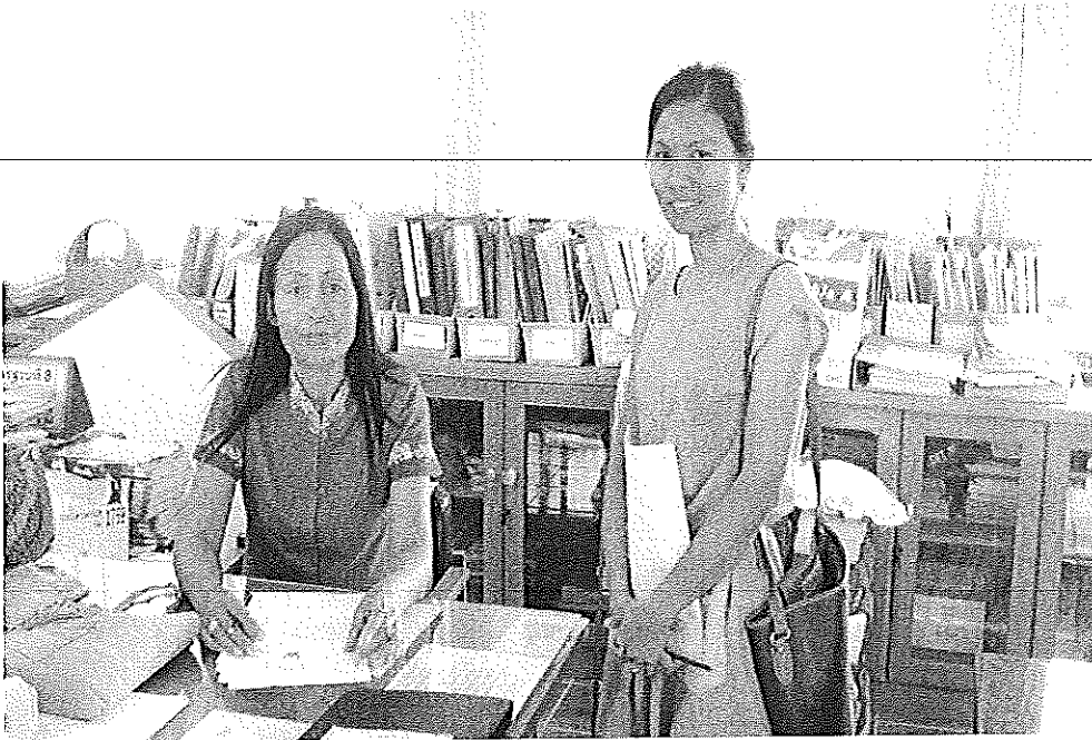
ผู้วิจัยแจกแบบสอบถามให้กับตัวแทนครูของโรงเรียนบ้าน โสภแดง อำเภอแกดำ จังหวัดมหาสารคาม วันที่ 5 พฤศจิกายน 2555