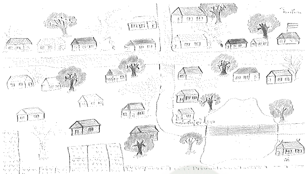
แผนภาพที่ 1 แสดงบริบทของชุมชนบ้านกุคแสง ตำบลวัฒนา อำเภอส่องดาว จังหวัดสกลนคร