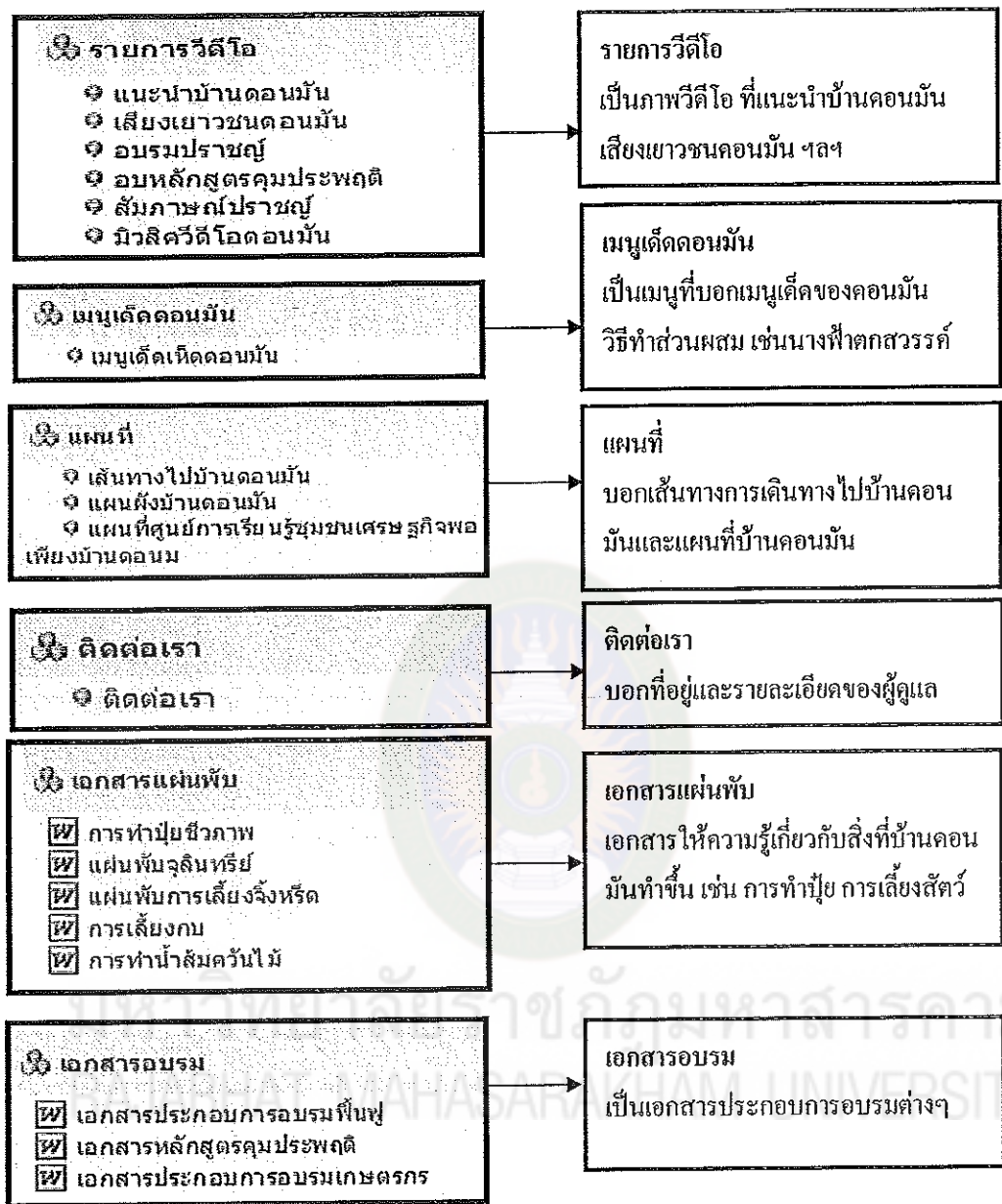
แผนภูมิที่ 4 (ต่อ)