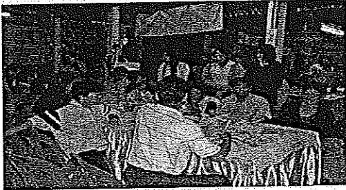
ระดมความคิดเห็นของชุมชนในการพัฒนาศูนย์การเรียนรู้ทางคณิตศาสตร์ที่บ้านดอนมัน

นักศึกษา ป.โท คณะศึกษาศาสตร์ มหาวิทยาลัยมหาสารคามร่วมประชุมกับชุมชน คณิตศาสตร์ มอช