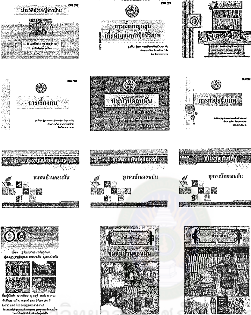
ภาพที่ 5 แสดงภาพตัวอย่างองค์ความรู้ของแหล่งการเรียนรู้ผ่านเครือข่ายอินเทอร์เน็ต

4. ผลการวิเคราะห์คุณภาพสื่อนำเสนอองค์ความรู้ในรูปแบบสื่ออิเล็กทรอนิกส์ของแหล่งการเรียนรู้ผ่านเครือข่ายอินเทอร์เน็ต กรณีศึกษา ชุมชนเศรษฐกิจพอเพียงบ้านดอนมัน ตำบลขามเรียง อำเภอกันทรวิชัย จังหวัดมหาสารคาม