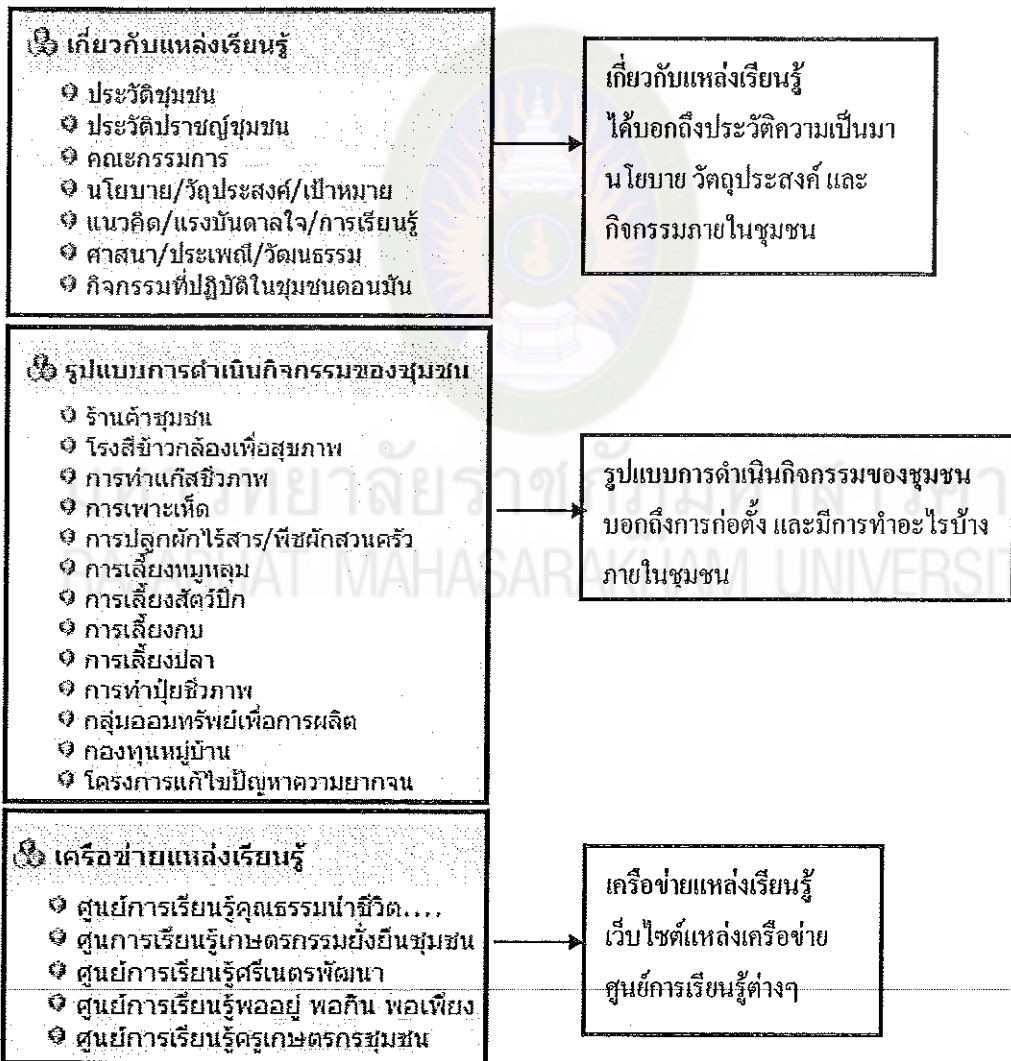
แผนภูมิที่ 4 แสดงส่วนด้านซ้ายของเว็บไซต์