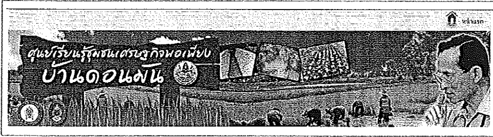
ภาพที่ 2 แสดงภาพส่วนบนของเว็บไซต์

1.1 ส่วนบนของเว็บไซต์จะเป็นหัวเว็บชื่อแหล่งการเรียนรู้ชุมชนเศรษฐกิจพอเพียงบ้านคอนมันตำบลขามเรียง อำเภอกันทรวิชัย จังหวัดมหาสารคาม