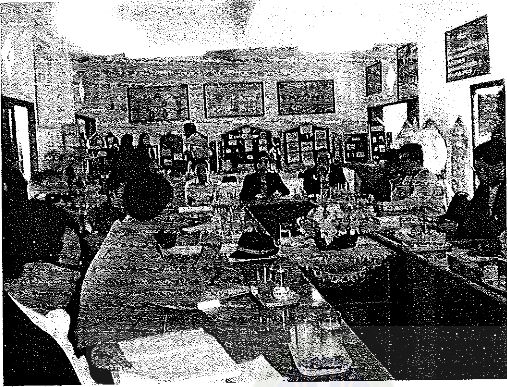
ภาพที่ 7 : กลุ่มผู้บริหารร่วมอภิปราย