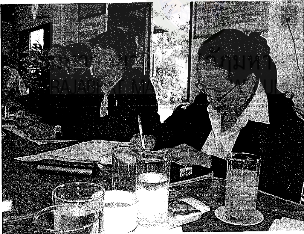
ภาพที่ 8 : กลุ่มผู้แทนครู