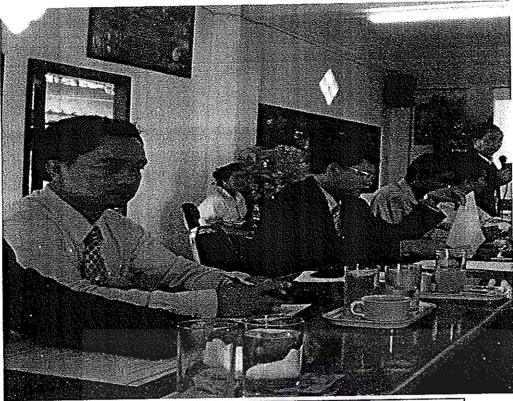
ภาพที่ 9 : ผู้แทนคณะกรรมการสถานศึกษาขั้นพื้นฐานร่วมอภิปราย