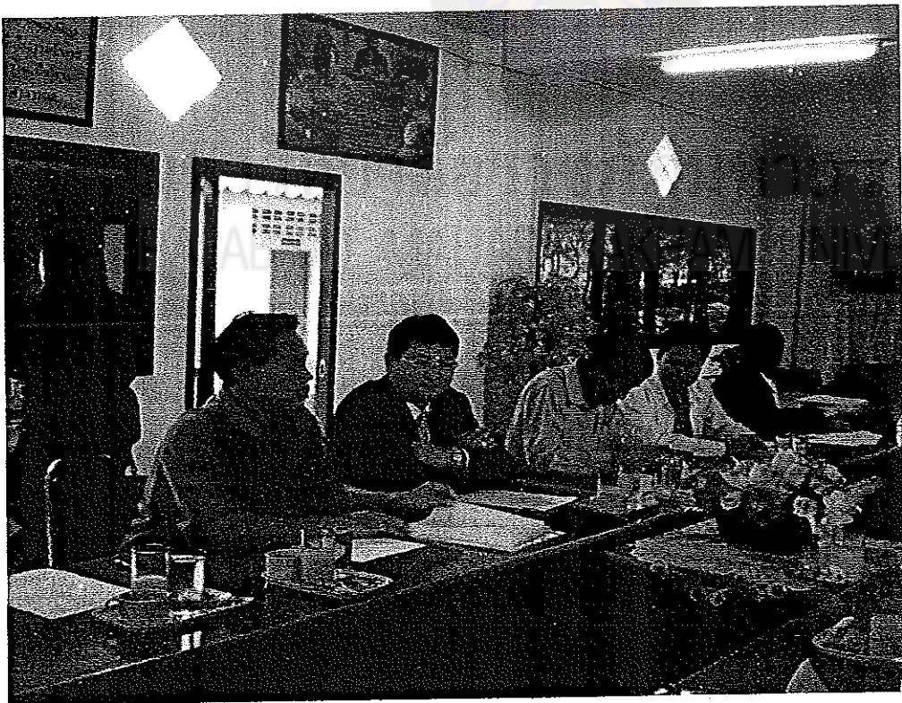
ภาพที่ 10 : กลุ่มผู้แทนครูกำลังปรึกษารื้อ