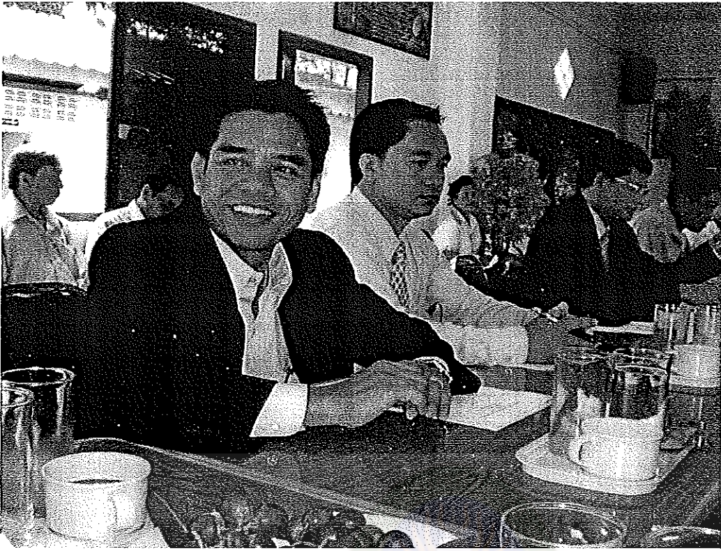
ภาพที่ 11 : ผู้ร่วมสนทนากลุ่มร่วมกันสรุป