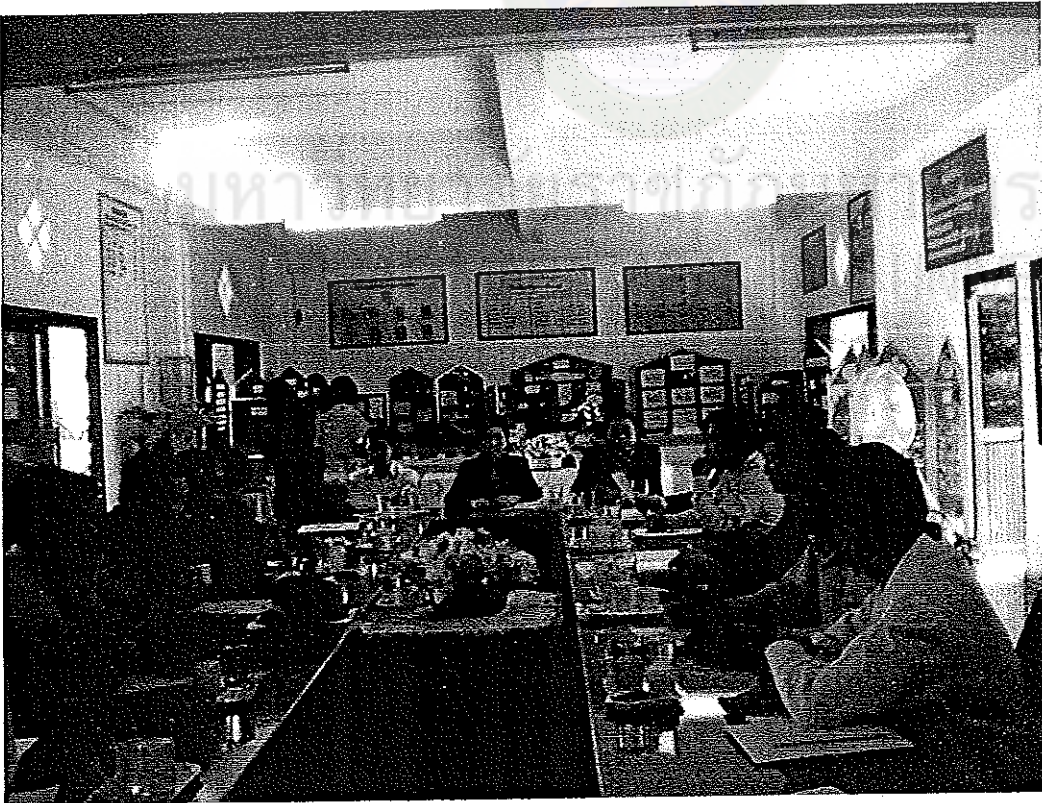
ภาพที่ 6 : กำลังดำเนินการสนทนากลุ่ม