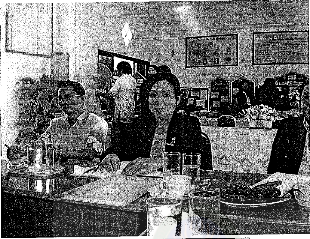
ภาพที่ 5 : ผู้ดำเนินการสนทนากลุ่ม