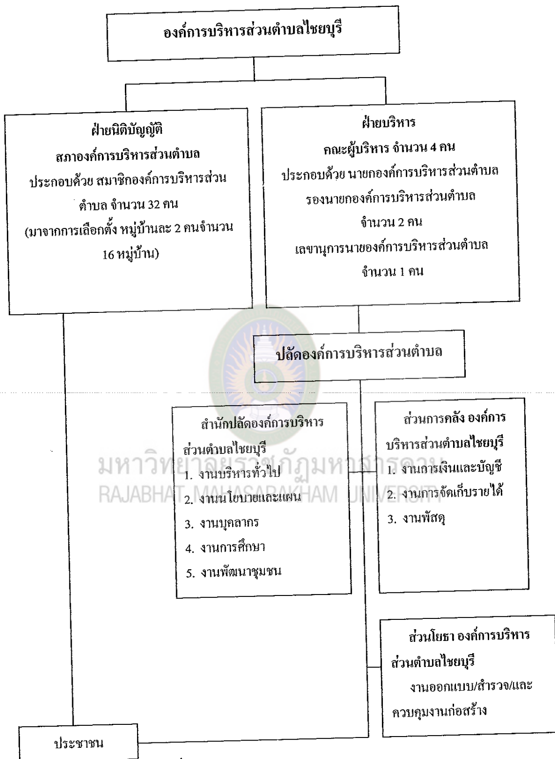
แผนภาพที่ 1 แสดงโครงสร้างและการแบ่งส่วนราชการองค์การบริหารส่วนตำบลไชยบุรี