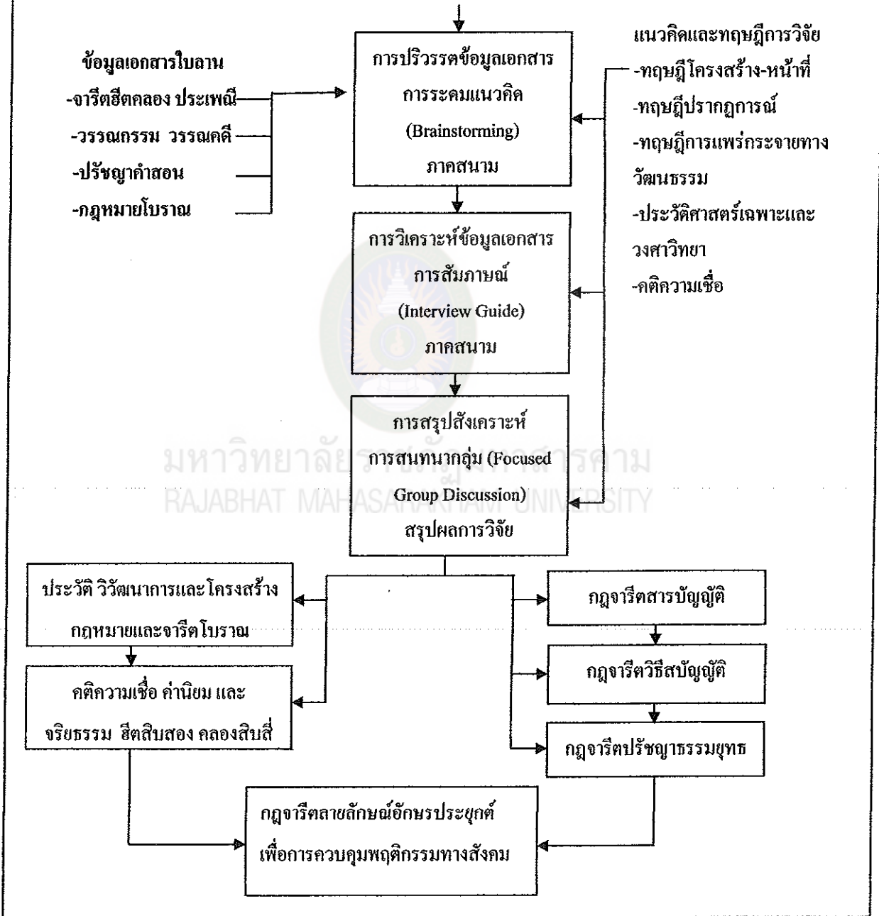
แผนภูมิที่ 3 กรอบแนวคิดในการศึกษาวิจัย

การวิจัยเชิงคุณภาพ (Qualitative Research) ปฏิบัติการแบบมีส่วนร่วม (Participant Action Research) วิเคราะห์ข้อมูลทางด้านเอกสาร (Documentary Research) เป็นการศึกษาค้นคว้าข้อมูลทางด้านประวัติศาสตร์ (Historical Approach) ปฏิบัติการกลุ่มระดมแนวคิด (Brainstorming) การสัมภาษณ์เชิงลึก (Interview Guide) ปฏิบัติการสนทนากลุ่ม (Focused Group Discussion)