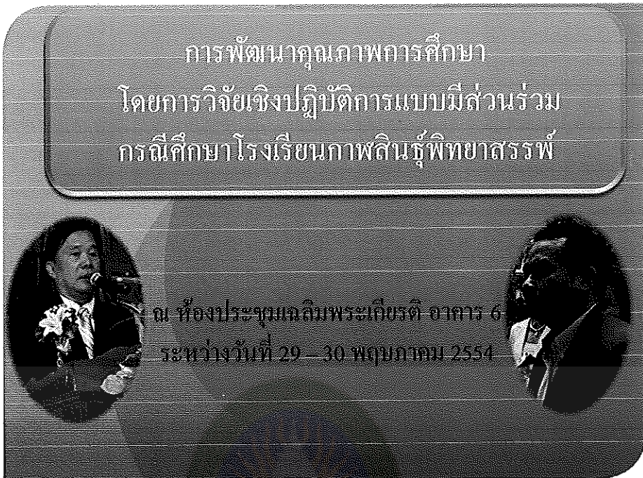
ภาพภาคผนวกที่ 3 การประชุมเชิงปฏิบัติการ