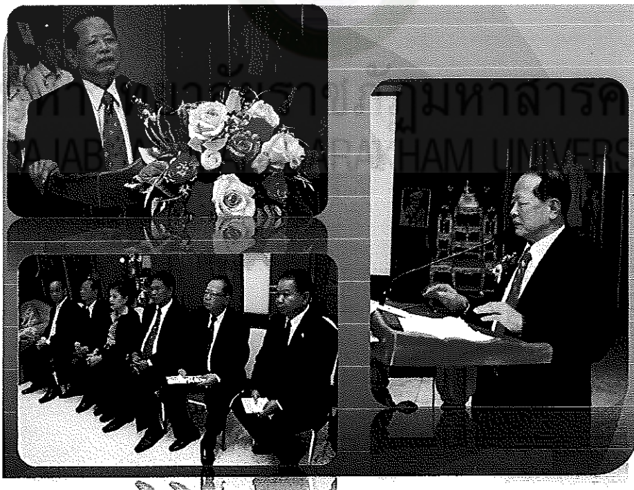
ภาพภาคผนวกที่ 4 คณะผู้บริหาร โรงเรียนเข้าร่วมประชุมเชิงปฏิบัติการ