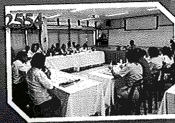
ภาพภาคผนวกที่ 1 การสนทนากลุ่ม