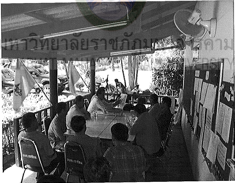
ภาพภาคผนวกที่ 4 มีการอภิปรายกันถึงปัจจัยที่มีอิทธิพลต่อการบุกรุกพื้นที่ป่าอย่างกว้างขวาง