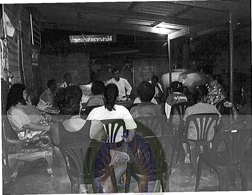
ภาพภาคผนวกที่ 1 ผู้วิจัยออกพบประชาชนเพื่อเตรียมเก็บข้อมูลการวิจัยระยะที่ 1