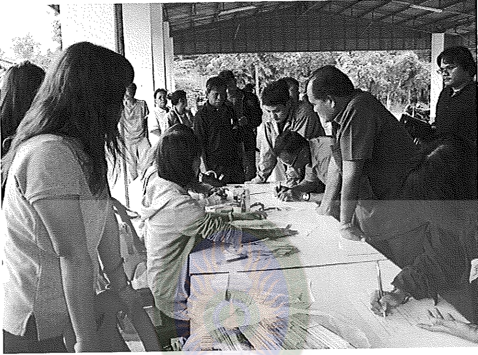
ภาพภาคผนวกที่ 5 ผู้เข้าร่วมโครงการลงทะเลเบียน