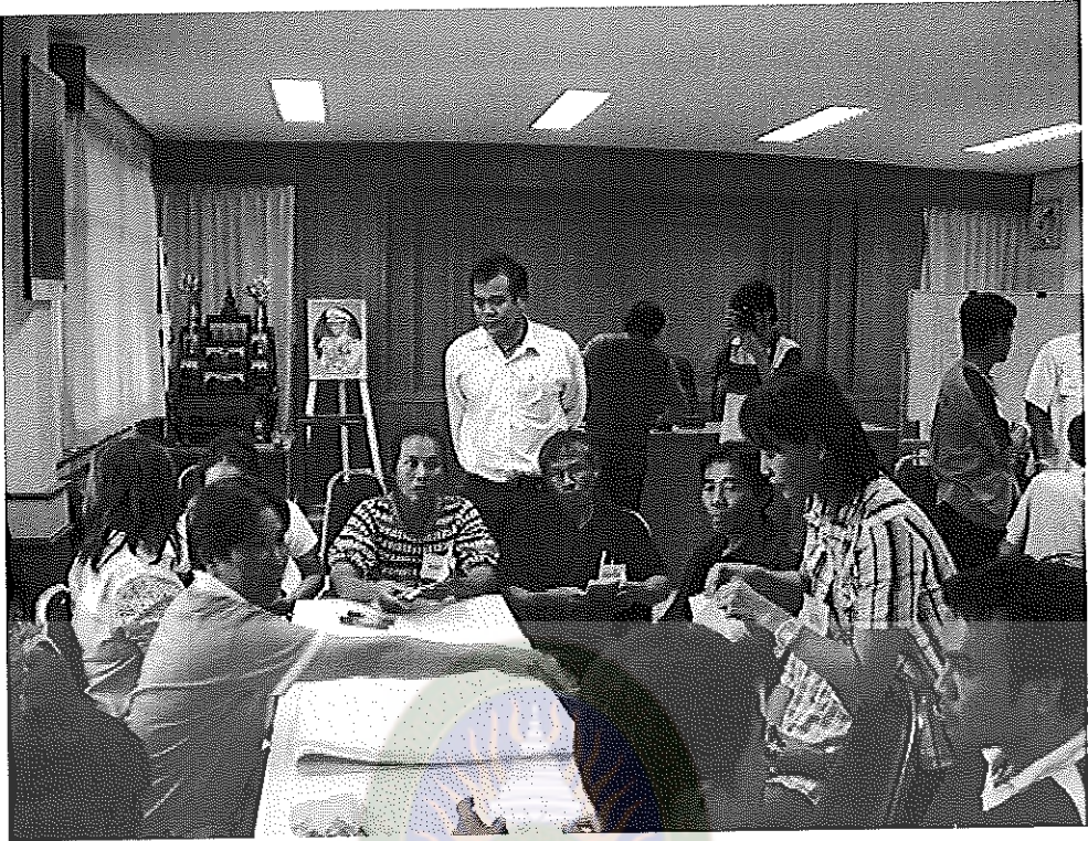
ภาพภาคผนวกที่ 7 ผู้ร่วมโครงการและเจ้าหน้าที่ทำกิจกรรมตามโครงการร่วมกัน