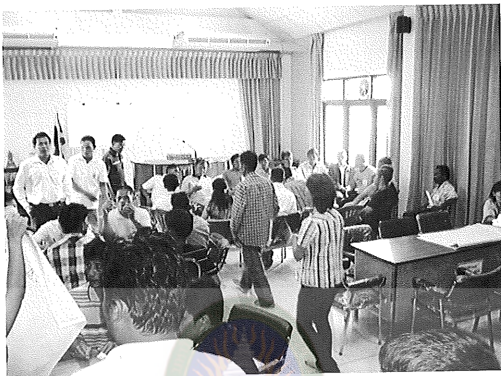
ภาพภาคผนวกที่ 9 ผู้ร่วมโครงการและเจ้าหน้าที่ทำกิจกรรมตามโครงการร่วมกัน