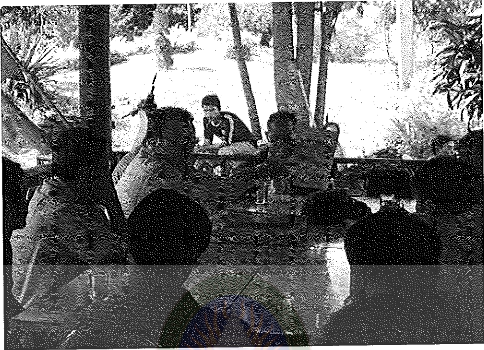
ภาพภาคผนวกที่ 3 ผู้เชี่ยวชาญชุดนักวิชาการวิพากษ์รูปแบบ (Model) จากผลการวิจัยระยะที่ 1