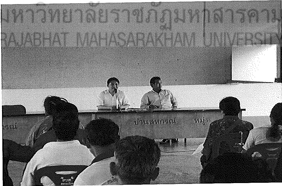
ภาพภาคผนวกที่ 6 ผู้วิจัยและเจ้าหน้าที่โครงการชี้แจงประชาชนที่ร่วมโครงการฯ