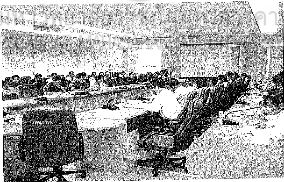
ภาพภาคผนวกที่ 2 ผู้วิจัยนำเสนอเค้าโครงวิจัยที่เกี่ยวกับการบุกรุกพื้นที่ป่าผ่านผู้บริหาร สำนักงานฯ