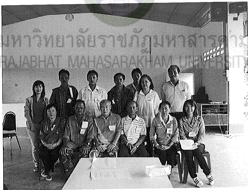
ภาพภาคผนวกที่ 10 กลุ่มผู้เชี่ยวชาญชาวบ้าน ที่ร่วมเป็นวิทยากรในโครงการ