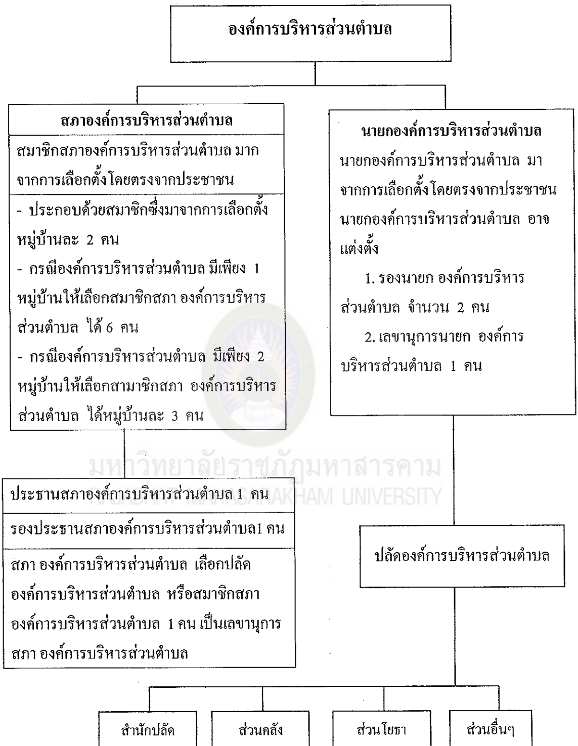
แผนภูมิที่ 1 แสดงโครงสร้างองค์การบริหารส่วนตำบล (พระราชบัญญัติสภาตำบล และ องค์การบริหารส่วนตำบล พ.ศ. 2537 แก้ไขเพิ่มเติม ฉบับที่ 5 พ.ศ. 2546)