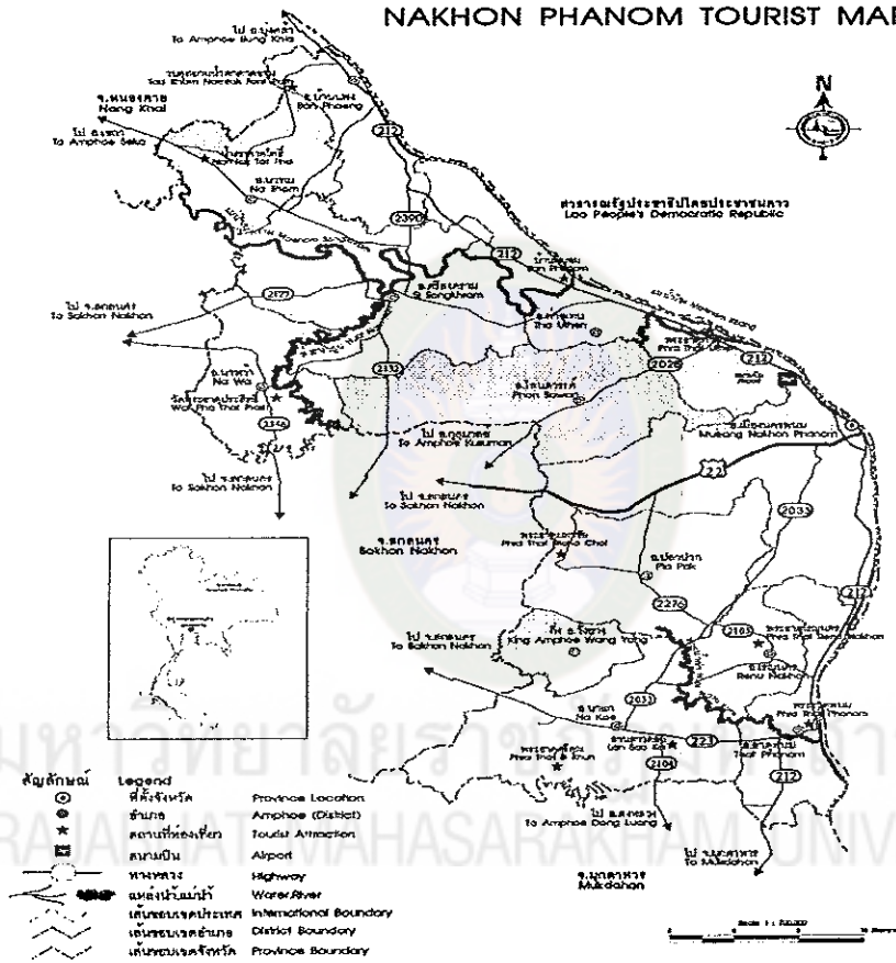
แผนภาพที่ 2 แผนที่จังหวัดนครพนม